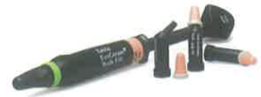
Slika 1. Bulk kompozit Tetric EvoCeram Bulk Fill (Ivoclar Vivadent). Preuzeto iz (3)