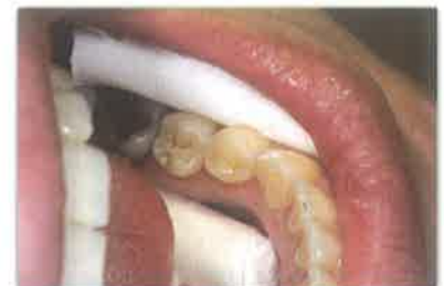
Slika 5. Završena preparacija kaviteta na donjem lijevom prvom premolaru.