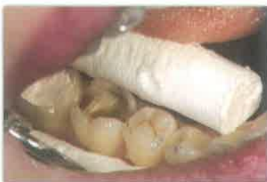
Slika 6. Bulk kompozitni ispun na donjem lijevom prvom premolaru (Tetric EvoCeram Bulk Fill).