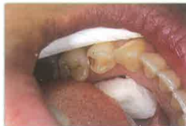
Slika 4. Prikaz polimerizacije bulk kompozita. Preuzeto iz (3)