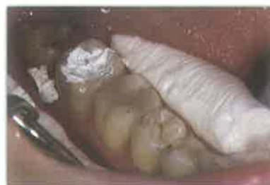
Slika 7. Bulk kompozitni ispun na donjem desnom prvom molaru (Tetric EvoCeram Bulk Fill).

* Slika 4-7. Fotografirano na Zavodu za restaurativnu stomatologiju i endodonciju Stomatološkog fakulteta u Zagrebu.