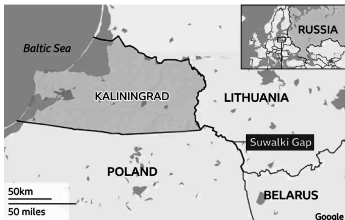
Slika 1. Prikaz Kalinjingradske oblasti s koridorom Suwalki