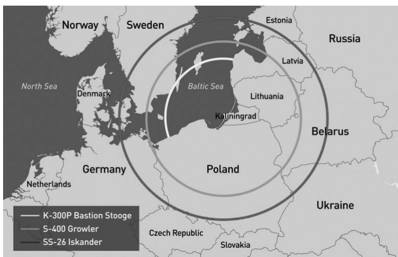
Slika 3. Prikaz dometa ruskog ključnog raketnog naoružanja u Kalinjingradskoj oblasti

Kako bi zaštitili Baltičko more, 2016. raspoređeni su sustavi K-300P Bastion-P (NATO naziva SS-C-5 Stoooge) s projektilima P-800 Oniks (NATO naziva SS-N-26 Strobele) s deklariranim dometom 300 km. Osim toga, Baltička flota je raketne korvete klase Buyan M, kao i jednu podmornicu, opremila projektilima Kalibr dometa 500 km, što predstavlja dodatnu projekciju moći (Muzyka 2021). Za protuzračnu obranu 2019. su u Kalinjingradsku oblast dopremljeni raketni sustavi S-400 (NATO naziva SA-21 Growler) dometa 400 km (Muzyka 2021). Vrijeme uvođenja ovih naoružanja jasno pokazuje kako se nakon demilitarizacije krajem 1990-ih radi o novoj militarizaciji ove zone, i to najmodernijim naoružanjem. Osim konvencionalne ugroze, prisutne su i informacijske operacije zastrašivanja jer su projektili Kalibr i Iskander sposobni nositi nuklearne glave. Sustavi uvedeni kao odgovor na NATO-ovu prisutnost nakon 2016. u svrhu stvaranja ruske inačice A2AD „balona“ predstavljaju osiguravanje strateške dubine koju joj geografski položaj ne dopušta.