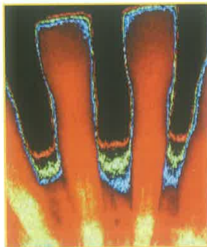
Osteopenija - rano otkrivanje osteoporoze preko osteopenije donje čeljusti