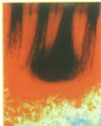
Analiza RVG-a svih struktura kosti i zuba. Obilna cista donje čeljusti 31, 41