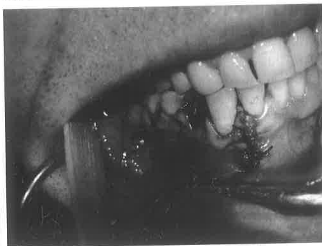
Slika 4. Mukoperiostalni režanj zašiven nakon operativnog zahvata odstranjenja cistične tvorbe po metodi Partsch II.

Operativni postupak radimo nakon što smo osigurali bezbolnost bilo lokalnom ili općom anestezijom. Za male ciste čeljusti zahvat je u najvećem broju slučajeva moguće provesti uz lokalnu ili provodnu anesteziju i u ambulantnim uvjetima. Zahvat započinje jednim od tipičnih rezova (Partsch, Pichler, Harnisch, Nowak–Peter i dr.). Nakon što smo izluštili cističnu čahuru, možemo koštanu šupljinu isprati s 3%-tnim vodikovim peroksidom, kako bismo bolje vidjeli jesu li na kosti zaostali djelići čahure, koji su obično crvenkasti u odnosu na bijelu površinu kosti. Ako je u cističnu čahuru stršao korijen ili više korjenova zuba, njih ćemo, nakon što smo izluštili cistu, apicektimirati.