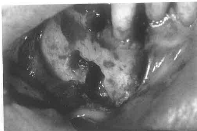
Slika 2. Prikazuje postoperativno područje gdje smo, nakon reza po Nowak-Peteru, učinili odstranjenje koštanog tkiva u projekciji patološkog supstrata te odluštiti cističnu tvorbu u cijelosti i ekstrahirali zaostali korijen pretkutnjaka.

U operativnom liječenju malih cista čeljusti osnovno je pitanje, da li je cista u vezi sa zubom. Kod radikularnih upalnih cista čeljusti korijen zuba strši u cistu. U slučaju da zub uzročnik želimo sačuvati potrebno je preoperativno provesti endodontsku obradu kanala, kako bismo ga preoperativno mogli ispuniti. Zub se puni na dan operacije oko jedan sat prije zahvata.