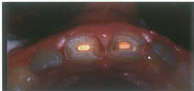
Slika 2. Ispun korijenskog kanala