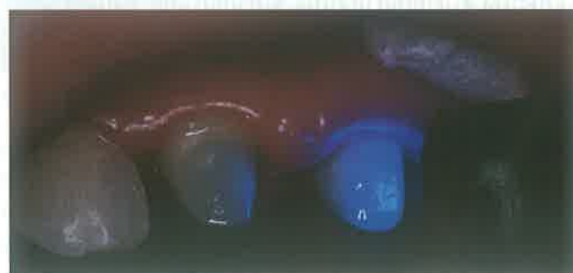
Slika 7. Preparirani bataljak

ili C-POST (RTD, Grenoble, France) izradio je Duret 1988. Ovaj kolčić posjeduje dobra biomehanička svojstva i modul elastičnosti sličan dentinu. Otporan je na koroziju i biokompatibilan. Moguće ga je odstraniti iz korijenskog kanala uz pomoć otapala i velikog Maillefer svrdla na početku zahvata, a završava se prikladnim Composipost svrdlom (10). Nedostatak ovog kolčića je crna boja.