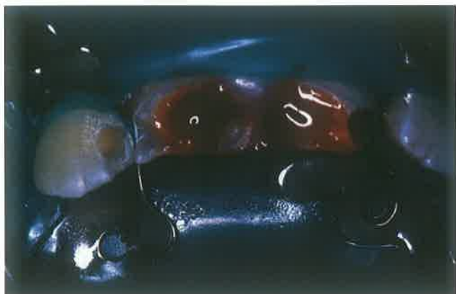
Slika 1. Fraktura gornjih inciziva u području zubnog vrata s eksponiranom pulpom