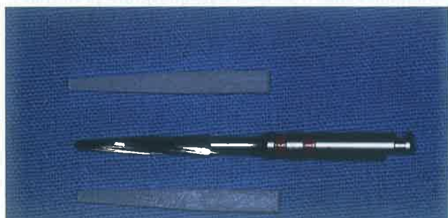
Slika 3. Intrakanalni Postec kolčić i svrdlo za preparaciju korijenskog kanala