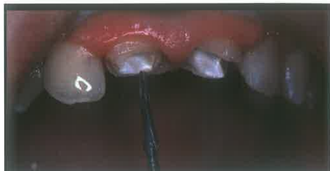
Slika 4. Preparacija korijenskog kanala

Kolčići bazirani na kompozitnim materijalima mogu sadržavati radioopakna karbonska vlakna (karbonski), karbon-kvarc vlakna (hibridni) pa sve do translucenčnih staklenih vlakana (FRC Postec) (8,9). Karbonski kolčić