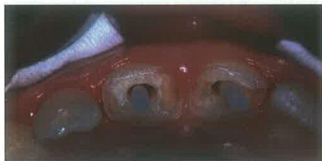
Slika 5. Prilagodba kolčića korijenskom kanalu