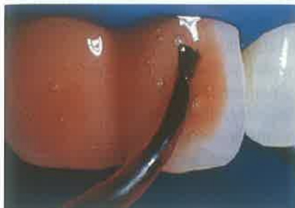
Slika 4. Nanošenje sredstva za izbjeljivanje na površinu zuba