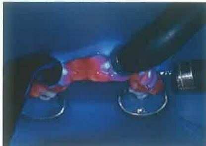
Slika 5. Grijanje i osvjetljavanje sredstva za izbjeljivanje