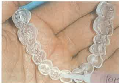
Slika 8. Matrica za izbjeljivanje kod kuće