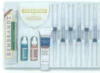
Slika 9. Rembrandt sustav za izbjeljivanje zubi