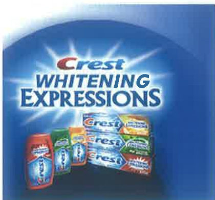
Slika 10. Zubne paste za izbjeljivanje

Iako postoje mnogi sustavi za izbjeljivanje sličnog sastava i djelovanja, za optimalan rezultat potrebna je suradnja pacijenta i terapeuta te vrlo pažljivo postupanje kako bi se spriječila pojava komplikacija.