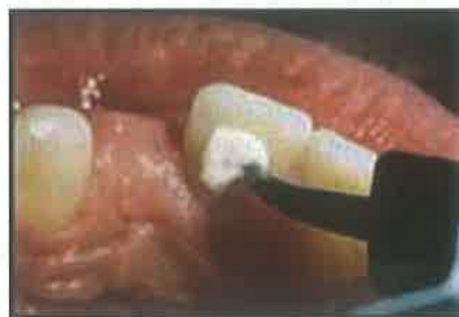
Slika 12. Aplikacija sredstva za izbjeljivanje nevitalnih zubi - Walking bleach