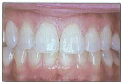
Slika 7. Zubni luk nakon završenog izbjeljivanja

provodi se izradom matrice (individualne žlice) u koju se nanosi materijal za izbjeljivanje i aplicira na cijeli zubni luk. Obično se izbjeljuje čeljust po čeljust, a ona koja se ne izbjeljuje služi za kontrolu nijanse promijenjene boje zuba. Matrica se nosi uglavnom 1-4 sata dnevno, ali i duže, što ovisi o sustavu za izbjeljivanje koji se koristi. Terapija traje 2-6 tjedana tijekom kojih se stanje redovito kontrolira u ordinaciji. Moguće je kombinirati obje tehnike, koristiti jače sredstvo u ordinaciji uz aplikaciju topline uz blaže