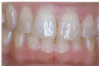
Slika 1. Klinička situacija prije izbjeljivanja