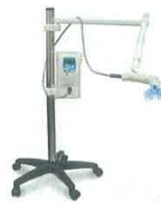
Slika 6. Aparat za osvjetljavanje i grijanje sredstva za izbjeljivanje (iluminator)