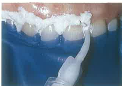
Slika 2. Nanošenje zaštitne paste na gingivu prije postavljanja koferdama