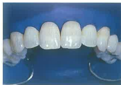
Slika 3. Postavljen koferdam za zaštitu mekih tkiva