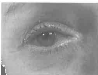
Slika 2: Keratoconjunctivitis sicca

Danas pod dijagnozom SS podrazumijevamo kronični upalni autoimuni poremećaj čiji primarni oblik karakterizira kserostomija (slika 1) i KCS (slika 2) i koji se često naziva još i «sicca» sindromom, dok u sekundarnom obliku uz suhoću usta i suho-