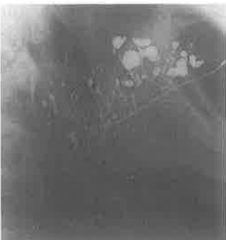
Slika 6: Kavitarne sijalektazije

Sposobnost slinovnica da aktivno koncentriraju 99-m Tc-pertehnat prepoznata je kada se