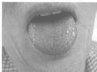
Slika 1: Xerostomia

Kada su 1953. Morgan i Castleman istaknuli histološke podudarnosti pacijenata prije vođenim pod dijagnozom Mikuliczeva sindroma, smatralo se da je ustvari riječ o jednoj te istoj bolesti pa se neko vrijeme koristio naziv "Mikulicz – Sjögren sindrom".