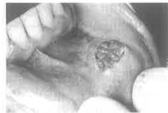
Slika 3: Uzimanje uzorka za biopsiju

Vrijednost biopsije u dijagnostici ovog sindroma je nedvojben, no naravno samo ukoliko patolog raspolaze odgovarajućim uzorkom tkiva i ukoliko ga zna «pročitati». Uzorak mora biti dobiven s mjesta gdje je nadležna sluz-