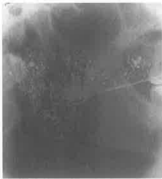
Slika 5: Globularne sijalektazije