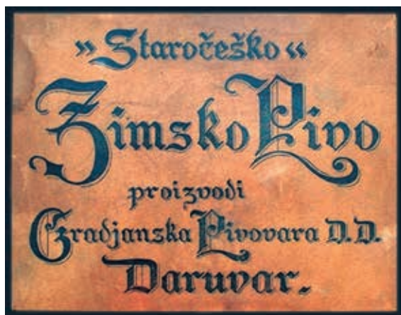
1893. Prvo pivo koje je ponijelo ime Staročeško bilo je Staročeško zimsko pivo iz 1893. godine (reklamna tabla, Pivovara Daruvar)