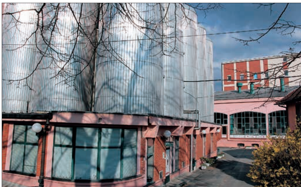
Iz tvorničkog kruga