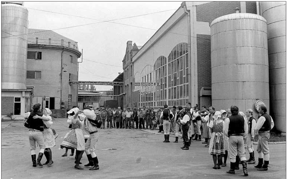
Nastup češkog folklornog ansambla Škoda iz Plzeňa u dvorištu pivovare 1985.