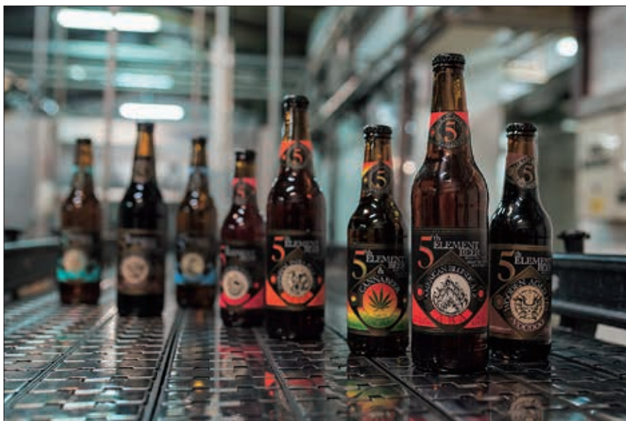
Proizvodna linija Peti element