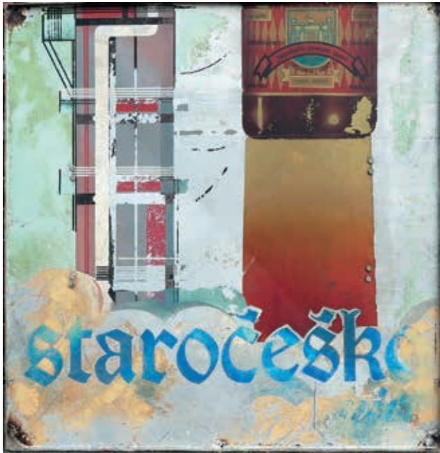
Dio reklamnog panoa iz sedamdesetih godina (Pivovara Daruvar)