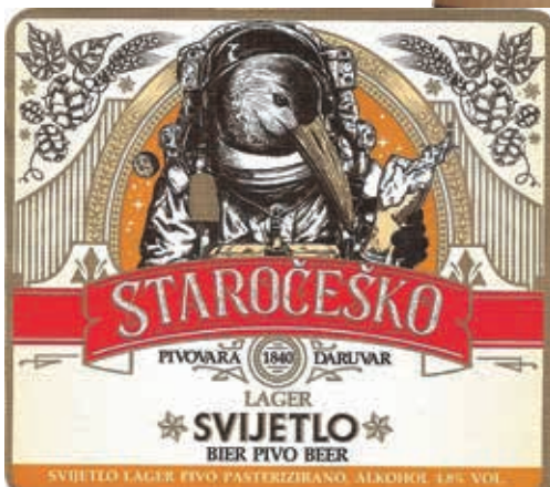
1940. – 2018. Etikete daruvarskog piva iz raznih razdoblja