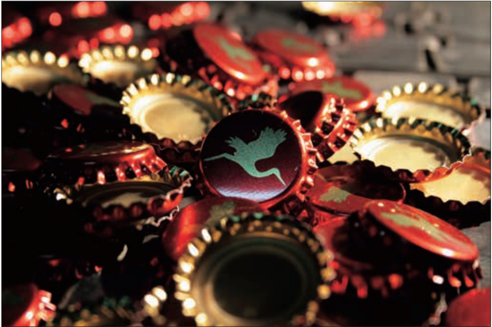
Čepovi Daruvarskog piva