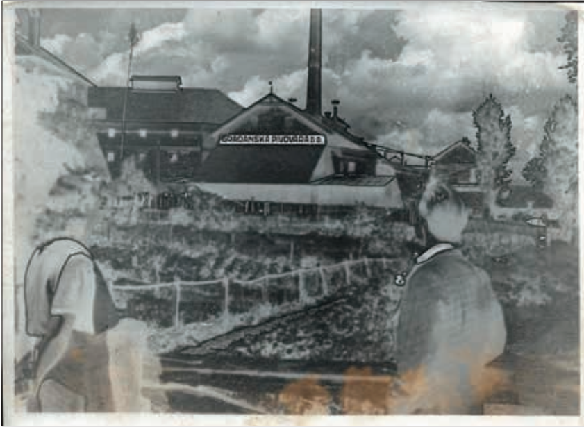
Gradanska pivovara Daruvar 1940. (Pivovara Daruvar)