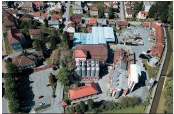
Panorama Pivovare Daruvar