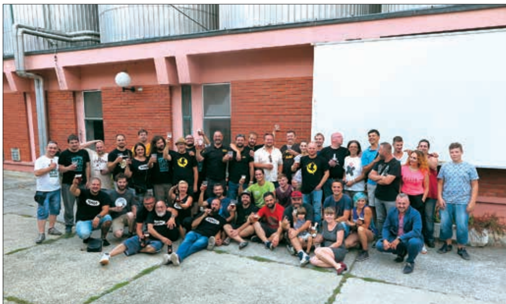
Predstavnici hrvatskih craft pivovara na Danima piva u Daruvaru 2017. godine