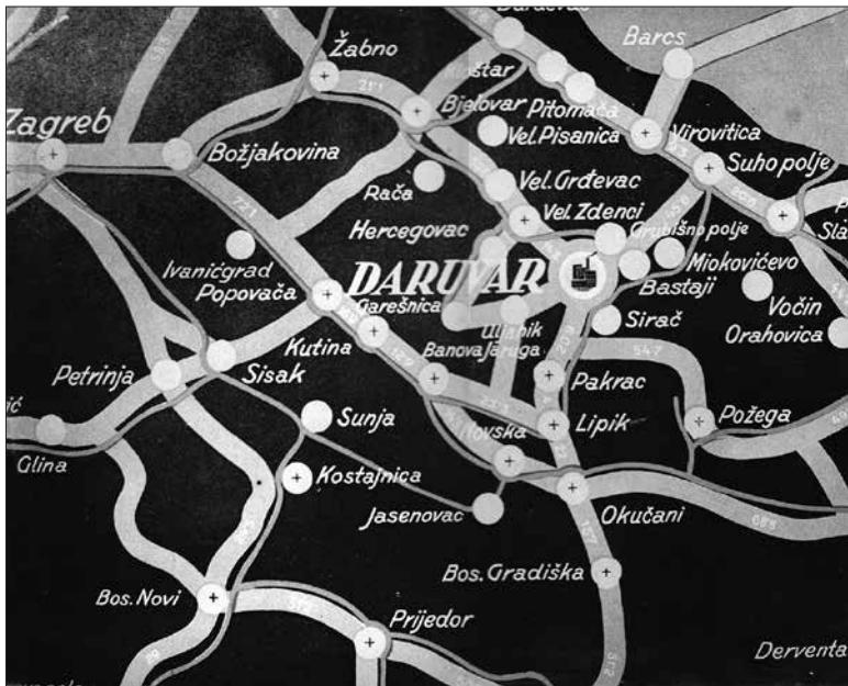
Distribucija Daruvarskog piva 1965. godine