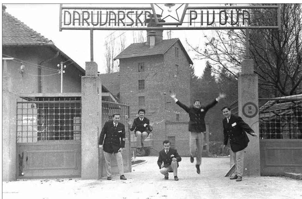
Pivovarski vokalno instrumentalni sastav Gambrinusi 1960-ih godina