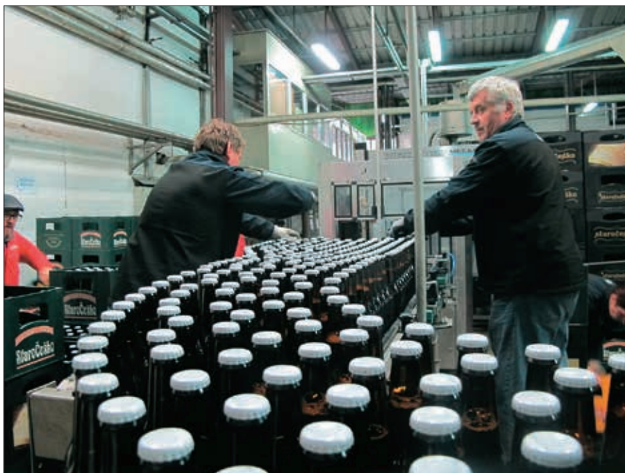
Detalj iz punionice