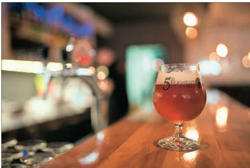
Daruvarsko pivo