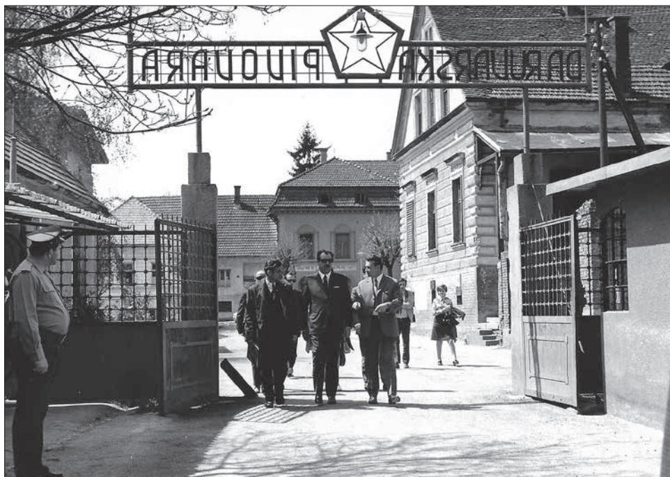
Posjet visoke delegacije 1970. godine (Pivovara Daruvar)