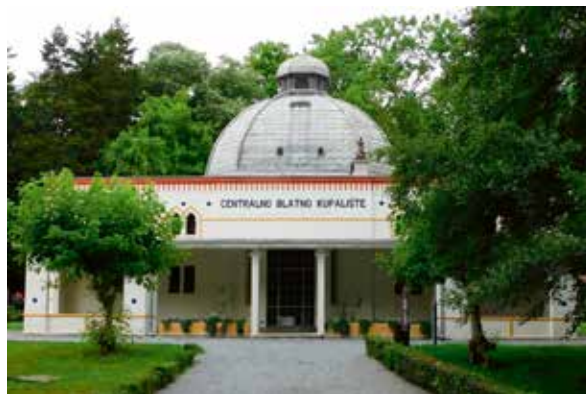
Slika 6: Centralno blatno kupalište