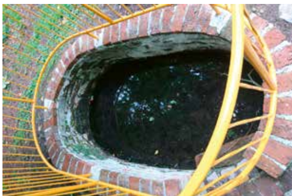
Slika 3: Ograđeno izvorište u obliku manje kade s ulaznim stepeništem

U Liečničkom viestniku broj 6 iz 1894. godine objavljen je novi opis Daruvarskog kupališta koje tada ima Antunovu kupku, Ivanovu kupku, Aninu blatnu