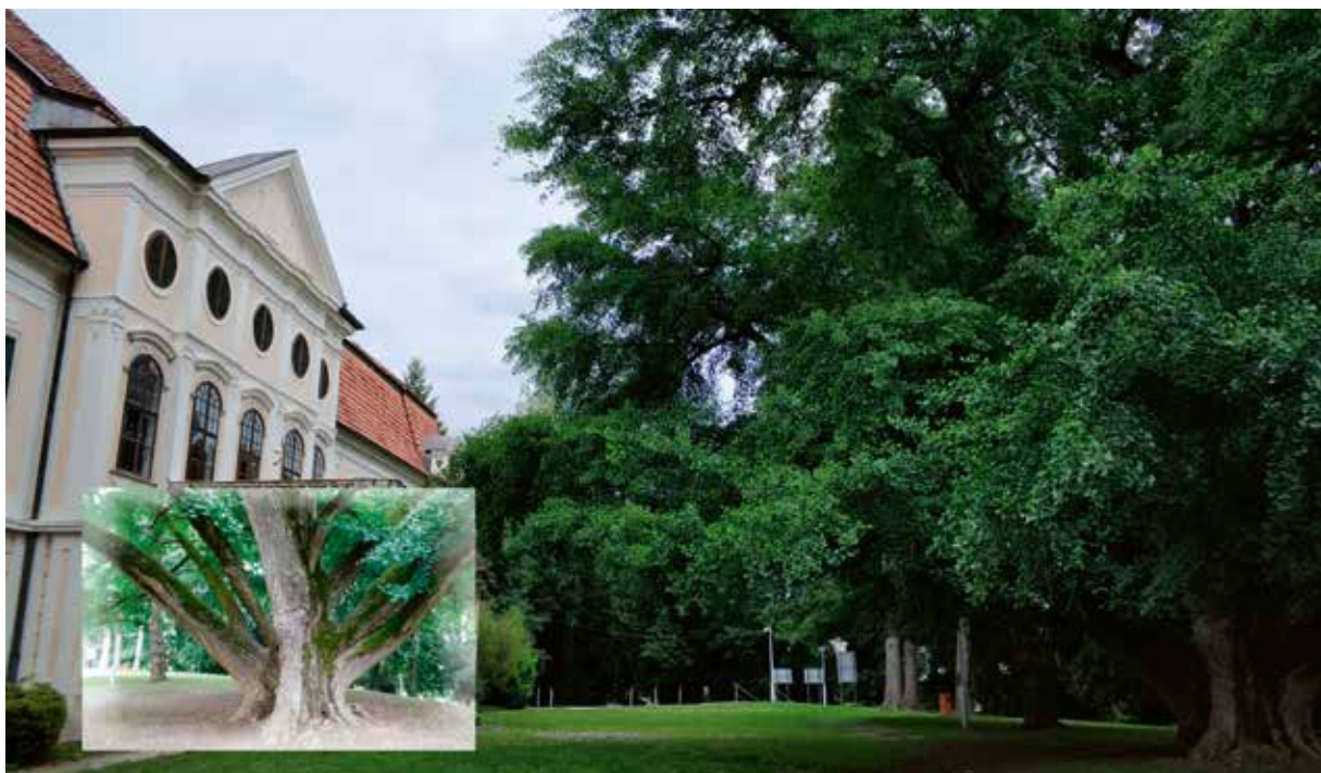
Slika 15: Dvorac Janković i Adam i Eva, ginko biloba

Najveća su znamenitost parka, uz daruvarski dvorac Antuna Jankovića, dva stabla ginka. Muški primjerak Daruvarci zovu Adam, a ženski Eva. Zbog njihove zajedničke povijesti nastala je priča o zaljubljenom