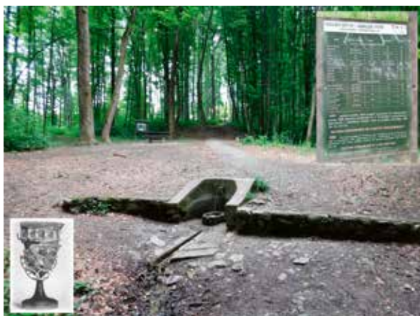
Slika 11: Julijev izvor, analiza vode, diatretna posuda/zdjela

Posuda je visoka 95 mm, promjer ruba 89 mm, dubina mreže 6 – 8 mm, debljina stijenke 1 – 1,5 mm, a visina slova 14 mm. Pehar ima tri reda oka i natpis FAVENTI... što znači sklonima. Original se nalazi u Kunsthistorisches Museum Wien / Muzej povijesti umjetnosti u Beču.