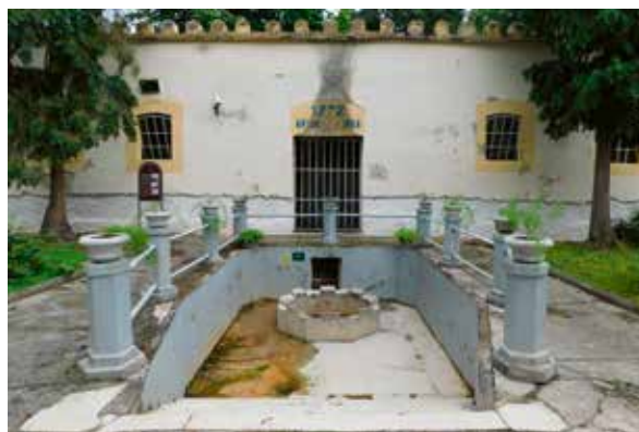
Slika 4: Antunovo vrelo