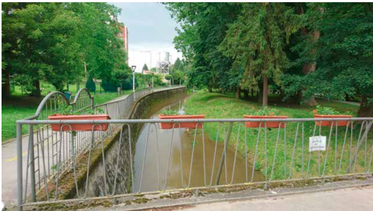
Slika 17: Potok Toplica

Toplica je najveća lijeva pritoka llove. Većim dijelom godine Toplica je tek miran, plitak potočić. Teško