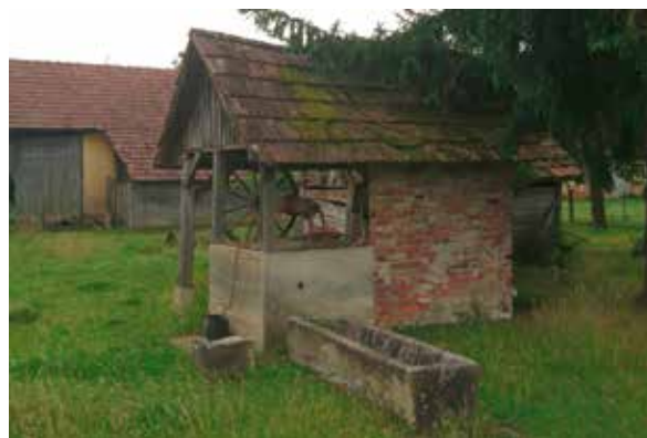
Slika 13: Bunar – nekada ...