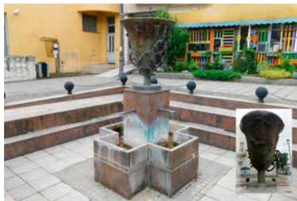
Slika 12: Tošin bunar

U podnožju nekadašnjeg stambenog dijela rimskog municipija nalazi se Rimski izvor. Ime je dobio po rimskim arheološkim nalazima. Csaplovics je zapisao da se iznad rimskog bunara nalaze tri stara, obzidana a nezasvođena groba, ukašena mozaikom. Tu su od sredine 18. stoljeća pronađene razne rimske starine (kruna, zlatne narukvice, zlatna ogrlica s dragim kamenjem ...) i poslana u Budimpeštu. Kasnije je nazvan Julijev izvor ( Julius Brunnen ), po vlastelinu grofu Juliju Jankoviću Daruvarskom. Domaće ga stanovništvo zove i „Izvor ljubavi“. Legenda kaže da će se onaj tko pije vodu s njega uskoro zaljubiti.