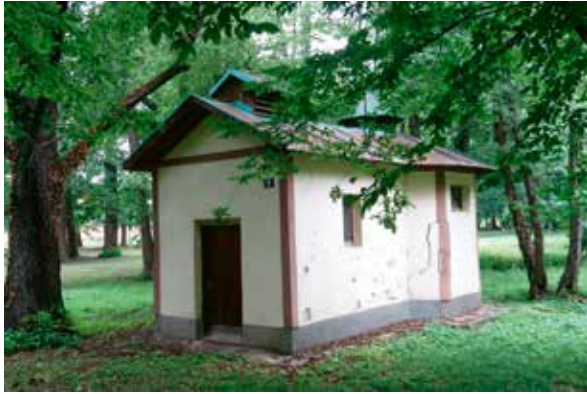
Slika 7: Sigentalova (Marijina) kupka