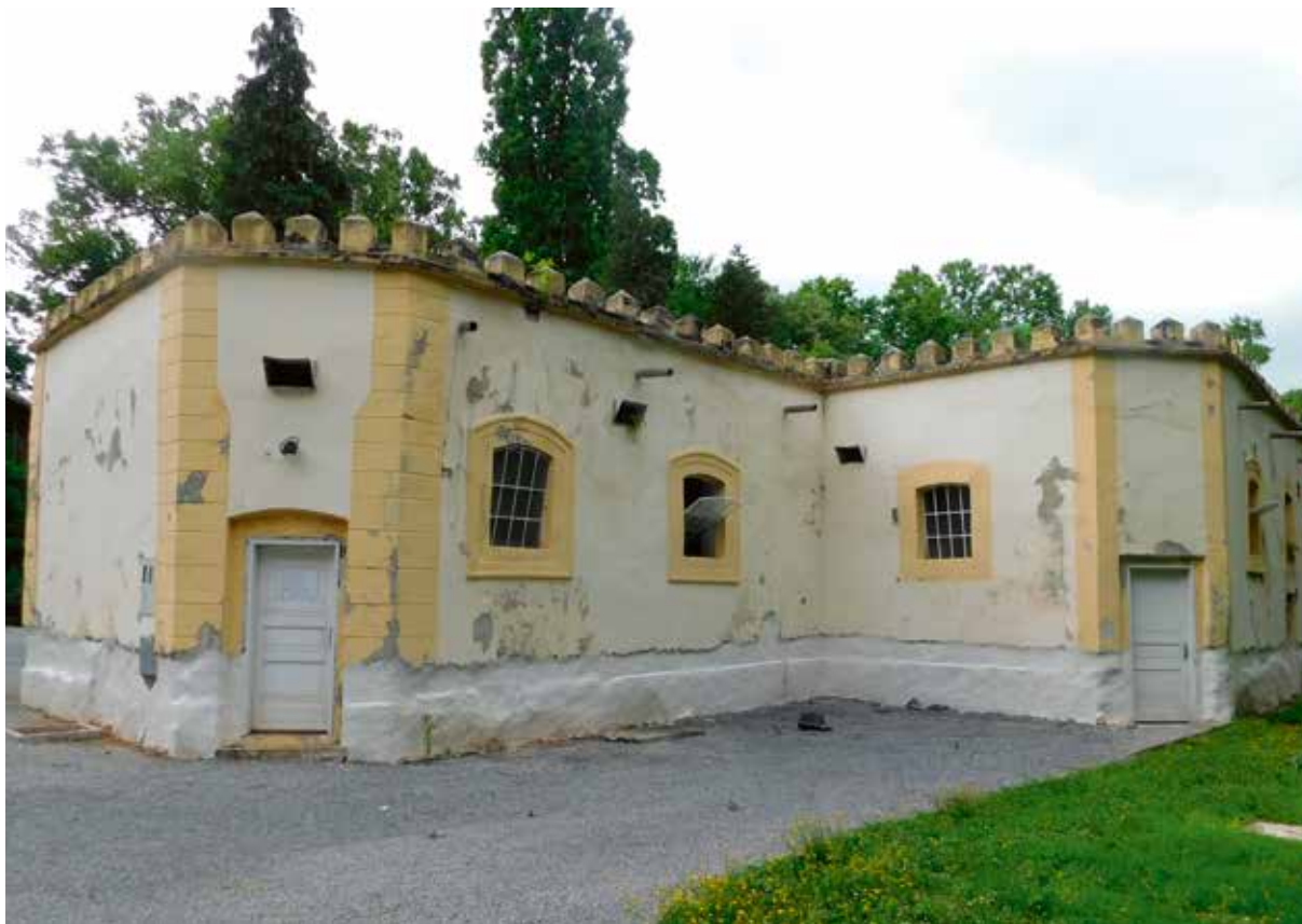
Slika 2: Antunova kupka

Nadalje, navodi kako je u vrijeme kad je zapis rađen obuhvaćen samo jedan jedini izvor (Antunova kupka), koji su makedonski zidari kao izvanredno vješti u građenju toplih kupki, 1762. godine uredili u pravo kupalište s 4 kupališna mjesta. Ova kupka, kod koje je ... podignuto svratište, sjenovita šetnica s gustim drvećem i druge korisne stvari za udobnost gostiju, jako dolazi na glas te je iz godine u godinu sve više posjećuju. Kad se dobro okupaju hromi, ljudi koji trpe od kostobolje i drugi od ukočenosti, malo pomalo se izliječe i naposljetku ovdje ponovno nađu izgubljeno zdravlje. Za bolesne vojnike, koje ovamo šalju iz čitave Slavonije, izgrađena je pokraj kupki vojarna na trošak grofa Daruvarskog. A dvadeset koraka od kupki, prema obližnjem visokom brijegu iz kojeg izbijaju topli izvori, otkrivene su ispod zemlje rimske kupke s mnogobrojnim starinama. Pretpostavlja da su te kupke zatrpane uslijed potresa i tijekom vremena potpuno pale u zaborav. Nema ništa osim jedne lokve u koju dovode hrome konje, a snaga vode za kratko ih vrijeme izliječi.