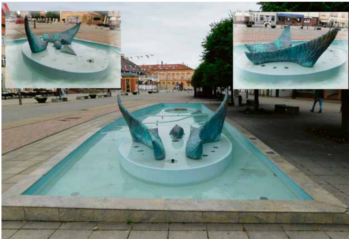
Slika 19: Fontana ždrala, autor: M. Šegan

most u Daruvaru. Bio je veza između dvorca, naselja i kupališta. Kasnije je postao pješački most.