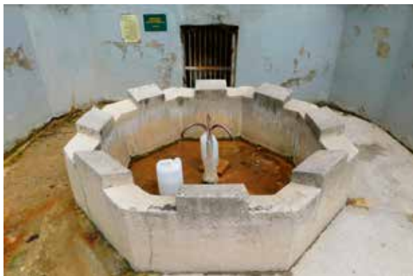
Slika 5: ... i danas se voda koristi za piće