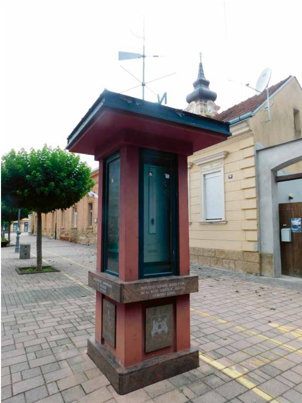
Slika 18: Meteorološki stup

je povjerovati da može 'podivljati' toliko da odnese mostove, ljude i sve pred sobom. Šezdesetih godina (1957.) nabujala Toplica poplavila je lječilišni park, a voda je sezala čak do prve ukrasne crte na fasadi Centralne blatne kupke. Velika poplava ponovila se 1961. godine.