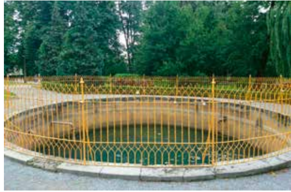
Slika 8: Ivanovo vrelo „Zdenac želja“, ispred Ivanove kupke, termalni izvor uz hotel „Arcadia“