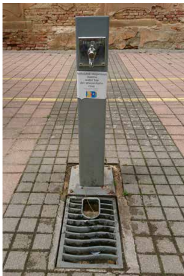
Slika 14: ... danas je voda u kućama i na javnim prostorima - špina