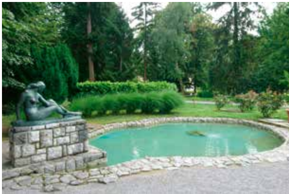
Slika 9: Kupačica (Gola Maja), Antun Augustinčić