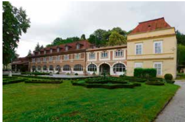
Slika 10: Vila Arcadia, šinobus i ostatak Ivanove kupke

kupku, Siegenthalovu kupku, Marijinu blatnu kupku, Skupnu i novu blatnu kupku. Pred Antunovom kupkom nalazi se Antunovo vrelo, a pred Ivanovom kupkom Ivanovo vrelo. Vlasnici su brinuli i za smještaj gostiju te su izgrađeni prateći ugostiteljski i smještajni objekti. Kupalište je imalo Švicarsku kuću kraj Antunove kupelji i novu kuću kraj Ivanove kupelji, a bilo je i stanova u privatnim kućama.