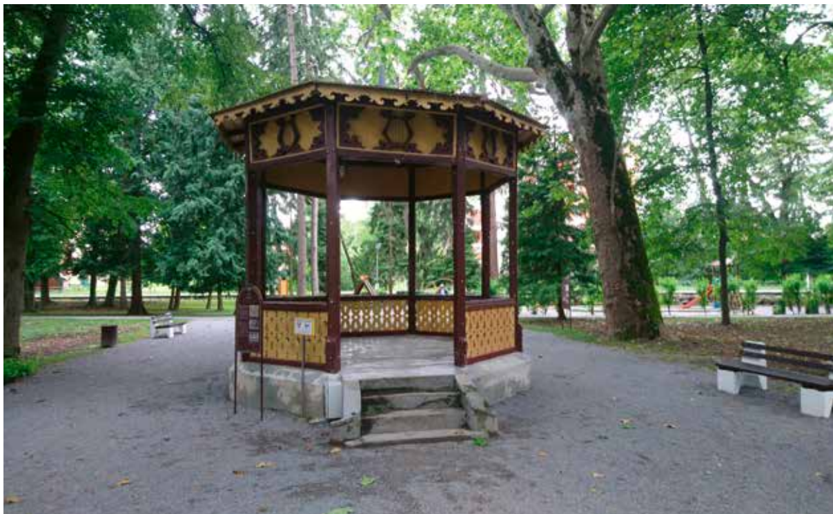
Slika 16: Glazbeni paviljon

ginku. Muško je stablo najveći i najstariji primjerak te vrste u Hrvatskoj te drugi najstariji u Europi. Posađen je oko 1777. godine. Opseg debla mu je veći od sedam metara. Zaštićen je kao spomenik vrtno arhitekture. Zahvaljujući osvojenoj tituli Hrvatskog stabla 2019. godine, 'Zaljubljeni ginko' iz Daruvara predstavljao je Hrvatsku u natjecanju za Europsko stablo 2020. godine te u konkurenciji između 16 zemalja osvojio drugo mjesto.