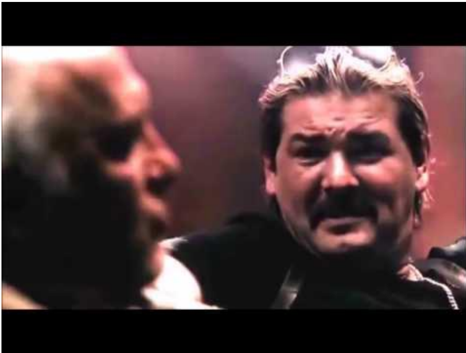
Slika 3: Nafaka(2006.), https://www.youtube.com/watch?v=7j3vv_h2Ph4