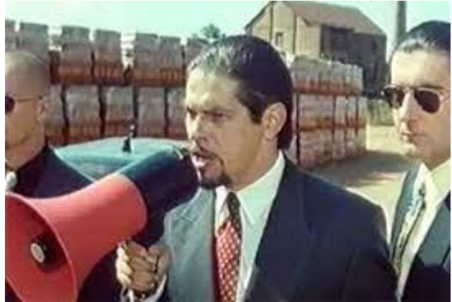
Slika 2: Crvena prašina (1999.), http://www.filmski.net/filmovi/2455/crvena_prašina .