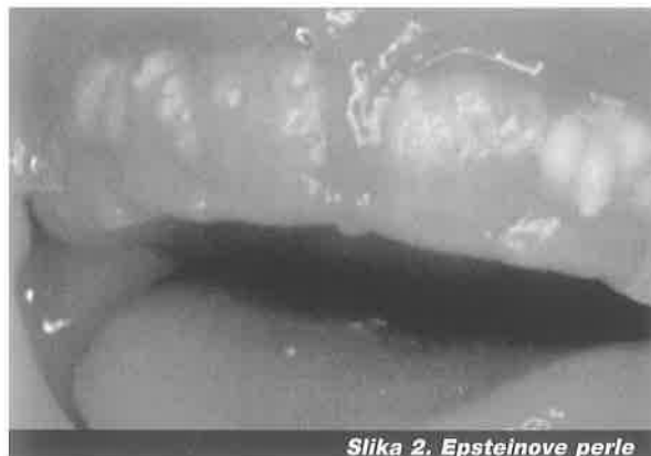
Slika 2. Epsteinove perle

Etiologija preranog nicanja zuba je dvostruka: formiranje zametka previše blizu površine usne šupljine (izvan fizioloških granica) i povećana hormonska aktivnost. Prerano nicanje se