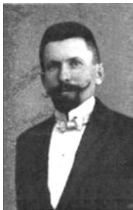
IVAN MILAVEC (1874. – 1915.)

Ovaj rad posvećen je jednomu od najznamenitijih slovenskih orguljara – Ivanu Milavcu i njegovim najvažnijim orguljama, koje je izradio za katedralu sv. Nikole u Ljubljani.