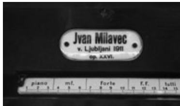
Slike 3, 4 i 5: Sviraonik, foto: Gregor Klančič

važnosti samokritike u planiranju obnove, prvi je korak prema željenom cilju.