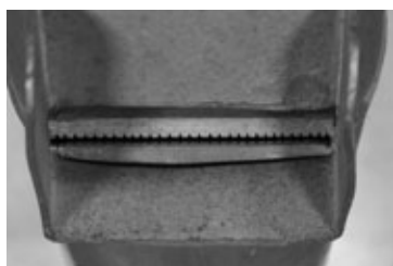
Slika 7: Kvintaten 8' sa I. manuala (ton H)