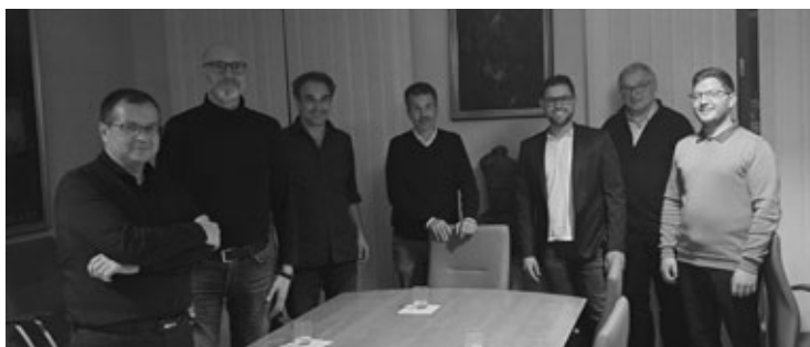
Slika 8: Komisija za obnovu orgulja u ljubljanskoj katedrali (ponedjeljak, 3. listopada 2022.)

da mjernih tehnika, koja ni na koji način nije utjecala na materijalni sadržaj instrumenta. Dokumentiranjem postojećega stanja instrumenta time je dana objektivna osnova za daljnja istraživanja.