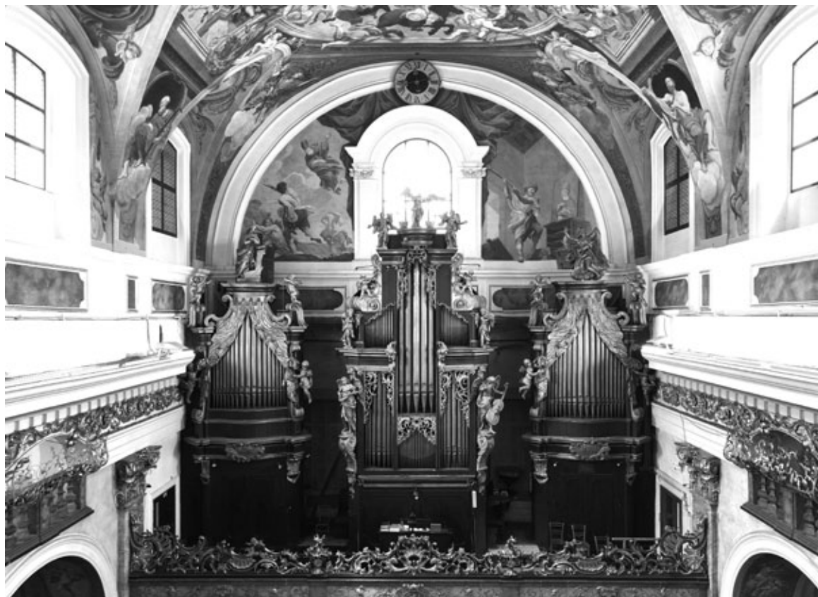
Slika 2: Milavčeve orgulje u ljubljanskoj katedrali (1911., op. 26)

Milavčeve orgulje u starim baroknim ormarima.