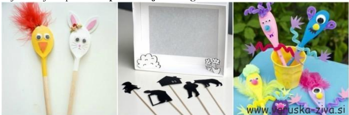
SLIKA 3- RAZLIČITE LUTKICE

U svakom slučaju, utjecaj na emocionalni razvoj djeteta ne treba zanemariti . Uz njegovu pomoć možemo pobuditi jače emocije , koje se kasnije također mogu osvijestiti i raspraviti s djecom. Lutku učitelj također može koristiti za prepoznavanje djetetovih emocija i razgovor o njima, sa samim djetetom. Djeca koja često pokazuju znakove agresije ili pokazuju emocije na ovaj ili onaj način na neprimjeren način mogu se naučiti strategijama za njihovo prikladnije izražavanje kroz rad s lutkom . Najčešće se lutka koristi za učenje društvenih situacija , kroz koje djeca uče različite alternative kako bi odgovorila u određenim društvenim kontekstima . Kao i kod svih oblika dramatizacije, igranje kroz lutku omogućuje djeci da suosjećaju s razigranim ljudima, razviju empatiju, iskuse životne situacije i suosjećaju s rješavanjem problema predstavljenih u igri .