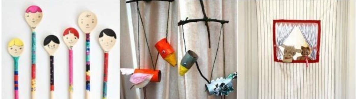
SLIKA 1 – VRSTA LUTKE

Lutka je mala figura koja predstavlja živo biće i namijenjena je uprizorenju. Tijekom studija pedagozi su relativno dobro upoznati s njegovom ulogom i prednostima ili prednostima uključivanja u obrazovni proces. To je sredstvo koje olakšava komunikaciju , jer se uz njegovu pomoć može formirati neizravan dijalog s djetetom. Istina je da ga vodi odrasla osoba, ali djeca to doživljavaju kao samostalno živo biće koje im se obraća prilikom kvalitativnog izvođenja. Međutim , zahtjevi se također mogu zamijeniti . Tijekom vremena, lutka se također može ponuditi djetetu tako da je oživi.