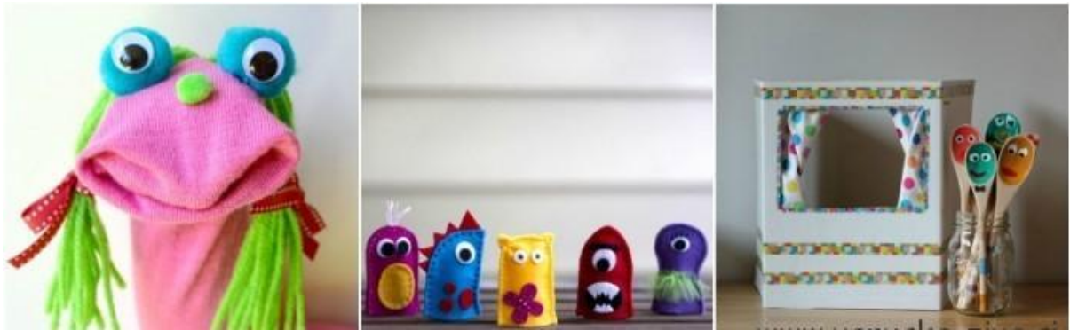
SLIKA 2– VRSTA LUTKE

U svakom slučaju, utjecaj na emocionalni razvoj djeteta ne treba zanemariti . Uz njegovu pomoć možemo pobuditi jače emocije , koje se kasnije također mogu osvijestiti i raspraviti s djecom. Lutku učitelj također može koristiti za prepoznavanje djetetovih emocija i razgovor o njima, sa samim djetetom. Djeca koja često pokazuju znakove agresije ili pokazuju emocije na ovaj ili onaj način na neprimjeren način mogu se naučiti strategijama za njihovo prikladnije izražavanje kroz rad s lutkom . Najčešće se lutka koristi za učenje društvenih situacija , kroz koje djeca uče različite alternative kako bi odgovorila u određenim društvenim kontekstima . Kao i kod svih oblika dramatizacije, igranje kroz lutku omogućuje djeci da suosjećaju s razigranim ljudima, razviju empatiju, iskuse životne situacije i suosjećaju s rješavanjem problema predstavljenih u igri .