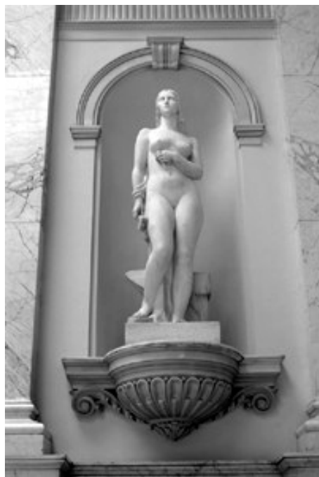
Slika 6. Zanatstvo , Narodna skupština Beograd

Na zapadnoj fasadi, iznad ulaznih vrata smještena je luneta s muškim likom. Ponovo se radi o aktu mladića, na plitkoj plinti, s draperijom omotanom oko donjeg dijela tijela i prebačenom preko desnog bedra. Mladić je u poluklečećem položaju. Lijeva noga je savijena u koljenu, prstima i koljenom postavljena na bazi, dok je desna ispružena prema naprijed. Objema rukama okreće polugu preše. Preša i draperija postavljene su na perspektivno prikazan kubus, a na drugoj strani tijela nalaze se tri geometrizirana nabora draperije. Preša je sugerirana okomicom tordiranih ureza i horizontalnom polugom na kojoj su obje ruke figure. U gornjem lijevom dijelu lunete nalazi se stilizirani grb Dubrovnika, reduciran na štit s četiri horizontalno postavljene istaknute fasete, koje se izmjenjuju s isto toliko urezanih. Preša s draperijom između baze i poluge, koju okreće muški lik, vjerojatno predstavlja jednu od faza postupka bojenja tkanina, pri čemu se koristi preša. Jer suknarstvo predstavlja tradicionalni dubrovački zanat i ujedno značajan gospodarski zamašnjak privrede Dubrovačke Republike i jer su dubrovačke tkanine bile važan izvozni proizvod, te bi upravo zbog povijesnog značaja ove privredne grane figura mogla predstavljati Zanatstvo .