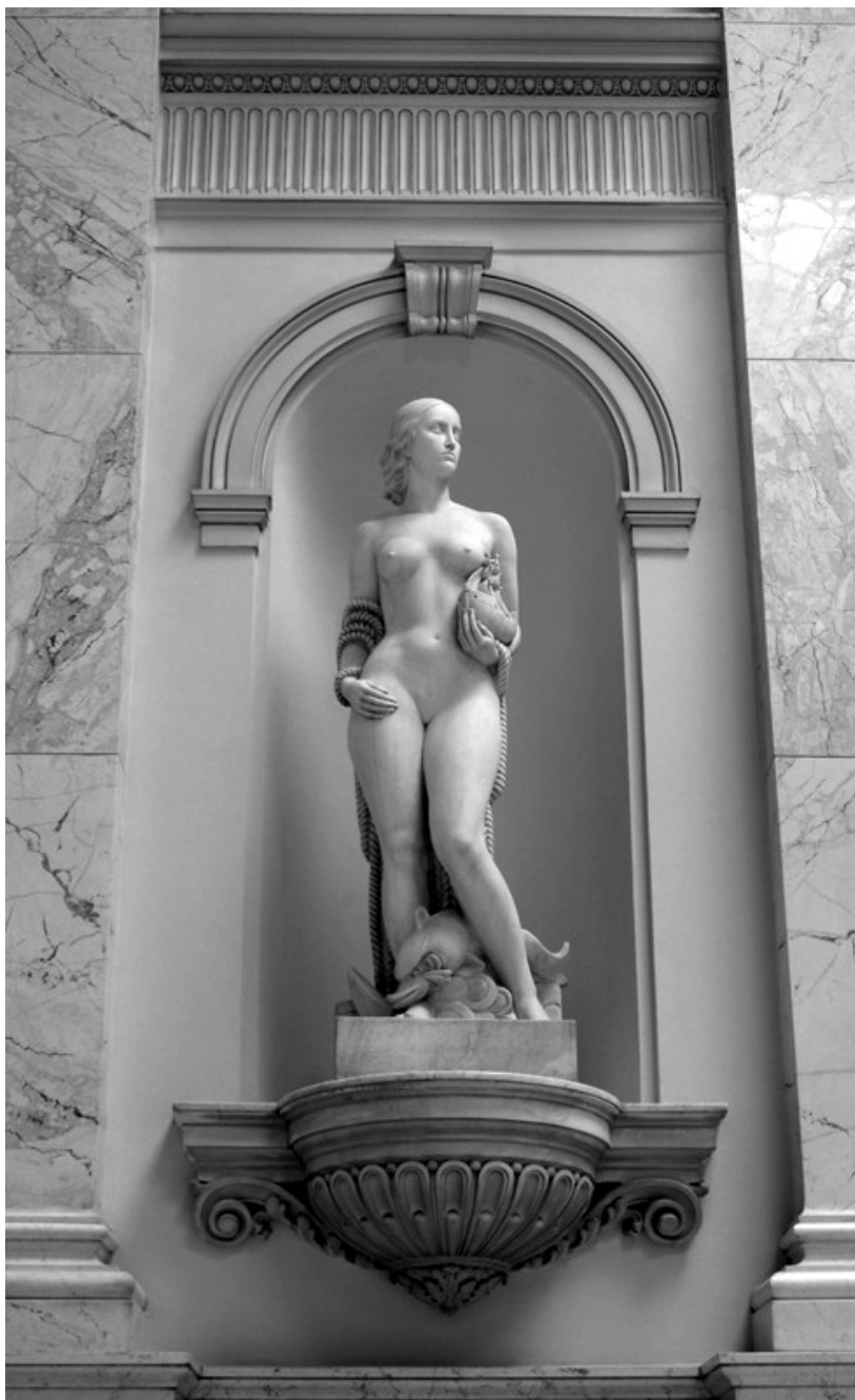
Slika 4. Pomorstvo , Narodna skupština Beograd