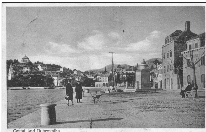
Cavtat kod Dubrovnika

Pomicanjem i spuštanjem u parternu zonu, u razinu očista gledatelja, zadržana je prethodna orijentacija na zapad, iako se sada skulptura nalazi na manje uočljivu mjestu. Na svom izvornom položaju skulptura se nalazila do razdoblja 1956/8., a zatim je, za vrijeme uređenja Kneževa dvora, koje se odvijalo u tom periodu, premještena na današnju lokaciju. 5