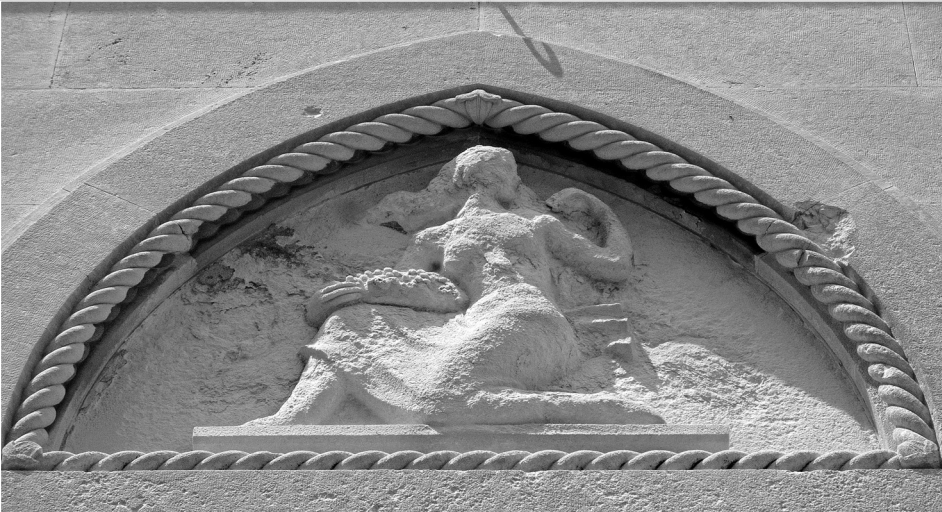
Slika 2. Istočna luneta Narodne banke, Poljodjelstvo

Luneta na istočnoj strani zgrade dosta je oštećena atmosferilijama i utjecajem morske soli, tako da je ženska figura u luneti potpuno nagrižene površine i prekrivena kalcifikatima kamena. Glatko polje lunete, vidljivo na drugim reljefima, ovdje je potpuno izbrazdano. Ženska figura postavljena je centralno, na plitkoj plinti blago podignutoj iznad grede nadvratnika. Figura je u poluklečećem položaju, lijeve noge savijene u koljenu, a desne ispružene naprijed. Desna ruka savijena je u laktu i prstima, pridržava posudu s groždem i plodovima naslonjenu na bedro. Lijeva ruka je podignuta, savijena u laktu, šake ispružene prema licu. Iza glave je vidljiva draperija pokrenuta vjetrom. Figura bi mogla predstavljati alegoriju obilja, što bi sugerirala posuda s plodovima u desnoj ruci ili, s obzirom na namjenu zgrade, Poljoprivredu , privrednu granu dubrovačke okolice. 22 Figura je ispod pojasa zaogrnutu draperijom što dopire do ispod koljena, a iza lijeve strane leđa vidljiva je tkanina s tri nabora.