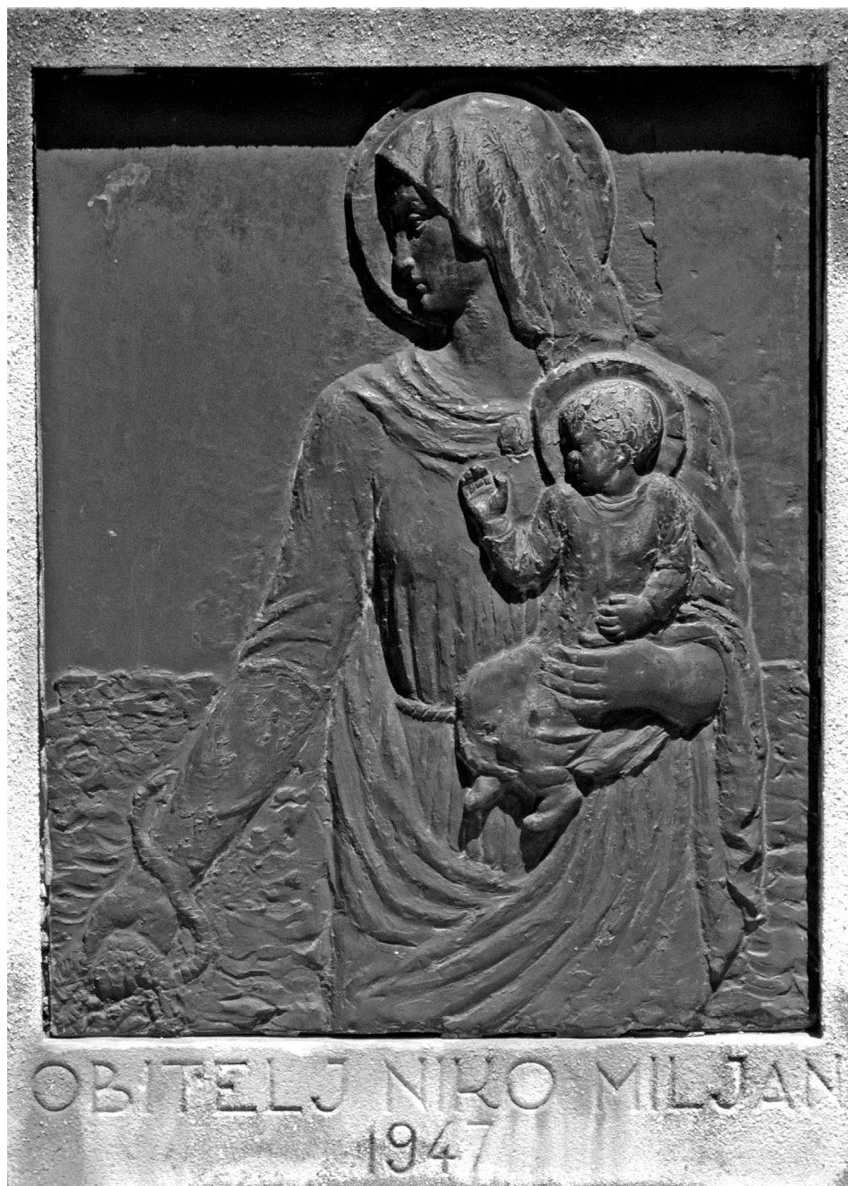
Slika 8. Nadgrobni spomenik obitelji Nika Miljana