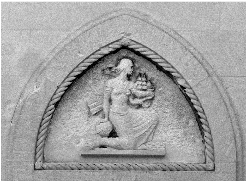
Slika 3. Sjeverna luneta Narodne banke, Pomorstvo

morem u zadnjem planu. Figura je okrenuta na lijevu stranu, s licem prikazanim u profilu, dok na drugu stranu vijori duga kosa. U lijevoj ruci, savijenoj u laktu, drži model jedrenjaka, a desnom rukom je naslonjena na globus. Figura je u poluklečećem položaju, desnim koljenom oslonjena na podlogu, a lijeve noge savijene u koljenu stopalom oslonjena na bazu. Figura je gola do pasa, a donji dio tijela i noge prekriveni su draperijom s geometriziranim naborima. Na statičnoj kompoziciji autor unosi pokret dugom kosom ženskog lika nošenom vjetrom i s tri lepezasta nabora u drugom planu, vidljiva iza figure. Brod u lijevoj ruci i globus atributi su alegorije pomorstva, nekadašnje ekonomske podloge dubrovačkog “zlatnog doba”. Alegoriju Pomorstvo Pallavicini izvodi i za Narodnu skupštinu u Beogradu sljedeće 1937. godine. Tada izvodi dvije monumentalne mramorne skulpture za interijer Skupštine, Zanatstvo i Pomorstvo . 23 Figura Pomorstvo posebno je zanimljiva za artibuciju reljefa Narodne banke, jer u lijevoj ruci drži model broda koncipiranog kao na