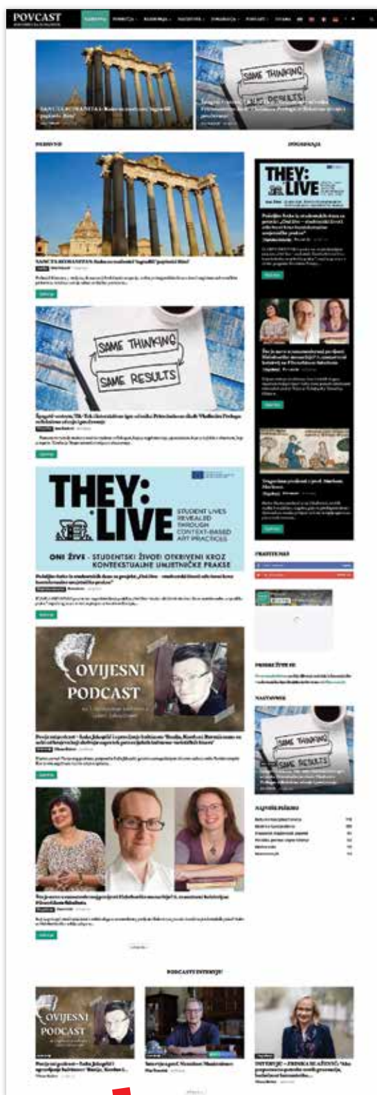
Naslovnica portala Povcast.hr

Pored tročlanoga uredništva, portal trenutno okuplja desetak aktivnih autora koji, zahvaljujući zajedničkoj aktivnosti, uspješno kreiraju novi sadržaj na tjednoj bazi, uz otvorenu mogućnost i želju daljnega širenja. Takva pojačana aktivnost dovela je i do rasta dosega objava, odnosno broja pratitelja Facebook stranice koji je početkom 2022. godine premašio pet tisuća. Osim usmjerenosti na čitateljsku publiku, jedna od uloga portala ujedno je i usavršavanje samih autora u kreiranju novih, kvalitetnih internetskih sadržaja, odnosno pronalaženja točke ravnoteže između popularizacije znanosti i zadržavanja potrebne razine stručnosti.