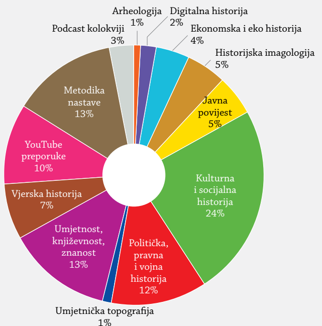
Grafikon 2. Tematska podjela svih objavljenih tekstova na portalu