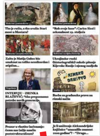
Primjer članaka objavljenih na portalu Povcast.hr

Stoga novo razdoblje djelovanja portala obilježava kombinacija nastojanja da se zadovolje izraženi interesi čitatelja, ali i da ih se zanimljivošću objavljujanih priloga privuče i nekim novim temama i područjima. S tom nadom u uspjeh, u posljednjih je mjesec dana revitalizirana i ideja koja je poslužila kao izvorni zamašnjak čitavoga projekta – snimanje podcasta. Naposlijetku, svi zainteresirani pozvani su da se pridruže portalu – bilo kao autori sadržaja bilo kao njegovi čitatelji, gledatelji ili slušatelji. Uvijek ste dobrodošli u Povcastu – svratištu za humaniste! ■