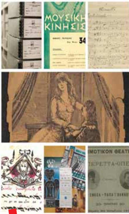
Glazbena knjižnica Lilian Voudori