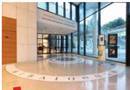
Koncertna dvorana Megaron, Atena

Mladi ljudi danas sve više koriste bežičnu tehnologiju za komunikaciju s vršnjacima i pronalaženje informacija. Tehnologija, koja je danas sastavni dio svakodnevice, neminovno utječe i na područje obrazovanja. Učenje je sada proces koji se odvija bilo gdje i bilo kada. Prelazak s knjiga na ekrane kao sredstvo učenja, stvarnost je koja je postala nužnost. Korištenje pametnih telefona, tableta ili prijenosnih računala u nastavi pokazalo se poticajnim za učenike i izazovom za obrazovne institucije koje obogaćuju iskustvo učenja uvođenjem inovativnih metoda i interaktivnih alata za učenje.