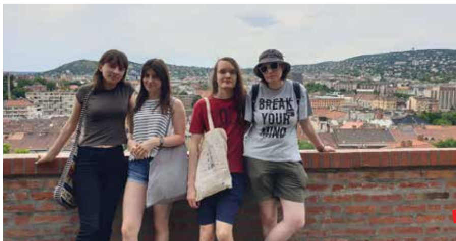
Polaznici ljetnog kampa u Budimpešti