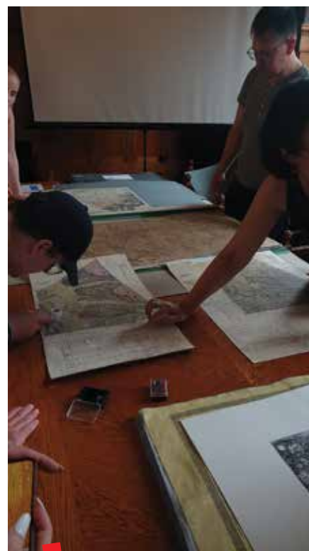
Polaznici ljetnog kampa u Budimpešti