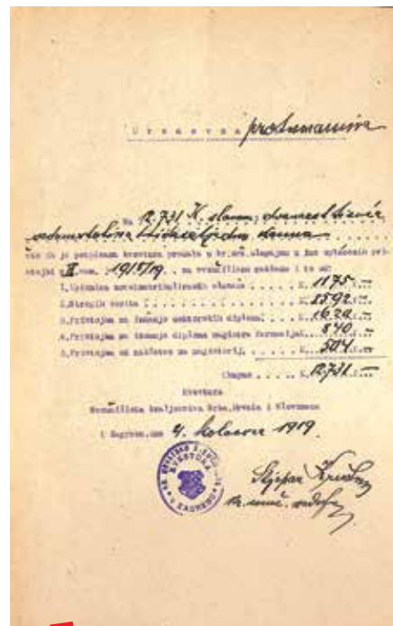
Potvrda kvesture iz 1919.