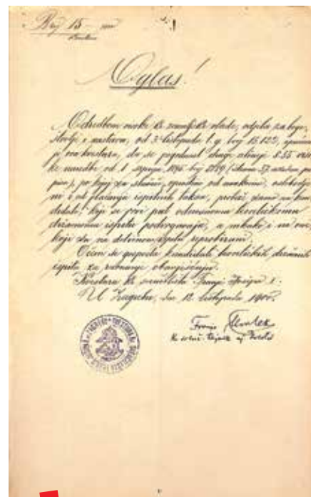
Oglas kvesture iz 1900.

Gradivo Kvestue Sveučilišta korisnicima je dostupno u digalnom formatu na sveučilišnoj platformi Vizbi. UNIZG: https://unizg.eindigo.net/?pr=i&id=31744