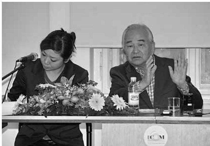
Svjedočenje hibakuše – gospodina Takashija Teramota, HŠM, 2013.

Hrvatski školski muzej organizira svoje programe i aktivnosti za sve uzraste, pa tako i za umirovljenike. U Fototeci su sačuvane fotografije s muzejske radionice quillinga održane u zgradi Hrvatskoga učiteljskog doma. Radionice su organizirane za polaznice Sveučilišta za treću životnu dob Pučkoga otvorenog učilišta u Zagrebu.