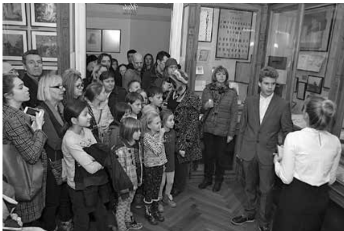
Noć muzeja 2018.