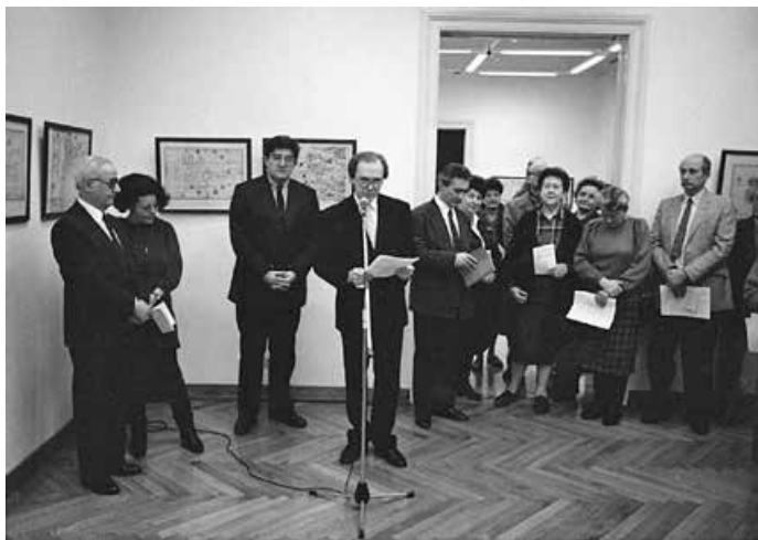
Portugalska kartografija: slike svijeta 15.-17. stoljeća – otvorenje izložbe, HŠM, 1990.