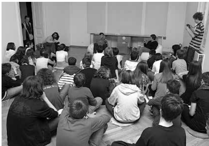
Što sam želio biti kad odrastem – Ivica Kostelić, HŠM, 2011.

su nastale brojne fotografije koje i dandanas čuvaju romsku kulturu, tradiciju i običaje. Hrvatski školski muzej organizirao je niz godina program „Što sam želio biti kad odrastem?“, u kojem su tijekom godina gostovale poznate ličnosti iz javnoga života. Brojne fotografije čuvaju uspomene s tih susreta i prepunoga Hrvatskoga školskog muzeja. Primjerice, 2011. godine o svojem životu, djetinjstvu, odrastanju i obrazovanju govorio je najpoznatiji hrvatski skijaš Ivica Kostelić.