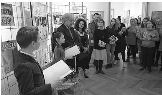
Lidrano 2020. – izložba školskih listova osnovnih i srednjih škola, HŠM, 2020.

Znalo je biti žustro u Hrvatskom školskom muzeju, ali samo na fotografijama. Razlog rasprave bila je debata na temu: Školske uniforme – da ili ne? U debati su sudjelovali učenici XI. gimnazije, a organizirali su je studenti Odsjeka za informacijske znanosti Filozofskoga fakulteta Sveučilišta u Zagrebu povodom projekta KRUZEJ: Kroz muzeje jednaki.