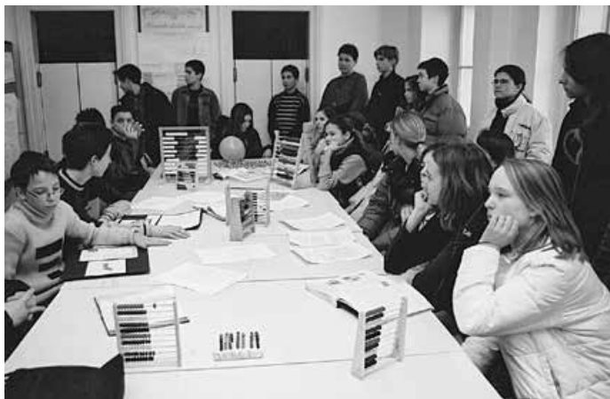
Radionica uz izložbu Računala u računstvu - OŠ „Izidor Kršnjavi”, HŠM, 2003.