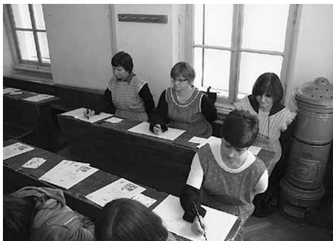
Djelatnici HŠM-a na muzejskoj radionici – Lepopis učna ura u Slovenskom šolskom muzeju, 2010.

Temu „Kotač” zajedničke odgojno-obrazovne akcije Sekcije za muzejsku pedagogiju Hrvatskoga muzejskog društva Hrvatski školski muzej realizirao je 2010. godine programom „Školski muzej na kotačima” u suradnji s Romskom zajednicom u Hrvatskoj. U suradnji s Udrugom Romi za Rome Hrvatske, Udrugom Roma grada Belog Manastira – Baranje te Osnovnom školom Podturen i Područnom školom Držimurec-Strelec održane su radionice Pišemo krasopisom te Biti učitelj/učiteljica , na kojima