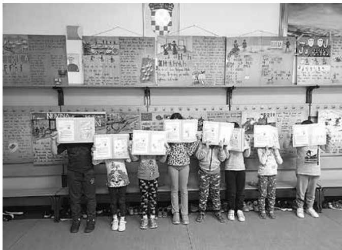
Zidna početnica učiteljice Vikice – izložba HŠM-a u Područnoj školi Prekrvršje