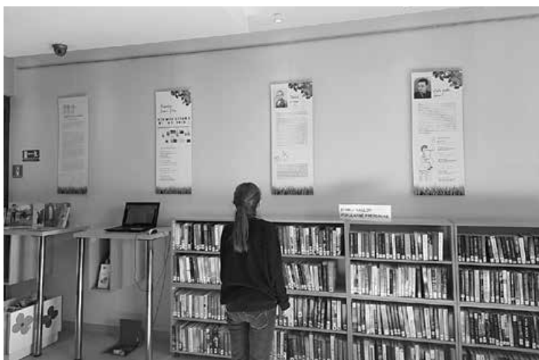
Kad bi drveće hodalo – izložba HŠM-a u Gradskoj knjižnici „Franjo Marković” u Križevcima

U suradnji s Osnovnom školom Grigora Viteza postavljena je pokretna izložba HŠM-a Kad bi drveće hodalo. Ostavština Grigora Viteza u Hrvatskom školskom muzeju u izložbenom prostoru kinodvorane u Svetom Ivanu Žabnu od 7. do 16. veljače, a istoimena izložba gostovala je od 17. veljače do 7. ožujka u Gradskoj knjižnici „Franjo Marković” u Križevcima.