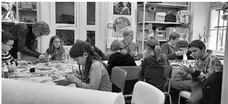
Adventska radionica Hlapićeva čizmica Hrvatskoga školskog muzeja u Muzeju grada Zagreba