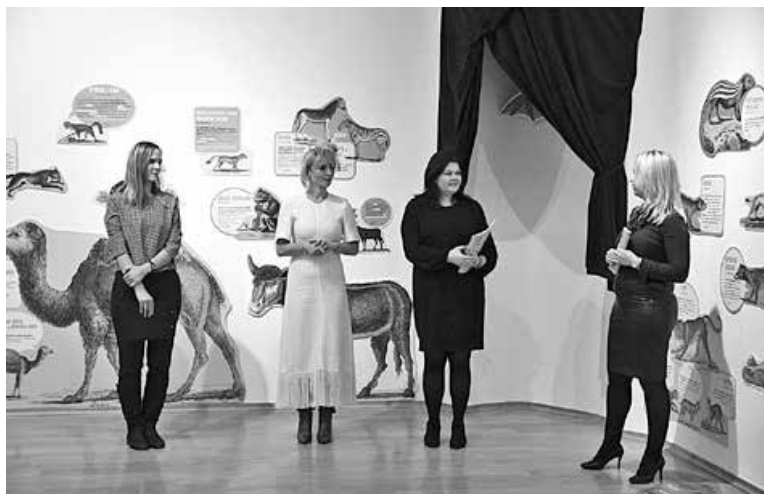
Bertuchovo slikovno carstvo - otkrij tajne dječje enciklopedije – otvorenje izložbe u Gradskom muzeju Virovitica

Posljednje gostovanje pokretnih izložbi Hrvatskoga školskog muzeja u 2022. godini bilo je u Gradskome muzeju Virovitica, gdje je otvorena izložba BERTUCHOVO