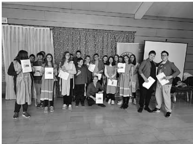
Ruksak pun kulture – radionica krasopisa HŠM-a u Topuskom

Svake godine od 16. do 22. rujna održava se Europski tjedan mobilnosti. Inicijativom se potiče male i velike gradove na uvođenje i promicanje održivih prijevoznih sredstava i pozivanje ljudi da iskušaju alternative vožnji automobilom. Tema Europskoga tjedna mobilnosti 2022. bila je „Bolja povezanost”, a Hrvatski školski muzej sudjelovao je u toj manifestaciji s prigodnom muzejskom radionicom Dođi i nauči školicu , koja je prezentirana javnosti u Masarykovoj ulici u Zagrebu.