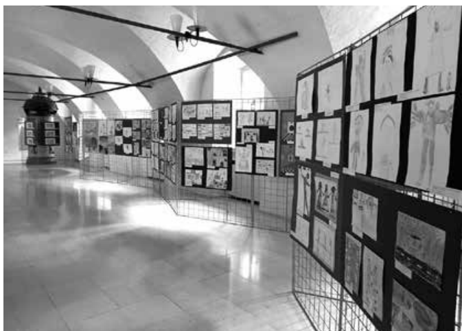
Školski muzej iz snova – fotografija s postavljanja izložbe HŠM-a u Muzeju grada Zagreba

Što je krasopis, gdje, kada, koliko se dugo koristio i čemu je služio posjetitelji su mogli doznati na pokretnoj izložbi Hrvatskoga školskog muzeja Krasopis – lijepo pismo u Osnovnoj školi Mirka Pereša u Kapeli od 25. veljače do 4. svibnja.