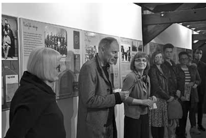
Gostovanje pokretnih izložbi HŠM-a Učiteljice i učitelji u Hrvatskoj 1849.-2009. i Školski dokumenti Arhivske zbirke u Gradskom muzeju Nova Gradiška