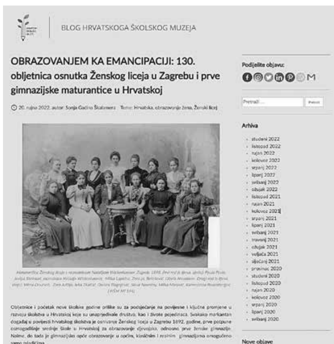
Blog Hrvatskoga školskog muzeja