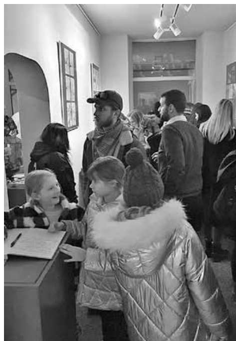
Noć muzeja 2023. u galeriji „Školica za 5” Izložba Moje dječje dragocjenosti

što krije spomenar Cvijete Modec, kada i gdje je osnovana prva ženska gimnazija, tko je bio Alfred Lichtwark i po čemu je poznat, samo su neke od zanimljivosti iznesenih na BLOG-u.