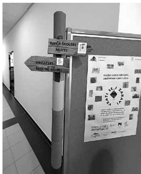
Izložba Hrvatskog školskog muzeja Biseri Školskog muzeja u PŠ Pongračevo (OŠ August Šenoa)