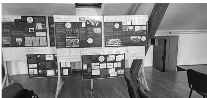
Krasopis – lijepo pismo – postavljanje pokretne izložbe HŠM-a u Gimnaziji Matije Antuna Reljkovića u Vinkovcima