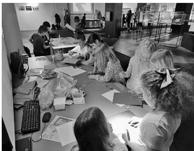
Radovi sa zajedničke radionice Hrvatskoga školskog muzeja i Centra za autizam