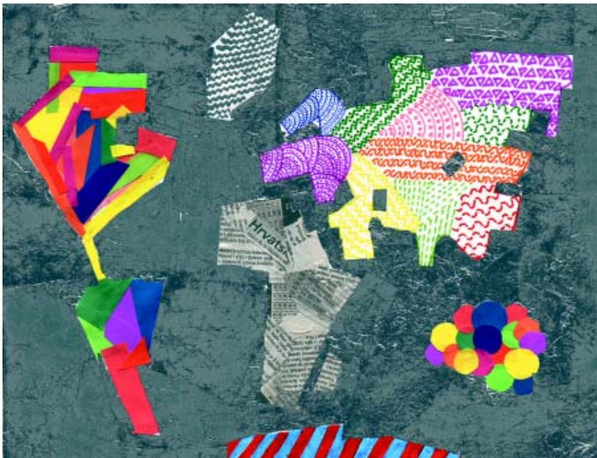
Apstraktna karta, Ana Bilić (14 god.) Abstract Map, Ana Bilić (age14)