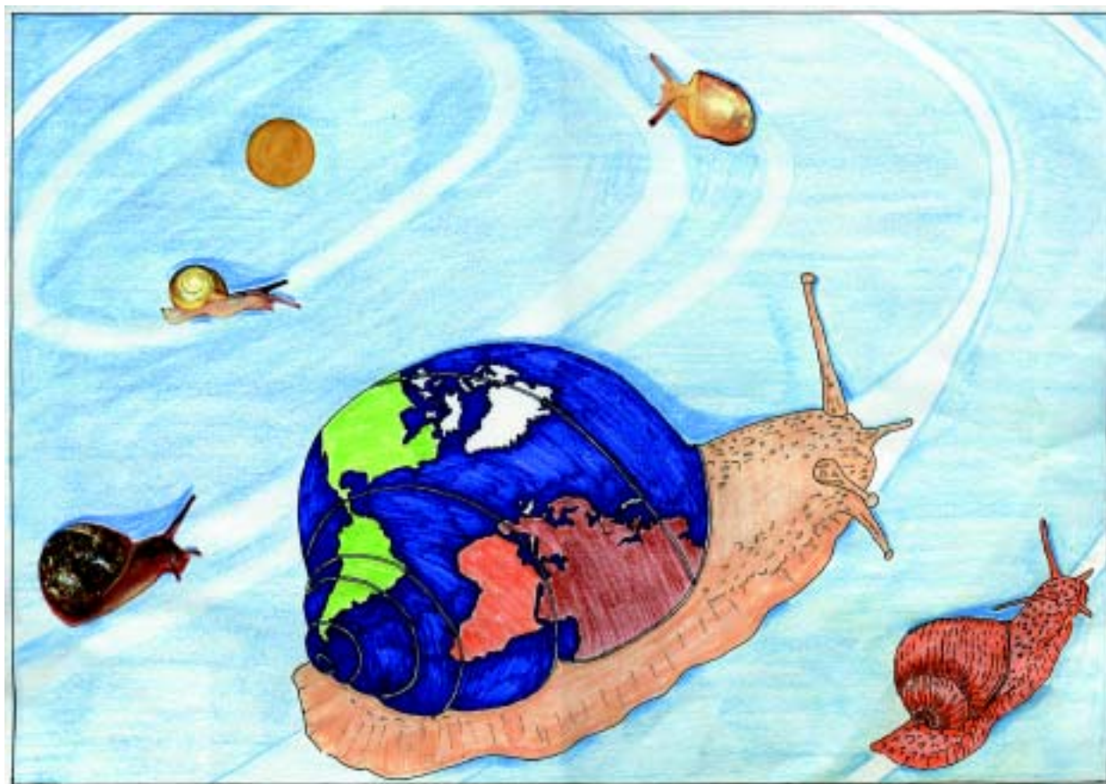
Puž – planet, Lazar Cvjetković (13 god.) Snail – Planet, Lazar Cvjetković (age 13)