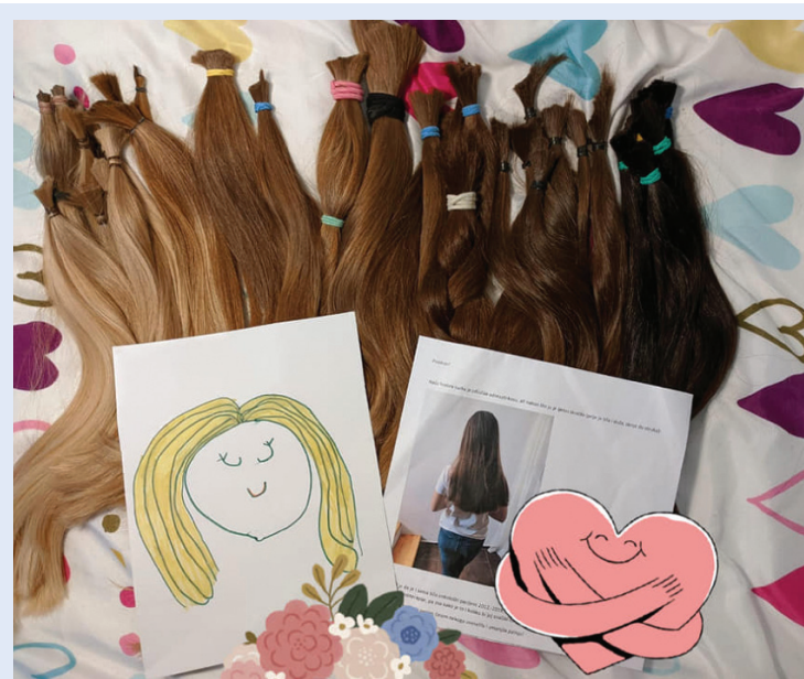
Slika 4. Donacije kose za izradu vlasulja, projekt KosaRi

KosaRi je projekt koji se provodi od proljeća 2018. godine u sklopu Medicinskog fakulteta u Rijeci. Prve dvije godine proveden je pod okriljem Fakultetskog odbora svih studenata medicine (FOSS), a od 2020. godine provodi se pod udrugom CroMSIC. U okviru projekta KosaRi organizirana je humanitarna akcija darivanja kose nazvana Dare to share kojom se prikuplja kosa za izradu vlasulja djeci oboljeloj od malignih i autoimunih bolesti (Slika 4). Prilikom suočavanja s bolesti, većina ne pridaje velik značaj gubitku kose, iako je to oboljelima, posebice djeci, velik gubitak i u njihovim očima to ne predstavlja samo estetski problem. Projekt, osim izrade vlasulja, obuhvaća različite formate te volonteri imaju priliku sudjelovati u ovom projektu kroz radionice, predavanja, humanitarna događanja, pub kvizove i filmske večeri (Slika 5). Važan segment ovog projekta su i edukativne radionice koje se provode u osnovnim školama. Kroz tri različita segmenta provodi se destigmatizacija te djeca imaju priliku razumjeti jednakost i prava svih ljudi u zajednici, kao i razvijati pozitivne stavove o osobnim i tuđim pravima i dužnostima. Kroz igru i zabavne zadatke, među učenicima se promovira tolerancija i empatija. Cilj je radionica pružiti djeci priliku da analiziraju svoje osjećaje i razmišljanja te da lakše prihvate razlike u društvu, kao i educirati ih o adekvatnim obrascima ponašanja.