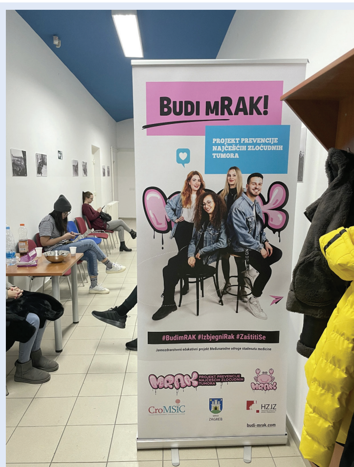
Slika 10. Cijepni punkt, projekt Mrak

Inicijativa Be Someone's Santa predstavlja humanitarnu akciju koja se održava svake godine u predblagdanskome razdoblju. Ovaj projekt čine svi studenti volonteri koji su spremni od svog skromnog studentskog budžeta odvojiti ponešto za kupnju božićnih darova za siročad i djecu koja dolaze iz obitelji nižeg socioekonomskog statusa. U suradnji s Dječjim domom Ivana Brlić-Mažuranić sastavljamo popise želja djece, čije stavke studenti podijeljeni u timove kupuju. Svaki tim sastavlja i pismo s ciljem uljepšavanja blagdana mališanima (Slika 11). Ovakve su humanitarne akcije od neizmjerne važnosti, posebice za studente medicine čija je profesija neraskidivo povezana sa suosjećanjem i pružanjem pomoći drugima.