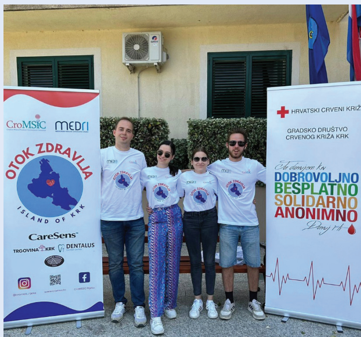
Slika 9. Provođenje mjerenja, projekt Otok zdravlja