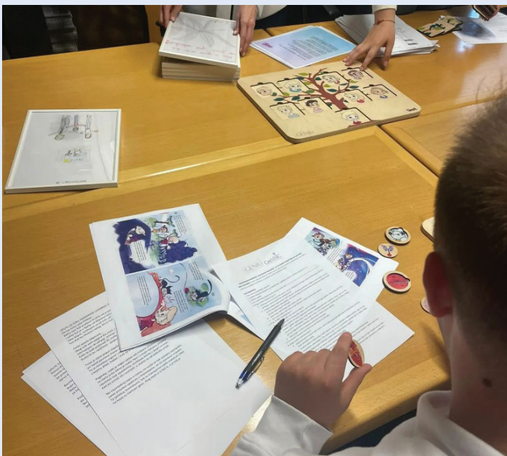
Slika 12. Edukacija djece, projekt Slagalica nasljeđa

Projekt Slagalica nasljeđa inovativna je inicijativa koju je pokrenuo CroMSIC u suradnji s Centrom za genetičku edukaciju (GenRi) na Medicinskom fakultetu u Rijeci. Glavni cilj ovog projekta jest