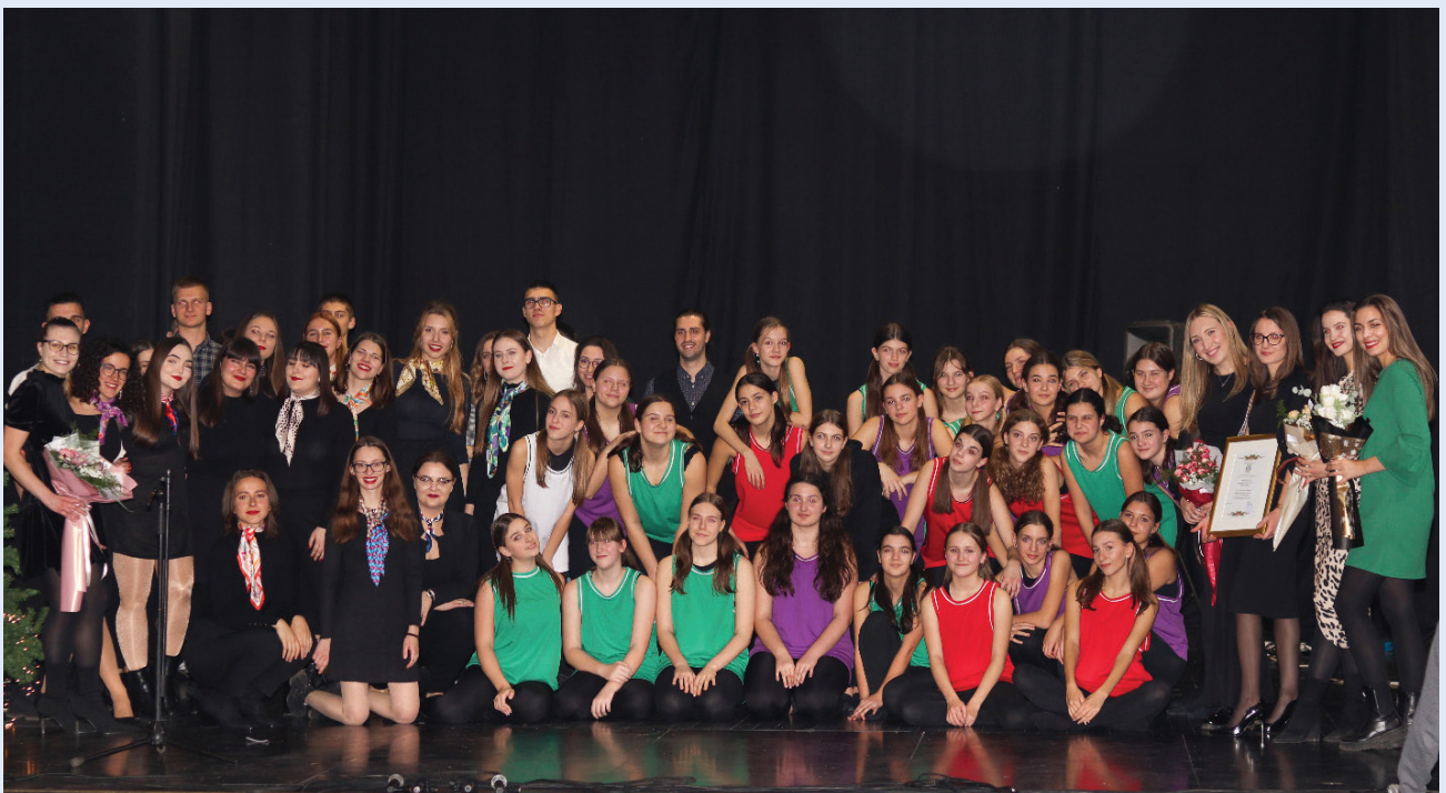
Slika 17. Humanitarni koncert studenata medicine

Adria Train je službeni međunarodni susret IFM-SA koji okuplja studente iz regije i šire, pružajući im mogućnost sudjelovanja u treninzima, radionicama i manjim radnim grupama 2 . Projekt predstavlja temelj za jačanje kapaciteta Federacije s ciljem unaprjeđenja lokalnog djelovanja i dobrobiti zajednica u kojima udruge djeluju. Kao članovi CroMSIC-a, imali smo priliku sudjelovati na