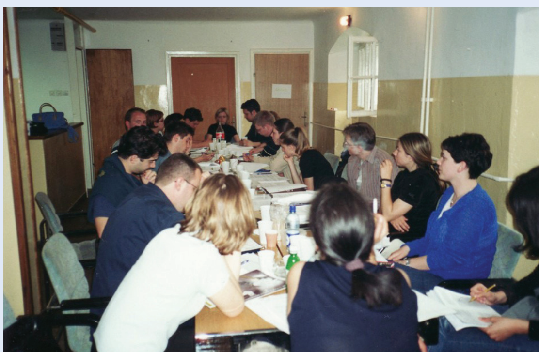
Slika 2. Članovi udruge na Nacionalnoj skupštini, akademska godina 1994./1995.