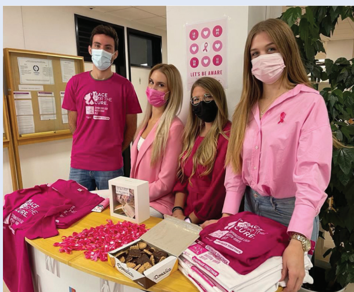
Slika 16. Dan žena

CroMSIC se ističe svojim svestranim angažmanom u brojnim relevantnim područjima. Ciljevi i misije jasno odražavaju posvećenost javnom zdravstvu, spolnom i reproduktivnom zdravlju, ljudskim pravima te medicinskoj edukaciji. Posebno smo ponosni na činjenicu da udruga pruža studentima mogućnost sudjelovanja u međunarodnim razmjenama. Osim toga, projekti su usmjereni na edukaciju kolega studenata, ali i srednjoškolaca kroz peer-to-peer metode koje su se pokazale iznimno učinkovitima. Cilj je ne samo proširiti znanje unutar medicinske zajednice već i osvijestiti opću populaciju o važnim zdravstvenim temama.