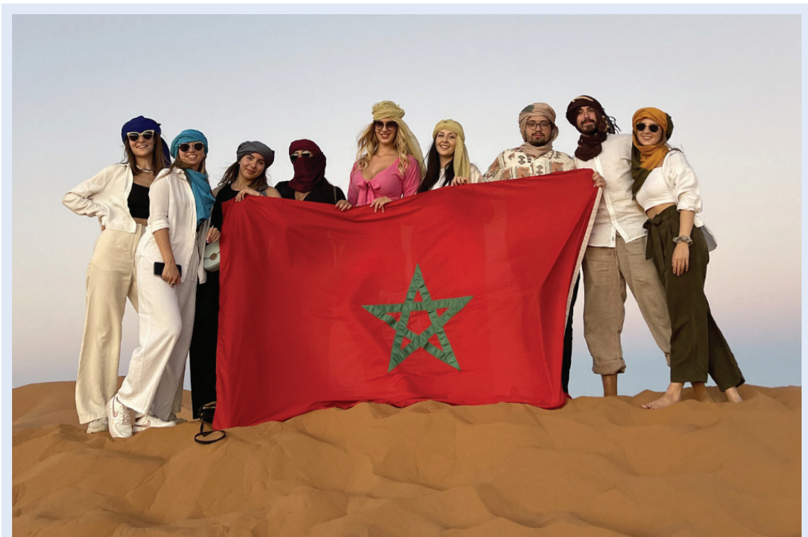
Slika 19. Studenti iz Hrvatske na razmjeni u Maroku

dijagnostika, povezanost pankreatitisa i blagdana. Ono što ističe veličinu projekta jest i činjenica da je međunarodno priznat od IFMSA ( International Federation of Medical Students Associations ) tako da studenti u svim dijelovima svijeta mogu pokrenuti sličan javnozdravstveni journal klub prema našim detaljnim opisima projekta 2 .