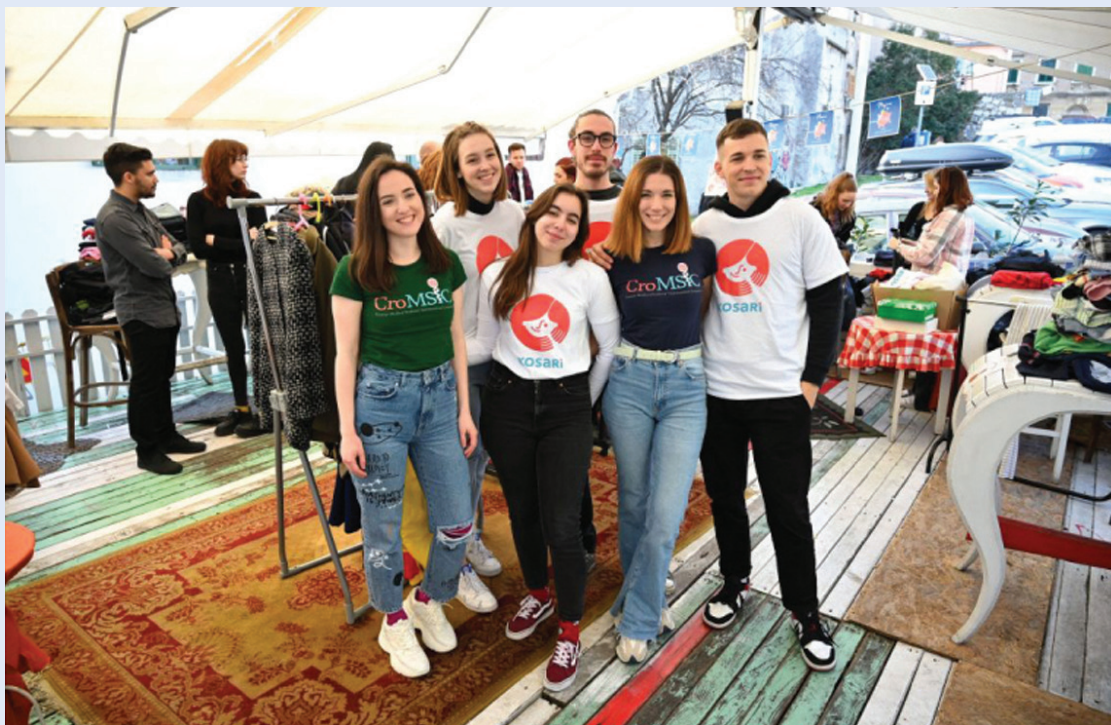
Slika 14. Buvljak, projekt Ormar ljubavi 2022. godina