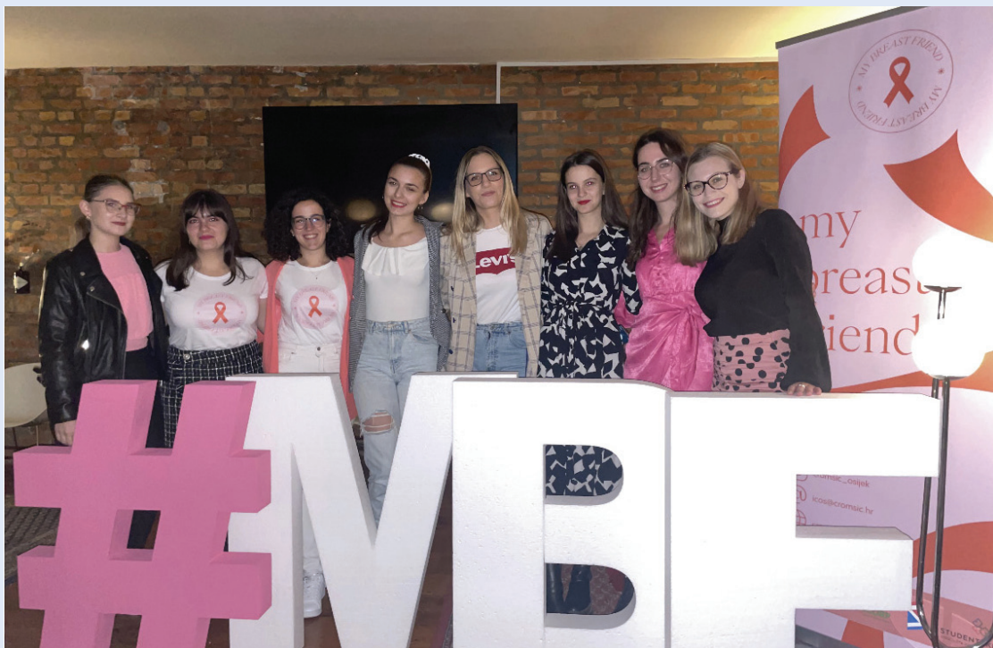
Slika 7. Interaktivni panel, projekt My BrEaSt Friend

uključujući i studentice. Cilj je svakom oboljelom pojedincu i njegovoj obitelji pružiti podršku, savjete i informacije o tome kako se suočiti s procesom liječenja te pozitivno utjecati na suočavanje s bolešću.