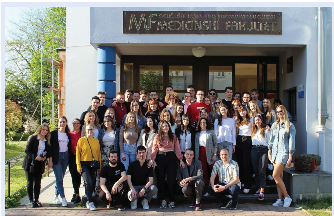
Slika 1. Članovi udruge na Nacionalnoj skupštini, akademska godina 2022./2023.

punopravni član Međunarodne federacije udruga studenata medicine (IFMSA) koja okuplja preko milijun članova diljem svijeta, CroMSIC se ističe svojom predanošću medicinskoj zajednici. Udruga aktivno djeluje na svim četirima medicinskim fakultetima u Hrvatskoj (Osijek, Rijeka, Split i Zagreb) 1,2 . Svaki grad ima svoju podružnicu, okupljajući tako više od 90 studenata medicine koji aktivno sudjeluju u organizaciji projekata u ulogama nacionalnih i lokalnih dužnosnika te asistenata (Slika 1). S ponosom možemo istaknuti da je u CroMSIC aplikaciji, koju su studenti sami osmislili i pokrenuli, službeno registrirano više od tisuću angažiranih studenata medicine koji sudjeluju u našim aktivnostima kao predani volonteri ili suradnici u organizaciji raznovrsnih događanja i projekata. Ova široka mreža studenata svakodnevno pridonosi misiji unaprjeđenja medicinske edukacije i promicanju volonterskog rada u medicinskoj zajednici, ali i izvan nje. Mnoge edukacije i projekti usmjereni su široj javnosti, a posebno se zalaže za peer-to-peer edukaciju te surađuje s brojnim srednjim školama diljem zemlje. Djelovanje CroMSIC-a proteže se od područja medicinske edukacije preko javnog zdravstva i seksualnog zdravlja do borbe za ljudska prava, a uz sve to or-