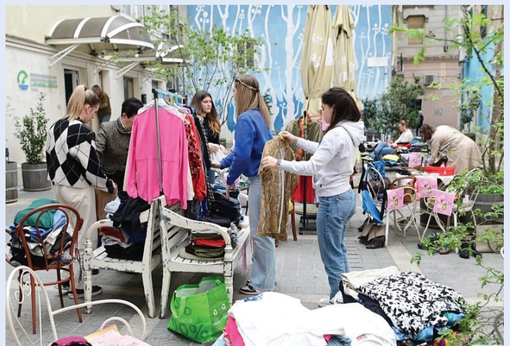
Slika 15. Buvljak, projekt Ormar ljubavi 2023. godina

Projekt Pogled u Sebe predstavlja javnozdravstveno-edukativni program s ciljem podizanja svijesti o važnosti mentalnog zdravlja među mladima. Projektni je fokus na destigmatizaciji i poticanju brige za vlastito mentalno zdravlje. Ovaj se projekt provodi u suradnji s educiranim studentima volonterima koji provode osam tematski povezanih radionica u trećim razredima srednjih škola. Kroz ove radionice učenici stječu važne vještine za jačanje vlastitog mentalnog zdravlja te razvijaju pozitivnu sliku o sebi. Svjesni smo izazova s kojima se mladi suočavaju tijekom adolescencije i svakodnevnog života. Stoga, smatramo da je od iznimne važnosti osnažiti srednjoškolce i naučiti ih kako učinkovito upravljati svakodnevnim izazovima. Prošle godine radionice su provedene u svim četirima podružnicama te su dosegnule u više od 140 škola. Ove je godine projekt Pogled u Sebe educirao više od 250 novih edukatora u svim četirima podružnicama. Imajući na umu da je multidisciplinarni pristup ključan za brigu o mentalnom zdravlju, proširili smo projekt i na studente drugih struka koji također mogu postati edukatori i provoditi cikluse radionica. Do kraja školske godine, edukatori u svim gradovima zajedno su održali 873 radionice, kori-