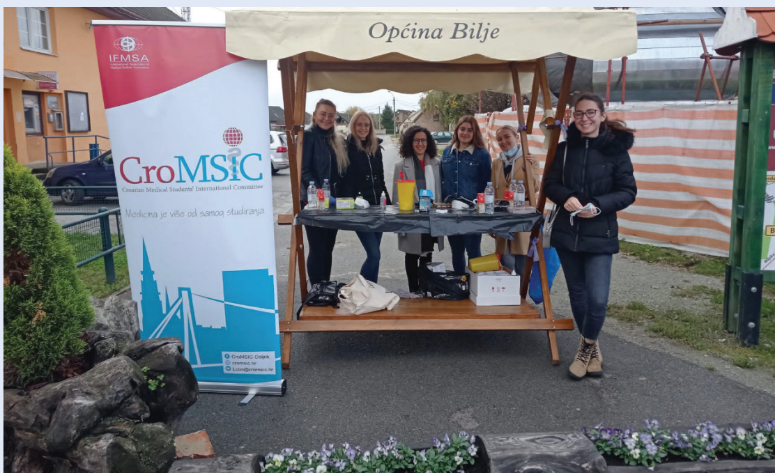
Slika 8. Volonter i dužnosnici u provođenju akcije, projekt Ruralno zdravlje

Inicijativa Ruralno zdravlje kontinuirano se provodi dugo godina u manje naseljenim područjima Osječko-baranjske županije. Glavna je svrha ove akcije unaprjeđenje kvalitete života ruralnog sta-