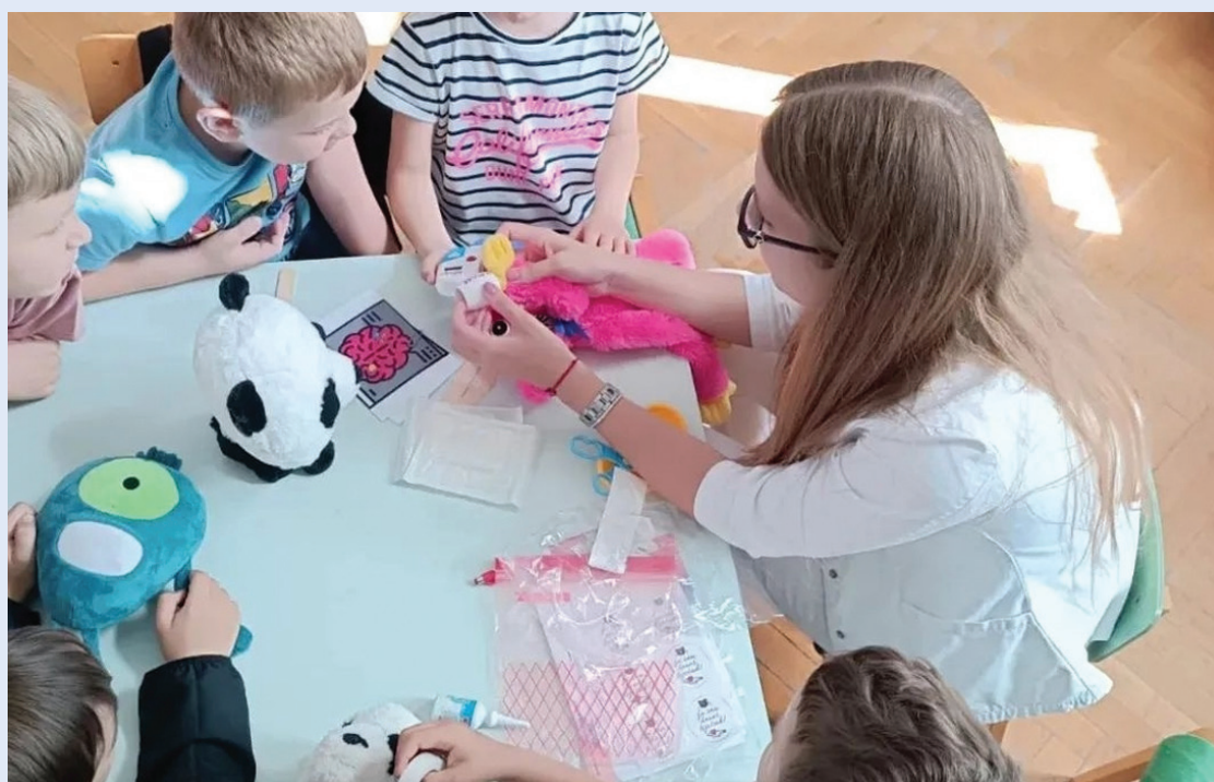
Slika 18. Projekt Medvjedići hrabra srca

brojnim međunarodnim događajima i edukacijama te smo prepoznali važnost vršnjačke edukacije. Ovim smo projektom približili vršnjačku edukaciju našim i stranim studentima te im omogućili sudjelovanje u dvjema različitim radionicama kako bi stekli potrebna znanja i vještine, ali i razmijenili iskustva s kolegama iz cijelog svijeta potičući tako studentski aktivizam.