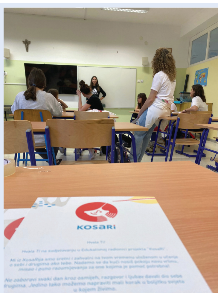
Slika 5. Interaktivne radionice, projekt KosaRi