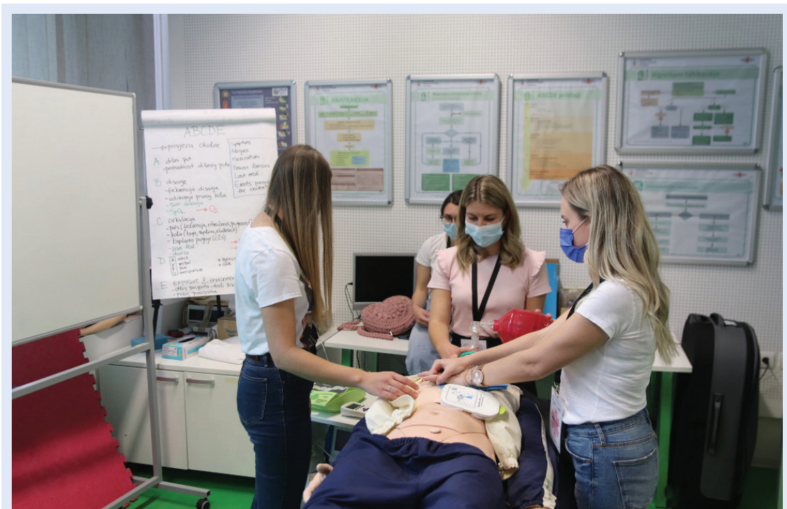
Slika 6. Vježbe praktičnih vještina, projekt Natjecanje u kliničkim vještinama