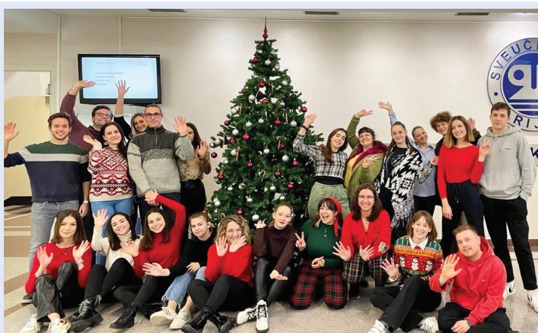
Slika 11. Darivanje djece, projekt Be Someones Santa