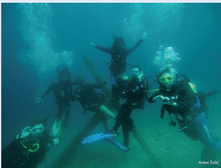
Slika 3. Zaron studenata

Projekt Diving Medicine Summer School , tj. Ljetna škola medicine ronjenja održava se već šest godina zaredom, a duga tradicija projekta potječe još iz 1993. godine. Iako nije održan u kontinuitetu, projekt je ponovno oživljen 2018. godine, ovoga puta organizacija projekta bila je na višoj razini. Zahvalni smo na suradnji s KBC-om Rijeka i Zavodom za podvodnu i hiperbaričnu medicinu s potporom Jadran – galenskog laboratorija (JGL) te na suradnji s doc. dr. sc. Igorom Barkovićem, stručnim voditeljem projekta. Projekt je osmišljen u obliku tečaja ronjenja od pet zarana, nakon čega studenti budu nagrađeni certifikatom Open Water Diver kojim im je omogućeno ronjenje do 18 metara dubine (Slika 3). Osim praktičnog dijela, razvijen je i teorijski dio projekta u vidu predavanja s temama medicine ronjenja. Predavanja organizira Centar za istraživanje i edukaciju u podmorskoj, hiperbaričnoj i podvodnoj medicini. Tijekom godina uvedene su i nove aktivnosti, poput tečaja spašavanja ronilaca te na-