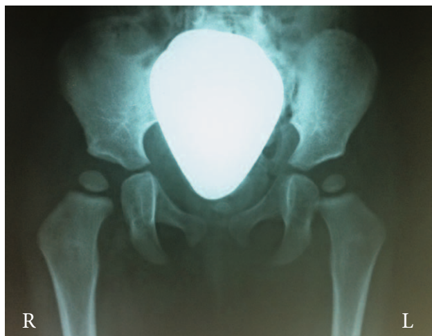
SLIKA 1. NORMALNI ANTEROPOSTERIORNI RENDGENOGRAM OBAJU KUKOVA FIGURE 1. NORMAL ANTEROPOSTERIOR ROENTGENOGRAM OF BOTH HIP