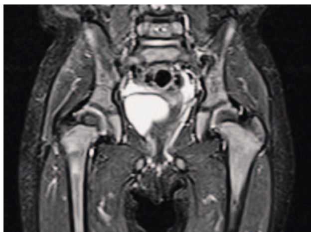
SLIKA 3. MR OBAJU KUKOVA FIGURE 3. MRI OF BOTH HIP