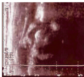
SLIKA 5. SONOGRAM DESNOG KUKA – REPOZICIJA FIGURE 5. SONOGRAM OF THE RIGHT HIP – REPOSITION

Javlja se liječniku koji nakon kliničkog pregleda i učinjene UZV snimke kukova ustanovi uredan nalaz. Simptomi iskakanja desnog kuka i dalje perzistiraju te se dijete s 14,5 mjeseci upućuje u ortopedsku ambulantu. Kliničkim pregledom utvrđi se normalno razvijeno dijete, urednog hoda za dob, bez šepanja i bolova. Pokretljivost kukova bila je uredna, osim povećane nutarnje rotacije u odnosu na vanjsku rotaciju. U položaju maksimalne adukcije, fleksije i nutarnje rotacije izazove se luksacijsko-repozicijski fenomen. Dijete se primi na bolničku obradu. Učine se radiološke (RTG) snimke zdjelice s kukovima (slika 1), kompjutorizirane tomografije (CT) (slika 2) i magnetske rezonancije (MR) (slika 3) kukova koje ne pokazuju patoloških promjena na acetabulumu i proksimalnom dijelu femura. Ultrazvučnim pregledom dijagnosticira se luksacija s prikazanim vakuum fenomenom (slika 4) i repozicija desnog kuka (slika 5).