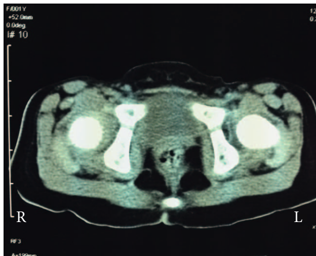
SLIKA 2. AKSIJALNI CT OBAJU KUKOVA FIGURE 2. AXIAL CT OF BOTH HIP