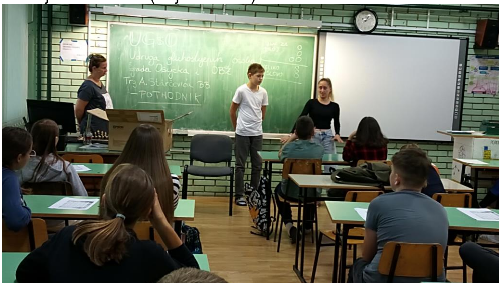
Slika 1. Provedba vježbe kako pristupiti gluhoslijepoj osobi i pomoći joj da sjedne

Povodom boravka predstavnika udruge za učenike je pripremljeno predavanje, zatim radionica i za kraj učenje komunikacije znakovnog jezika. Tijekom predavanja učenici su upoznati kako pristupiti osobi koja ne vidi, na koji način ju primiti za ruku kako bi se osoba osjećala sigurno. Prezentirano je kako osobi pomoći da sjedne i ustane (vidjeti sliku 1.).