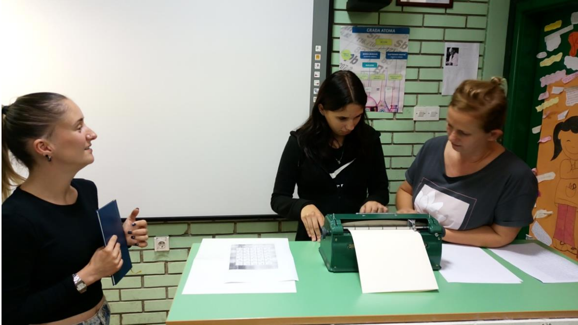
Slika 2. Pisanje na stroju

Iz udruge su donijeli pisaci stroj s Brailleovim pismom. Za stroj je potreban poseban papir. Sam proces pisanja nije jednostavan i brz. Učenici su isprobali ispisati svoje ime. Naglasak je na pravilnom držanju prstiju i pritisku na tipke stroja kako bi se pravilno na papir utisnulo slovo (slika 2.).