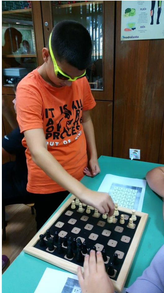
Slika 6. Tijekom igre šaha

Primijetili smo da su učenici bili smireniji, koncentriraniji i razina strpljenja bila ih je puno veća od uobičajene. Kada bi stavili naočale i slušalice, a igrali neku društvenu igru uočili smo da djeca jako koriste osjet dodira, ali i promišljanju. Nije bilo trenutka da djeca gube strpljenje ili u slučaju da ne pobjeđuju da odustaju ili ne žele više igrati jer „nešto nije uredu“. Sada su se još više trudili, bili su smireni, promišljali su i pokazali veći stupanj tolerancije prema suigračima.