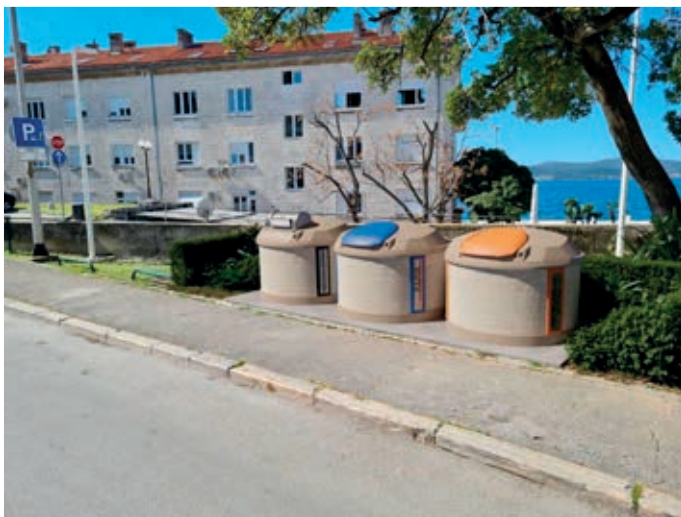
Slika 4. Polupodzemni spremnici u kulturno-povijesnoj jezgri Zadra [7]