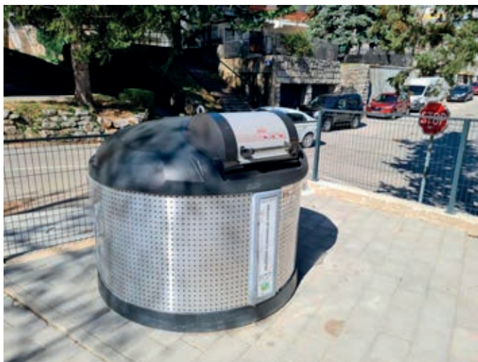
Slika 5. Otpadomjer postavljen na polupodzemni spremnik u Kninu [7]