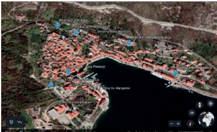
Slika 2. Prikaz lokacija polupodzemnih spremnika u Bakru [7]

Za postavljanje polupodzemnih ili podzemnih spremnika potrebno je, u skladu s Pravilnikom o jednostavnim i drugim građevinama i radovima [8], izraditi glavni projekt za koji treba pribaviti potrebne posebne uvjete, primjerice, konzervatorske uvjete ukoliko se radi o postavi spremnika u