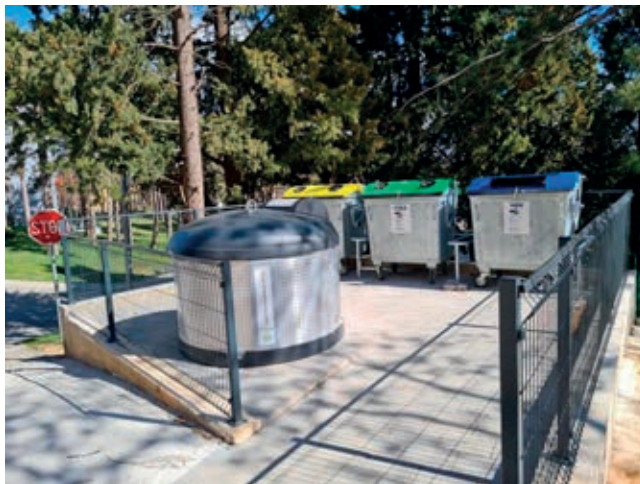
Slika 3. Uređena lokacija s polupodzemnim spremnikom od 5.000 litara za miješani komunalni otpad u Kninu [7]