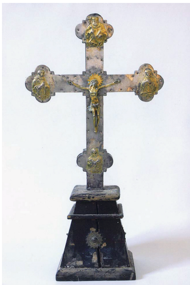
Slika 8. Nepoznati dubrovački umjetnik, XVIII. st., oltarno raspelo, Gospa Velika u Dubrovniku

ovom oltaru čuva se i srebrno raspelo iz XVIII. stoljeća koje potječe iz Sv. Marije od Kaštela. 54