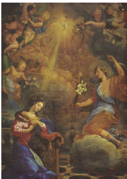
Slika 6. Nepoznati umjetnik, XVIII. st., oltarna pala s prikazom Navještenja/Gospo Luncijate, Gospa Velika u Dubrovniku

oštroumni majstor razvio svu svoju snagu svijetlo-tamnoga, u čemu je imao osobita uspjeha. Nestrpljivost Bogu posvećenih djevica tog samostana i autoritet jedne njegove tetke koja je bila među njima, dovela je do toga da moramo žaliti zbog nesavršenosti u jednom uratku punom umijeća. No iz onoga što imamo pred očima pokazuje se dosta jasno da bi svojim talentom, iz kojega su kao izdašne žile tekle one blage misli i lijepi oblici što ih slikarstvo traži, da ga smrt nije prerano ugrabila, ilirskom imenu pridodao umjetničku slavu; slavu koja više od svake druge odlikuje sretne krajeve Grčke i Italije, a koju bi Ilirija samo njome bila mogla steći." 47