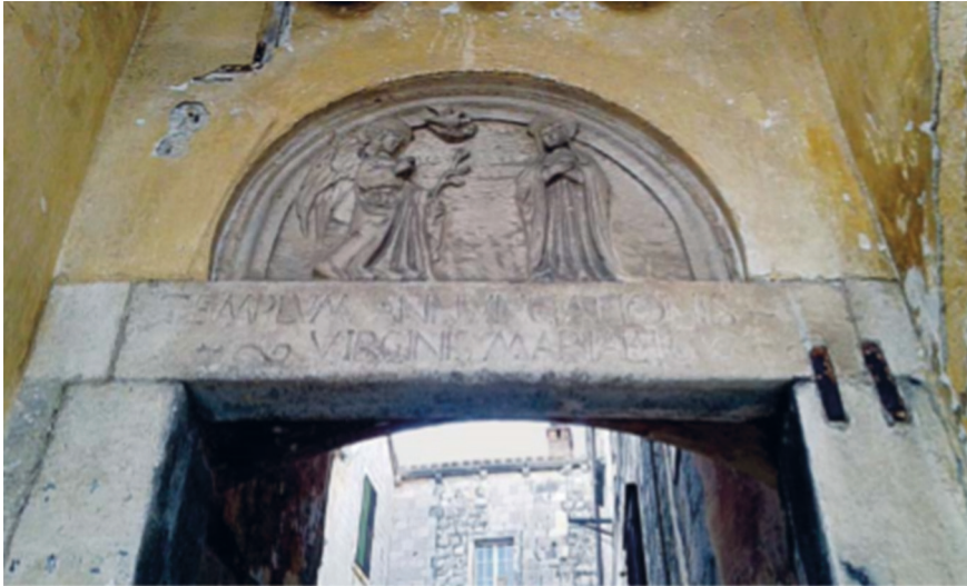
Slika 1. Luneta portala na ulazu u samostanski kompleks sv. Marije od Kaštela

tala, koja drži knjigu, nastao u istoj radionici braće Petrovića (sv. Katarina Aleksandrijska?), kao da je prvotno bio namijenjen oltaru u crkvi. Unutar dvorišta samostanskoga kompleksa nalazi se prostrana crkva sv. Marije s kapitularnom dvoranom. 3 U ulazu u prostorije Područnoga centra Dubrovnik sačuvane su jedrима svodova freske iz XVI. stoljeća s prikazom sv. Lovrijenca i svetice koja u ruci nosi palmu mučeništva, te jednoga proroka. Freske su zasigurno pripadale većem likovnom ansamblu, jer je nekadašnju kapitularnu dvoranu samostana dijelom presjekao hodnik stambene jedinice. 4 Djelo su po svemu sudeći domaćih slikara, i podsjećaju na sloj fresaka u apsidi iz crkve Gospe od Lužina u Stonu. Kapitularna dvorana po svemu sudeći povezivala je crkvu sv. Srđa i Bakha. Ova crkva, čija je fasada ostala sačuvana i prislonjena uz monumentalnu crkvu sv. Marije, njeguje vrlo stari kult ratničkih svetaca iz kasnoantičkoga razdoblja. Kult tih svetaca ratnika bio je raširen tijekom justinijanske rekonkviste, a po svemu sudeći izvanredan