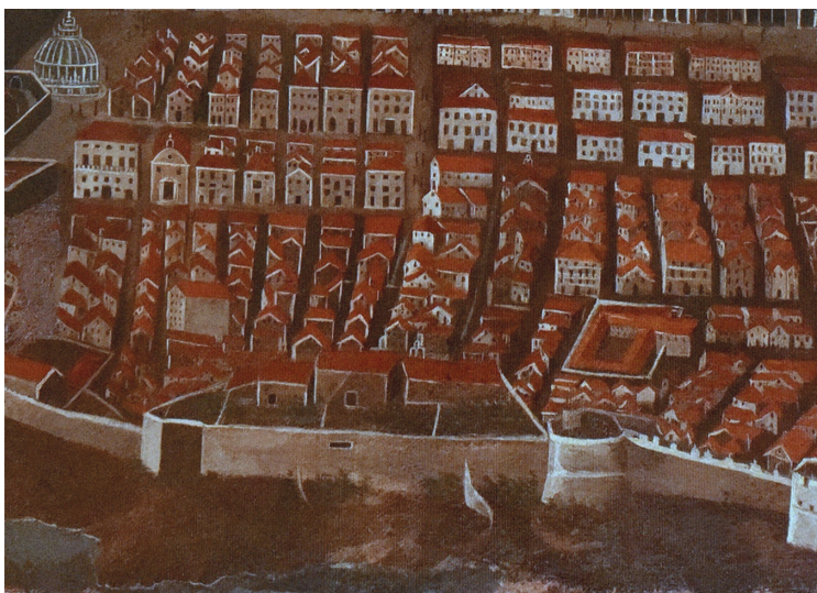
Slika 3. Nepoznati slikar, XVII. st., detalj slike s prikazom Dubrovnika prije trešnje 1667.