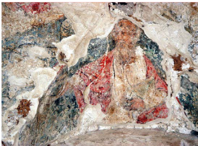
Slika 2. Nepoznati slikar, XVI. st., Prikaz nepoznatog proroka s knjigom u ruci (preuzeto iz: Hrvatski restauratorski zavod, Zidno slikarstvo grada Dubrovnika, pregledni katalog , Dubrovnik, 2016.)

strateški položaj sv. Marije od Kaštela svjedoči kako je na ovome mjestu mogla postojati nekakva kasnoantička fortifikacija. U nedalekom Stonu postoje ruševine crkve posvećene ovim svecima, a u Pridvorju, u Konavlima, i danas im je posvećena crkvena župa. U gradu Korčuli do XIX. stoljeća postojala je crkva koje je nadarbinom upravljala plemićka obitelji Kanavelić. 5