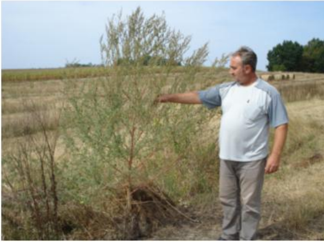
Ambrozija narasla u nasadu lješnjaka 2009. godine na području grada Grubišno Polje

Na našem zemljištu raste velik broj raznovrsnih biljaka među kojima su naravno i one koje izazivaju alergije. Teško je nadzirati njihov rast i razvoj, te njihov broj. Ustanovljeno je da se Ambrozija (Ambrosia artemisiifolia) pojavljuje i na obrađenom i neobrađenom zemljištu, da raste na poljoprivrednom i građevinskom zemljištu, na privatnim parcelama i javnim površinama. Ukratko – opasan neprijatelj.