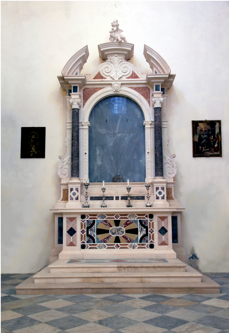
Slika 8. Oltar sv. Križa radionice Bilinić u prčanjskoj župnoj crkvi, 1925.