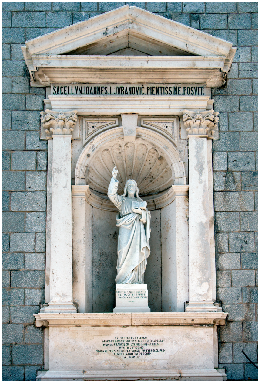
Slika 2. Niša prčanjске skalinađe s kipom Isusa kao učitelja, 1913.