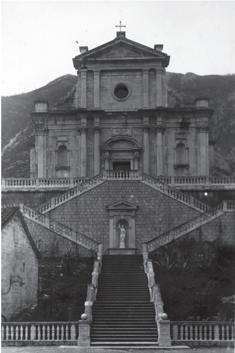
Slika 1. Pogled na župnu crkvu u Prčanju sa skalinadom, oko 1925., Zbirka Brguljan (foto neutvrđen)