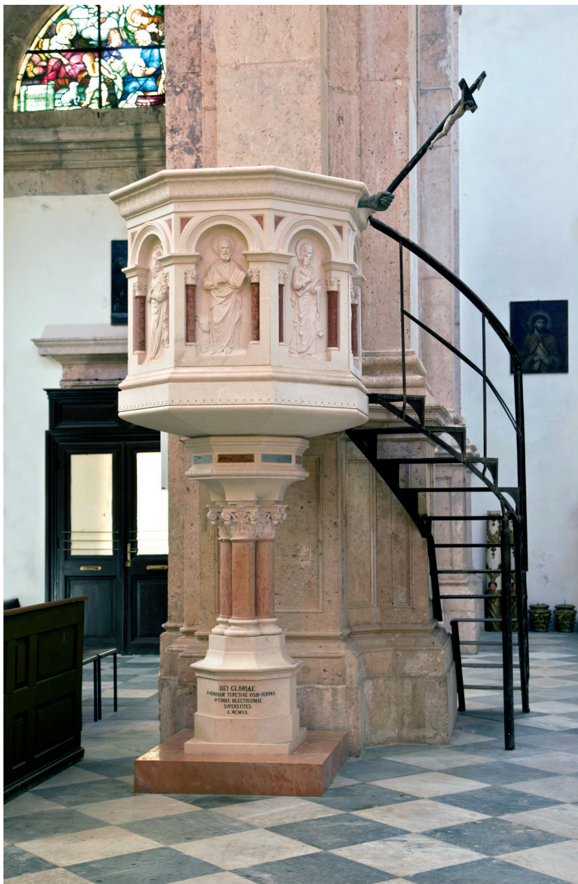
Slika 5. Propovjedaonica radionice Bilinić u prčanjskoj crkvi, 1920