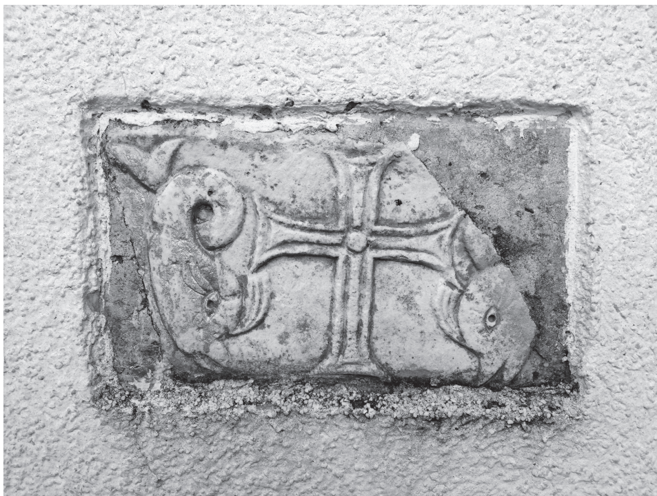
Slika 7. Kasnoantički ulomak ugrađen na istočnom zidu apside