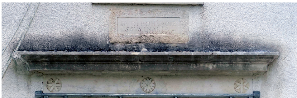
Slika 8. Ornamenti nadvratnika i posvetna ploča ugrađena nad portalom