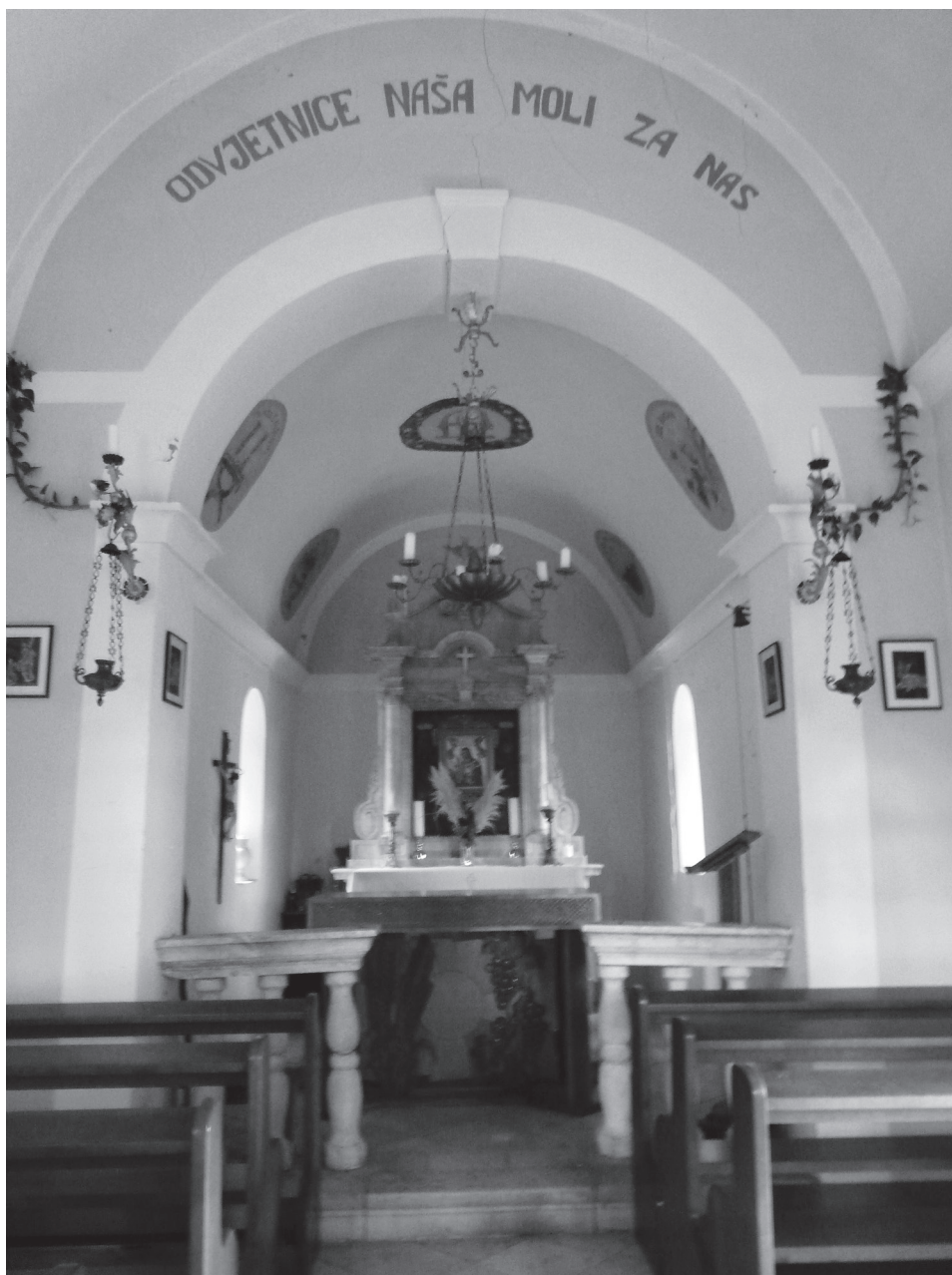
Slika 10. Interijer crkve, pogled prema apsidi