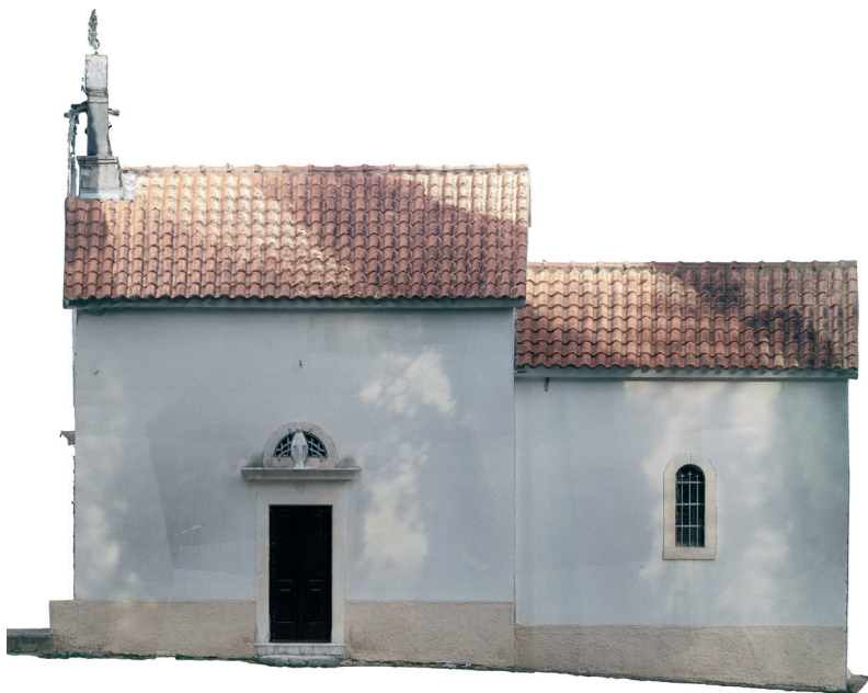
Slika 5. Južni zid crkve, geodetski snimak, izradio dipl. ing. geod. Toni Tadin