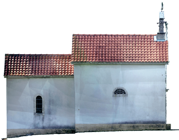
Slika 6. Sjeverni zid crkve, geodetski snimak, izradio dipl. ing. geod. Toni Tadin