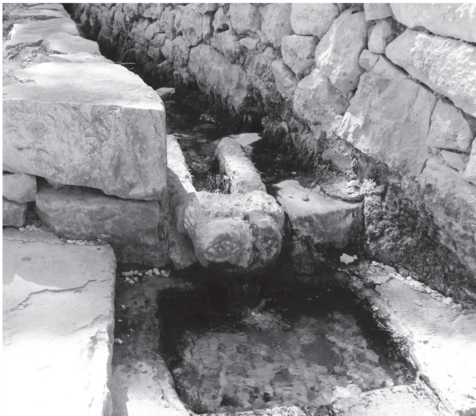
Slika 2. Replika ranoromaničke vodorige ugrađena na kraju kanala uz južni zid ograde oko crkve