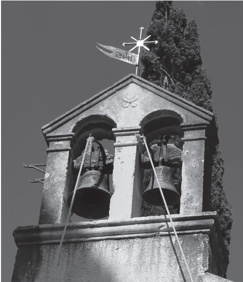
Slika 9. Zvonik na preslicu