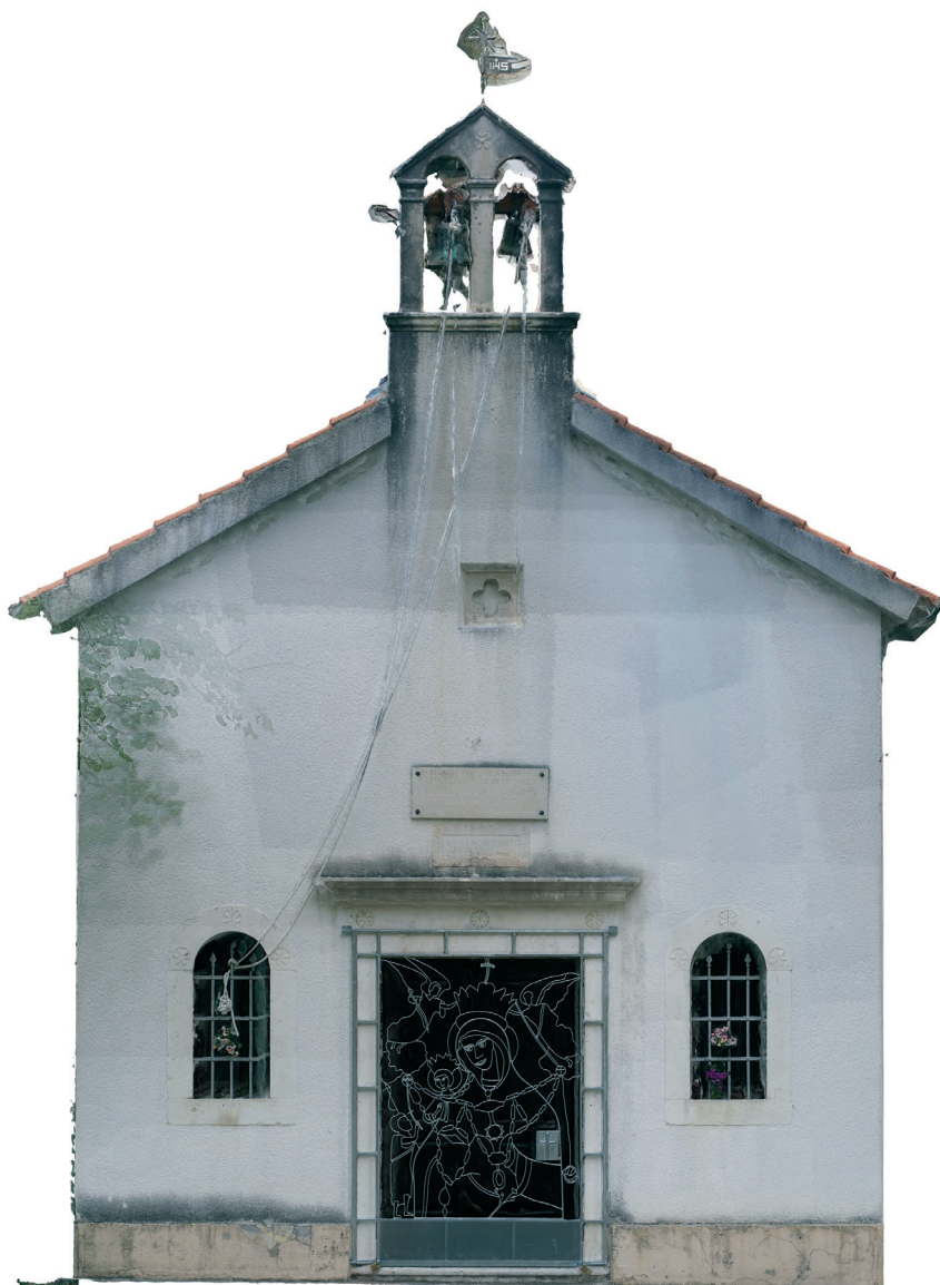
Slika 4. Pročelje, geodetski snimak, izradio dipl. ing. geod. Toni Tadin