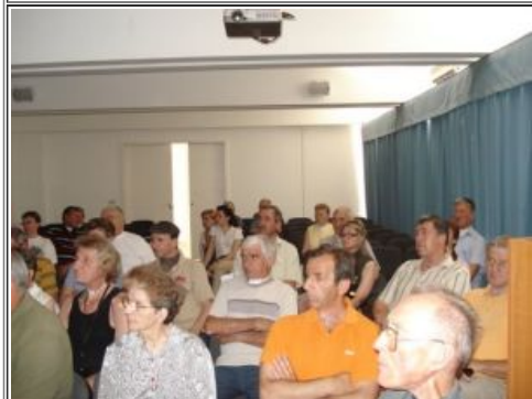
SUDIONIČI SU BILI VRLO ZAINTERESIRANI