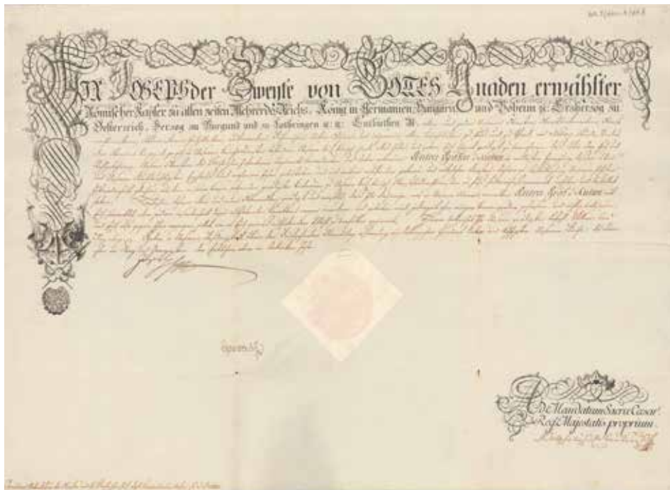
Slika 6. Beč, 15. veljače 1787. Patent Josipa II. kojim objavljuje imenovanje Antuna grofa Khuena general-bojnikom (Oberst-Feldwachtmeister). Ispod vladareva potpisa desno premapotpis predsjednika Ratnoga dvorskoga vijeća Andrije Hadika (»A[ndreas]G[raf]. v. Hadik«), u donjem desnom uglu ispod bilješke ad mandatum premapotpis referenta Rudolfa Alojza Kraussa (»Rudolph Aloys Edler v. Krauß«). HR-HDA-728. Obitelj Khuen-Héderváry Belasy (kut. 5, fasc. 8, fol. 5).

zbog čega ih potpisuje njihov šef. 144 Na navedenom dvorskom dekretu iz 1774. potpisu vrhovnoga komornika prethode njegovu naslovi (»Ihrer Römisch-Kaiserlichen, und Königlichen Majestäten Wirklich-Geheimer Rath, Ritter des Goldenen Vliesses, des König(liche)n St. Stephani Ordens GroßCreuz, und Obrist-Cammerer«). Njihov je potpis na "počasnoj" lijevoj strani ispod teksta, a niži službenici potpisuju ili premapotpisuju ispod bilješke per Imperatorem i sl. Tako je spomenuti dekret Ugarske dvorske kancelarije iz 1624. svojim potpisom ovjerio samo tajnik, već nam poznati Lovro Ferenczffy, ispod bilješke »Per Sacratissimam Caesaream Regiamque Majestatem«, smještene desno ispod teksta dokumenta.