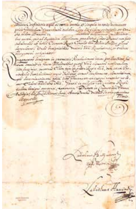
Slika 3. Beč, 6. lipnja 1703. Reskript Leopolda I. hrvatskim staležima o upravi nad granicom između Kupe i Une te ukidanju Varaždinskoga generalata. Ispod vladareva potpisa desno premapotpisi ugarskoga dvorskoga kancelara Ladislava Mátyássovskoga, biskupa nitranskoga (»Ladislaus Mátyássovsky, Epps Nitriensis m. p.«) i tajnika Ugarske dvorske kancelarije Ladislava Hunyadija (»Ladislaus Hunyadi m. p.«). HR-HDA-2. Povlastice Kraljevina Dalmacije, Hrvatske i Slavonije, br. 142.

Različite pozicije premapotpisâ na ranonovovjekovnim dokumentima austrijske i ugarske kancelarije.