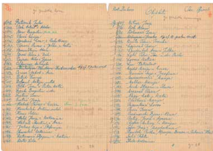
Slika 1. Dio Evidencije odluka o utvrđivanju objekata na području gradske i kotarske komisije Đakovo. HR-HDA-1167.6.2.23.1.1.

Za postupak utvrđivanja objekata najčešće su vođene dvije vrste evidencija. Prvi dio evidencija popisi su objekata za svaku pojedinu komisiju zasebno koji su u pravilu započinjali brojem 1 i završavali brojem ovisno o količini tako evidentiranih odluka. Pojedinačne evidencije koje se odnose na određenu komisiju i imaju uobičajeni tekući niz brojeva u sastavu su gradiva u pripadajućim podserijama. Ako su na nekom području djelovale i kotarska i gradska komisija, odluke su u tim popisima u pravilu evidentirane zajedno, s time da je uz odluku gradske komisije stavljena bilješka "g", kako pokazuje primjer s područja Đakova (Slika 1). U nekim je slučajevima očito da je izvorna evidencija postojala jer su odluke evidentirane i odložene prema postojećim evidencijskim brojevima, ali evidencije nisu pronađene u gradivu. 29