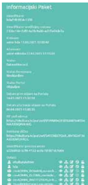
Slika 3. Primjer metapodataka datoteke

Datoteka podrazumijeva digitalni zapis koji je nastao kao proizvod digitalizacije. Na Slici 3 vidljivi su metapodatci datoteke kao što su naziv datoteke, veličina, visina, širina, format, rezolucija, ekstenzija, kompresija i kriptografski sažetak za očuvanje integriteta datoteke. No, svi informacijski paketi ne moraju sadržavati datoteke. Postoje i informacijski paketi bez datoteka koji služe za uspostavljanje nadređene hijerarhijske razine koja će sadržavati dodatne podrazine (primjerice podserija, predmet i sl.) ili informacijski paketi koji sadrže datoteke. Primjerice, na Slici 4 vidljiva je serija koja ne sadrži datoteke, ali sadrži podrazine unutar kojih se nalaze datoteke.