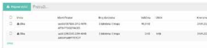
Slika 2. Primjer prikaza u Pojavni oblici

ki niz koji jamči integritet i nepromijenjenost digitalne snimke s ciljem dugoročnoga očuvanja autentičnosti digitaliziranoga gradiva. 11