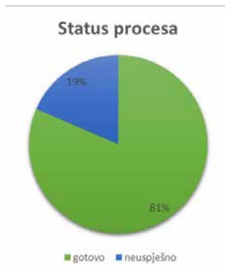
Grafikon 1. Status provedenih postupaka

moguće uočiti da nedostaju određeni zapisi. Provjera na Središnjem sustavu provodi se nasumičnim otvaranjem datoteka kako bi se utvrdila ispravnost poslanoga fonda. Provjera je nasumična jer bi kod prijenosa velikoga broja snimaka utrošak vremena na provjeravanje cijeloga niza snimaka bio neprihvatljivo velik u toj fazi digitalizacije. Statistički gledano, uspješnost prijenosa je visoka. Na Grafikonu 1 vidi se da je 81% postupaka uspješno završeno. 15 Preostalih 19% imalo je neku grešku u jednom od koraka. Prema tomu, ne mogu se svi “uspješno” završeni postupci smatrati uspješnima. Do greške u postupovnim koracima može doći zbog tehničkih poteškoća u sustavu ili zbog ljudske pogreške. Međutim, ljudske se pogreške otkriju već ranije prilikom učitavanja datoteka u aplikaciju Goobi. Primjer je ljudske pogreške zatipak u polju Identifikator u Excel datoteci s metapodacima. Recimo da je u fondu 252 kao identifikator serije naveden identifikator HR-HDA-259-2, umjesto HR-HDA-252-2. I u tom slučaju je grešku jednostavno ispraviti jer je riječ o krivom broju fonda unutar Identifikatora . Greške koje se javljaju u sustavu rješavaju se kontaktiranjem pružatelja usluge razvoja i održavanja sustava 16 ako je problem takve prirode da se ne može jednostavno riješiti kao u prethodno navedenom primjeru.