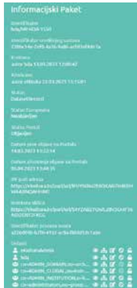
Slika 5. Primjer podataka informacijskoga paketa

Na Slici 5 prikazani su podaci informacijskoga paketa, primjerice identifikator, tko je i kada kreirao informacijski paket te tko je i kada ažurirao informacijski paket. Za status paketa na OAI-PMH sučelju mogu se odabrati četiri opcije: Neobjavljen , Objavljen , Dataset i DatasetRecord . OAI-PMH uključuje davatelja podataka (eng. data provider ) koji izlaže metapodatke o gradivu i pružatelja usluga (eng. service provider ) koji prikuplja te metapodatke. 12 Ako davatelj podataka nema namjeru objaviti jedinicu gradiva na OAI-PMH sučelju, status će biti Neobjavljen . U slučaju da informacijski paket obuhvaća jedinicu gradiva koja će biti dostupna za pobiranje i objavu na javnim portalima (npr. e-Kultura ), status će biti Objavljen . Status Dataset znači da informacijski paket predstavlja zbirku koja sadrži pripadajuće informacijske pakete namijenjene za objavu, ali podaci o samoj zbirci ili fondu kao najvišoj razini hijerarhije neće biti objavljeni jer zbirka u tom slučaju neće predstavljati jedinicu gradiva. Tako da će zbirka sa statusom Dataset i njezini pripadajući informacijski paketi biti dostupni za pobiranje i objavu u obliku zbirke isključivo na portalu e-Kultura . No, ta ista zbirka neće biti objavljena na Europeani upravo jer taj portal nema mogućnost prikaza zbirke kao jedinice gradiva. Status DatasetRecord kreiran je isključivo za potrebe arhiva. Rabi se ako se želi objaviti informacijski paket kao zbirku, ali i jedinicu gradiva (eng. record ).