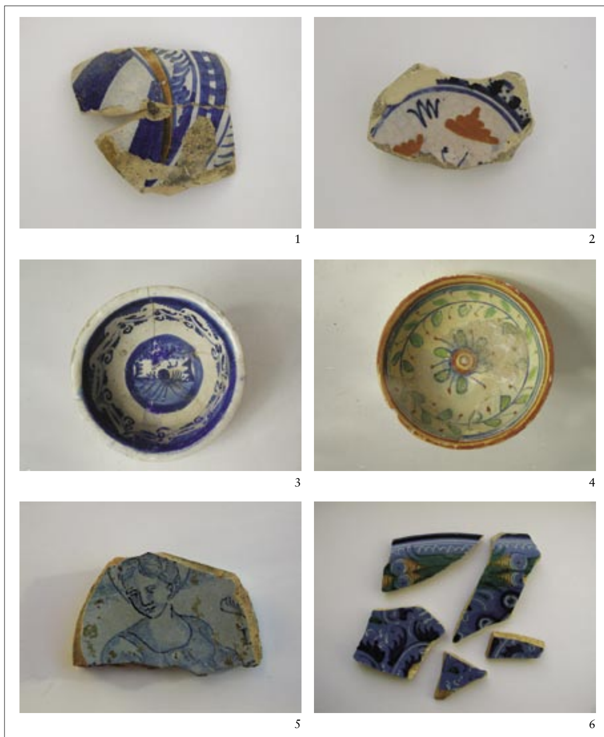
T. III. Majolika: dekoracija cvjetne gotike 1-2; alla porcellana 3; a foglia d'ulivo 4, berettina 5-6. Pl. III. Majolica: floral Gothic decoration 1-2; alla porcellana 3; a foglia d'ulivo 4; berettina 5-6.