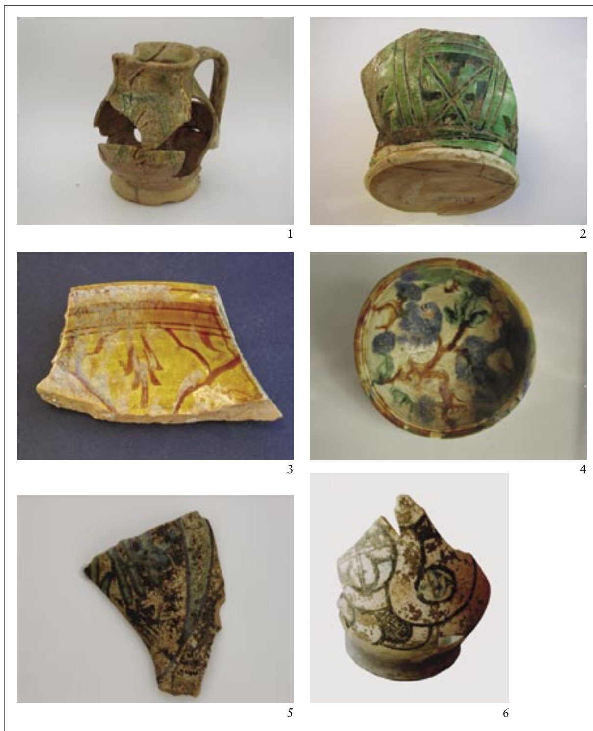
T. II. Gravirana keramika: arhajska 1, a punta e stecca 2-3; alla trevisana 4; Arhajska majolika: 5-6. Pl. II. Engraved pottery: archaic 1; a punta e stecca 2-3; alla trevisana 4; archaic majolica 5-6.