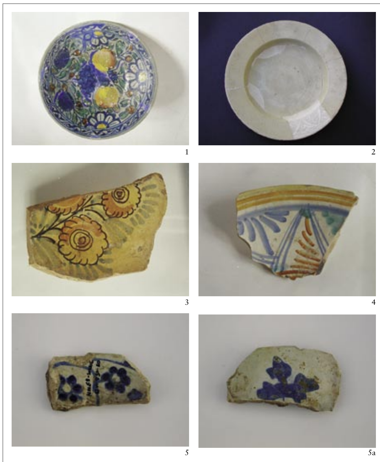
T. IV. Majolika: berettina 1, bianco su bianco 2, compendiaria 3, kasna 4; španjolska ili hispano-maurska 5-5a. Pl. IV. Majolika: berettina 1; bianco su bianco 2; compendiaria 3; late 4; Spanish or Hispano-Moorish 5-5a.