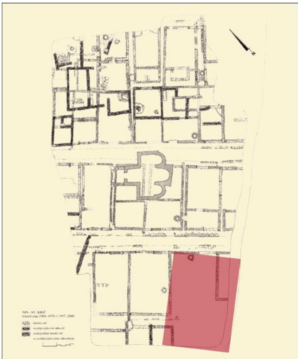
Plan 1. Položaj kuće iz gotičko – renesansnog razdoblja u okolišu crkve sv. Križa u Ninu Plan 1. The position of the house from the Gothic-Renaissance period in the vicinity of the Church of the Holy Cross in Nin.