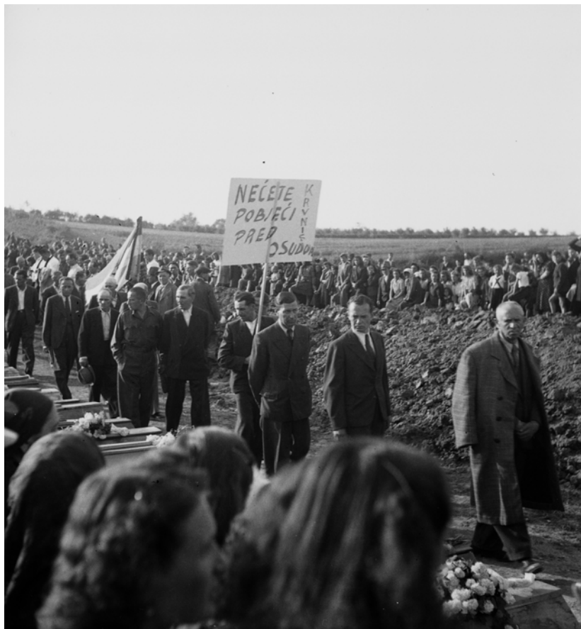
Slika 2 a, b: Sahrana žrtava u Sisku (HR-HDA-1422, Z-316 i Z-307).

Pregled posmrtnih ostataka žrtava ukazao je da su ubijene hladnim oružjem. Preminule su od ubodnih rana u predelu vrata ili zatiljka, ili od fraktura lobanje načinjenih sekirom, maljem ili sličnim tupim predmetom. Pojedina tela su pronađena s rukama vezanim iza leđa ili s tegovima vezanim za okove kako bi se sprečilo da žrtve pobegnu za vreme kratkog hoda do gubilišta, ili pak kako bi se osiguralo da tela potonu na dno reke. Među žrtvama je bio znatan broj žena, a neka tela su izgledala kao da je reč o muškim adolescenti-