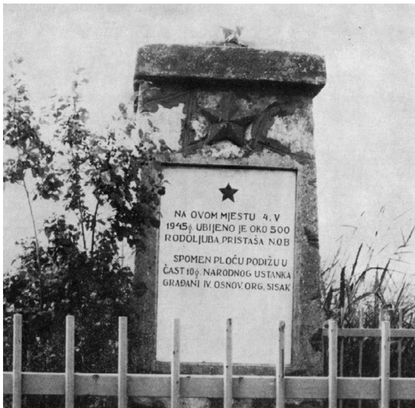
Slika 3: Spomenici u Sisku posve- ćeni savskim žrtvama iz a) 1951. i b) 1956. godine.

Još jedna prepreka za veće uvažavanje stradanja civila, uključujući i stradanja u Sisku, bila je to što su sve do osamdesetih glavna dokumenta u vezi s ratnim zločinima – prvobitno i u najvećoj meri prikupljena od strane