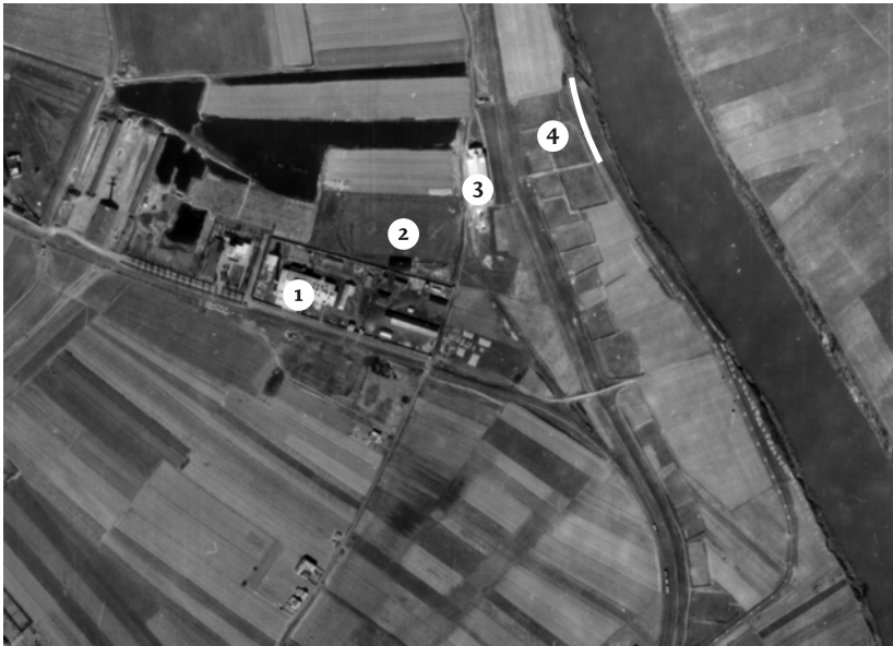
Slika 6: Fotografija iz vazduha fabrike stakla Staklana, koju su napravili saveznici početkom aprila 1945.

Kasno po podne četvrtog maja, kada je partizanska artiljerija već bila u neposrednoj blizini, ustaše su počele s likvidacijom zatvora u Sisku. 96 U sumrak je oko 25 ustaških vojnika formiralo polukrug oko ulaza u Staklanu. 97 Zatvorenici su sprovedeni u dvorište, gde su im ruke vezane iza leđa. Potom su naterani da hodaju u malim grupama oko 400 metara do obale Save. Slika 6 je segment iz vazdušne fotografije Siska koju su napravili saveznički izviđački avioni 3. aprila 1945. Na njoj se vidi područje oko fabrike stakla i mesto masakra. 98 Na putu do obale reke, zatvorenici su prošli pored fudbalskog igrališta iza Staklane, a zatim