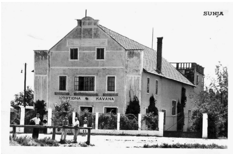
Slika 4: Zgrada Sokolane u Sunji. Poštanska razglednica iz tridesetih godina 20. veka.

Sunje manje od 40 kilometara, značila je da ustašama i nije bio potreban logor u samom selu. 64