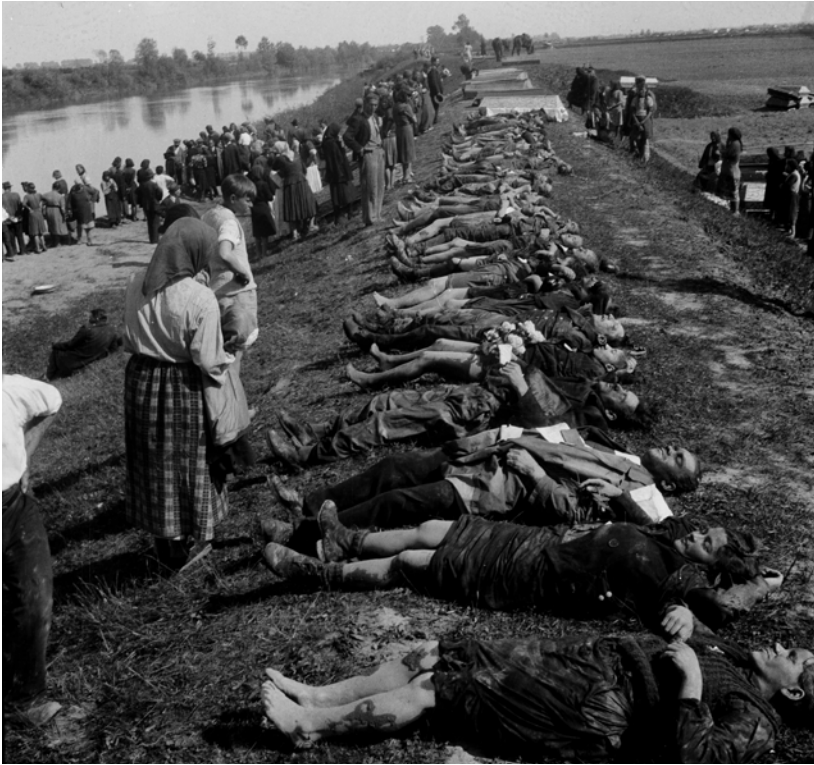
Slika 1 a, b: Fotografije iz Siska kao sveprisutne ilustracije ustaških zverstava (HR-HDA-1422, Z-177 i Z-193).

se fotografije određenih zločina koriste kao ilustracija nekog aspekta istorije, onda istoričari moraju prvo da “odgovore na etički imperativ da saznaju više” o tome šta te fotografije zapravo predstavljaju. 4