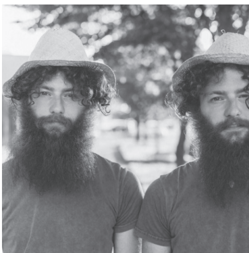
Slika 1: Jednojajčani blizanci

Jednojajčani ili monozigotni blizanci (Slika 1.) nastaju kada se jednim spermijem oplodi jedna jajna stanica te nastaje zigota koja se odmah nakon toga podijeli, a razlozi njihova nastanka kod ljudi nisu u potpunosti razjašnjeni. Osim što su fenotipski iznimno slični, jednojajčane se blizance donedavno smatralo i genetički identičnima. Međutim, iako nastaju dijeljenjem jedne zigote, osim somatskih mutacija, u njihovim se zametnim stanicama mogu pronaći i vrlo male razlike u genotipu, što ih može razlikovati u slučajevima dokazivanja očinstva i kao počinitelje kaznenih djela (Rolf, Krawczak, 2021). Osim toga, kod njih postoji 5 do 10% veći rizik od nastanka strukturnih defekata tkiva i organa pa mogu biti i fenotipski različiti u smislu strukturnih porođajnih mana (Turnpenny, Ellard, 2011).