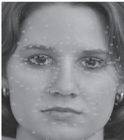
Slika 6: Shema označavanja točaka na licu

T. Hoang Ngan Le, Khoa Luu, Keshav Seshadri i Marios Savvides sa Sveučilišta Mellon u Pittsburghu 2012. godine proveli su istraživanje prepoznavanja lica jednojajčanih blizanaca te predložili pristup prepoznavanju njihovih lica korištenjem klasifikacijske skupine blizanaca, kao što su linije osmijeha oko usana, očiju, nosa i čela te značajki starenja lica. Drugačiji životni stilovi i različite životne okolnosti kao što su stres, tjelesna građa, prištići, madeži, izloženost suncu, pušenje i slično utječu na starenje lica osobe odnosno na njezin izgled, što može pomoći i u raspoznavanju jednojajčanih blizanaca. U sklopu navedenog istraživanja razvijen je računalni program za analizu značajki lica, posebno crta lica jednojajčanih blizanaca te je analizirano 126 parova jednojajčanih blizanaca. Eksperimentalni su rezultati bili najprecizniji kada su slike jednojajčanih blizanaca snimljene istog dana i u istom studijskom okruženju jer je tada sustav nedvojbeno raspoznao 90% analiziranih parova jednojajčanih blizanaca (Ngan Le, Luu, Seshadri i Savvides, 2012). Takvi i slični računalni programi za ispitivanje karakteristika lica (Slika 6) i raspoznavanje osoba važni su ako su pronađeni fotografski ili videomaterijali koji prikazuju jednojajčane blizance u kontekstu nekog kaznenog djela. Rezultati analize navedenog materijala mogu razlučiti jednojajčane blizance i time postati važni dokazi u rješavanju navedenog slučaja.