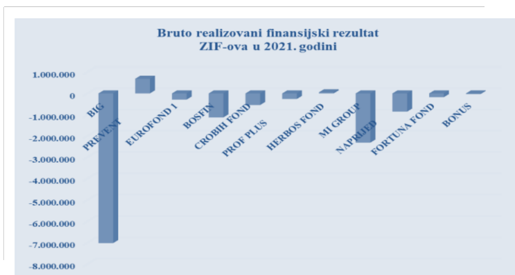
Grafikon 1. Bruto realizovani finansijski rezultat ZIF-ova u FBiH, u 2021. godini