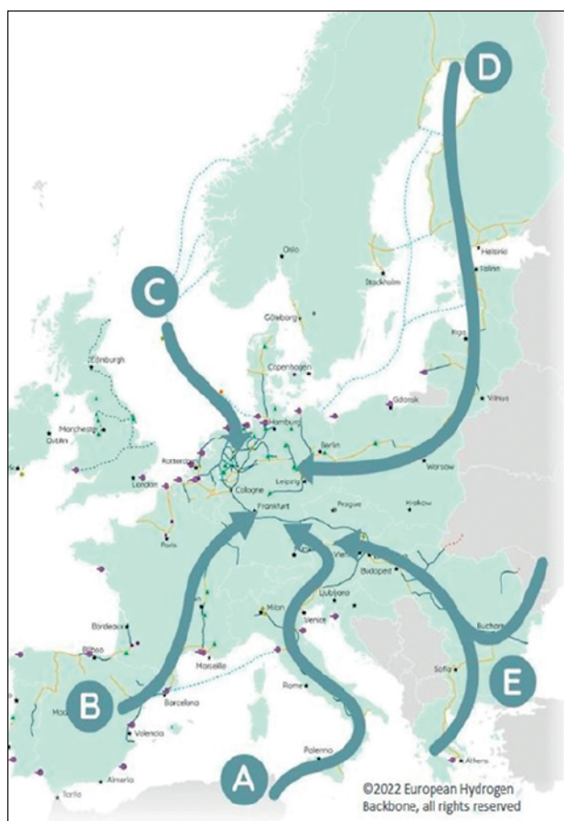
Slika 4. Prikaz pet velikih plinovodnih koridora koje je EHB predvidio nakon donošenja plana REPowerEU