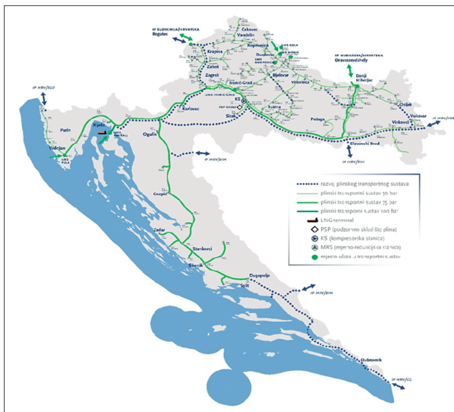
Slika 1. Plinski transportni sustav Republike Hrvatske

Kad je riječ o hrvatskoj plinskoj transportnoj mreži, njome upravlja Plinacro, kao hrvatski operator plinskog transportnog sustava (OTS). U svom sastavu ima oko 2500 km plinovoda 50-barskog, 75-barskog i 100-barskog sustava i više od 450 nadzemnih objekata transportnog sustava, a hrvatski plinski transportni sustav, putem dviju interkonekcija, spojen je s plinskim transportnim sustavima Slovenije i Mađarske.