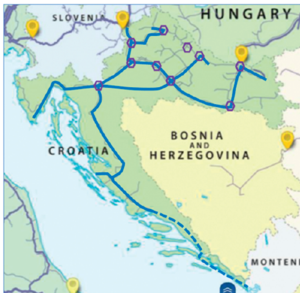
Slika 5. Prikaz planiranih Plinacrovih projekata za vodik