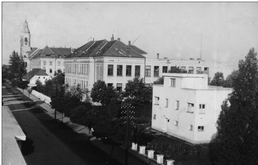
Zgrada novog samostana, školska zgrada i zgrada dječje poliklinike. Snimljeno pedesetih godina 20. st.