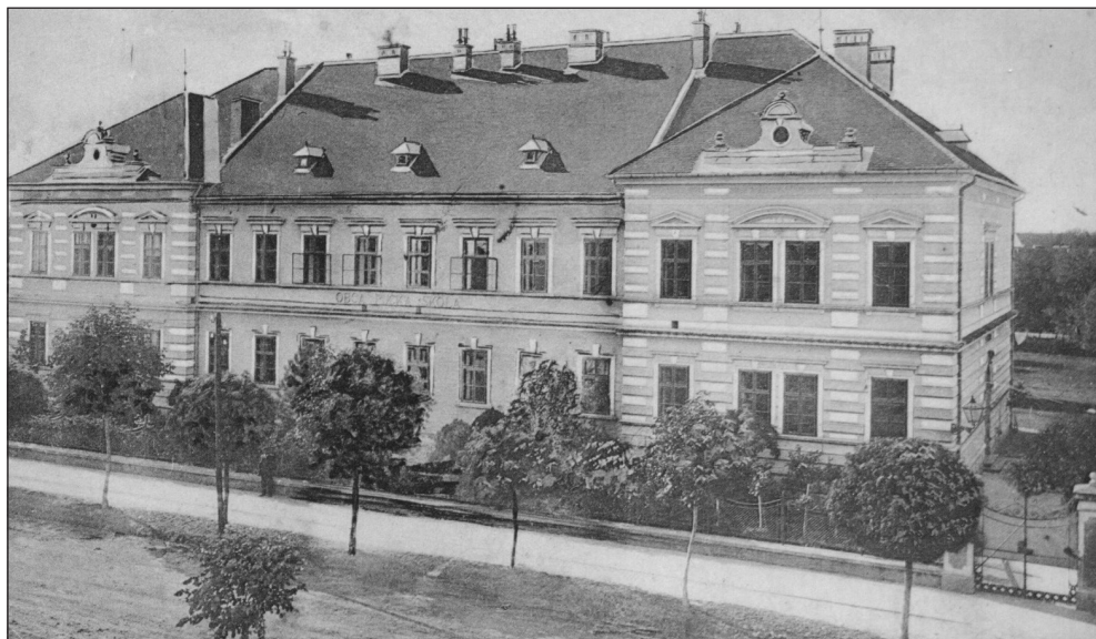
Zgrada Obće pučke škole na razglednici izdavača Rudolfa Bode, koja je sagrađena 1898. godine.

Poslije Drugog svjetskog rata ovdje su djelovale dvije sedmogodišnje škole (sedmoljetke), Muška sedmogodišnja i Ženska sedmogodišnja škola. 237 Ženska sedmogodišnja škola bila je smještena u prizemlju, a Muška sedmogodišnja škola na katu. Kako je škola imala problema s prostorom za rad, prvi razred bio je smješten u prostorije „Đakovačkog mlina na valjke”. 238