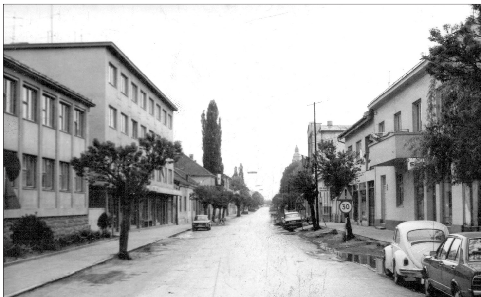
Snimka ulice sa zapadne strane prema istočnom. Snimljeno sedamdesetih godina 20. st.