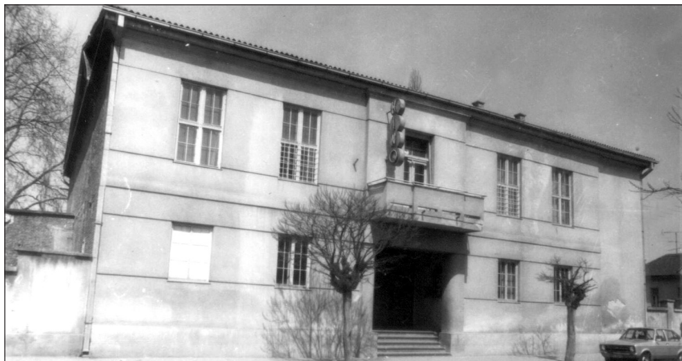
Zgrada Doma kulture, ranije Hrvatskog doma, koja je dovršena 1937., a zatvorena 1980. godine. Snimka iz sedamdeseth godina 20. st.