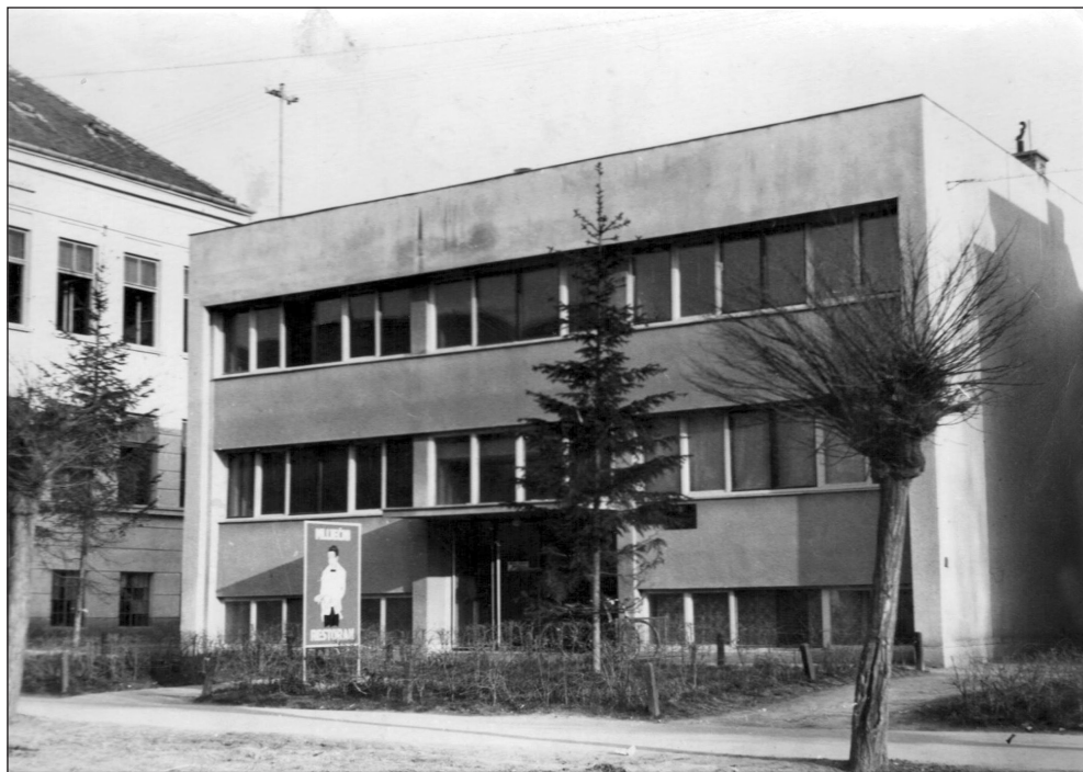
Zgrada Crvenog križa, u čijim je podrumskim prostorima bio Mliječni restoran.