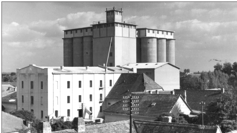
Stari vlastelinski mlin i kompleks novijih silosa. Snimljeno sedamdesetih godina 20. st.

Godine 1947. mlin je nacionaliziran. 210 Vjerojatno je još ranije upravu nad mlinom preuzela tadašnja nova vlast. Godine 1948. predan je na upravljanje Državnom poduzeću „Štediša”. Rješenjem direkcije za mlinove u Zagrebu mlin je 1. siječnja 1949. pripojen kao pogon mlinskom poduzeću „Kozara” Vinkovci, a poslije likvidacije sredinom 1950. radi pod okriljem mlinskog poduzeća „Croatia” iz Osijeka. 211 Neko vrijeme je, što je vidljivo s fotografija, djelovao pod istaknutim nazivom „Đakovački mlin na valjke”. Godine 1951. mlin ulazi u sastav poduzeća „Đakovština” – poduzeće za promet i preradu žitarica 212 , a koje je djelovalo u sastavu „Žitnog fonda”, poduzeća koje je osnovano 1951. godine i koje je preuzelo sve mlinove u državnom vlasništvu na području tadašnjega đakovačkog kotara. U sastavu poduzeća bili su: mlinovi u Đakovu, Velikoj Kopanici, Tomašancima, Drenju, Trnavi i Vrpolju (koji je 1951. godine bio demontiran i upućen u Fužine), sušare u Đakovu i Vrpolju