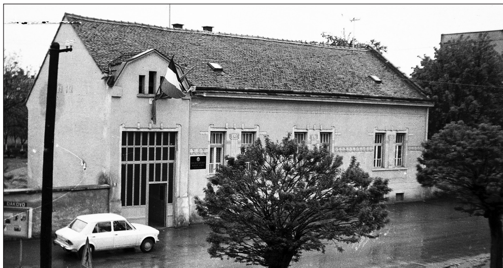
Zgrada nekadašnjeg Doma JNA.