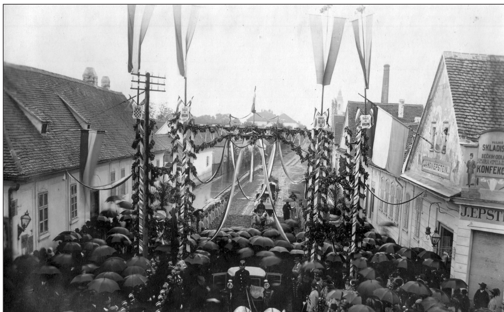
Snimka sa zapadnog dijela ulice ka istočnom 1910. godine prigodom dočeka biskupa Krapca.