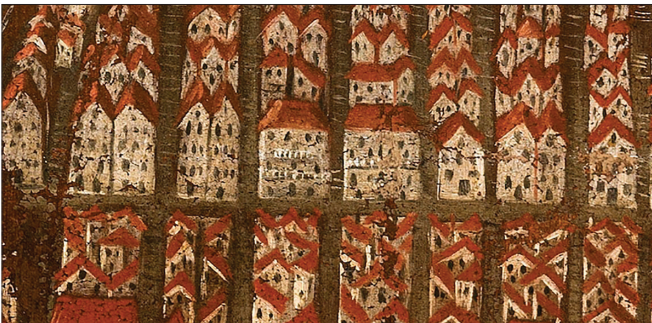
Slika 2. Napoznati slikar, Veduta Dubrovnika, 17. stoljeće. Dubrovnik, Društvo prijatelja dubrovačke starine [detalj urbane strukture seksterija Sv. Nikole]