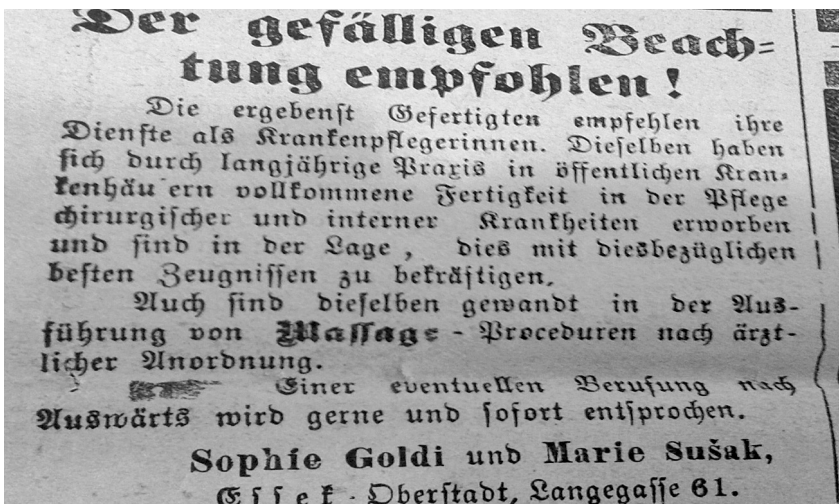
Slika 4. Reklama za uslugu masaže po kućama objavljena na gotici u Die Drau , ožujak 1898.

Da doista nije riječ o osobama koje su školovane njegovateljice, svjedoči, sukladno propisima Pravilnika za nadziranje prostitucije u gradu Osijeku iz 1896. , poziv gradskoga redarstva dvjema damama da 14. ožujka 1898. u 10 sati dođu u ured Gradskoga redarstva te se prijave radi saslušanja gradskom fiziku (liječniku) gosp. doktoru Ferdi Knappu. Na poleđini dokumenta, koji je sačuvan u dokumentaciji gradskoga redarstva grada Osijeka u Državnom arhivu Osijek, stoji primjedba kako su dotične „prema iskazu susjeda morale hitno otputovati u Beč“. 66