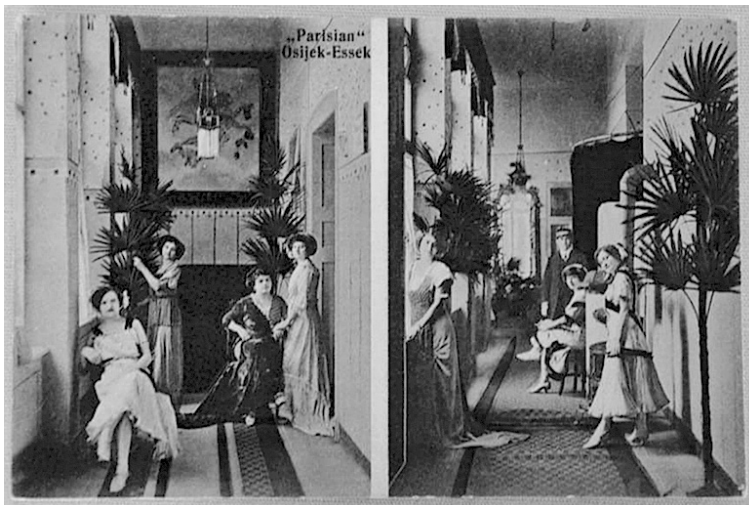
Slika 1: Razglednica svratišta Parisian, interijer

Osim Parisiana, jedno od poznatijih bludilišta u gradu bilo je i ono Toše Muačevića koje se jednostavno zvalo „Zum Toscho”. U gradskoj evidenciji različitih javnih