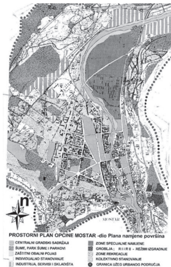
Slika 7. Izvod iz urbanističkog (prostornoga) grada Mostara prije njegove izmjene, kada parkovske površine postaju građevno zemljište

Sljedeći planovi omogućili su izgradnju stambeno-poslovne zgrade u čijemu je prizemlju poslovni prostor Inel, upravne zgrade Elektroprivrede i goleme poslovno-trgovačke zgrade, sve uz Hrvatski dom Herceg Stjepan Kosača. U Ulici kneza Branimira neprimjereno je rekonstruirana vila iz razdoblja moderne arhitekture, nekada vlasništvo Aiše Hadžiomana, 29 sada zgrada Elektroprivrede, a u Ulici kralja Petra Krešimira IV. srušena je vila obitelji Hackl. Vrhunac devastiranja toga prostora jest gradnja septičke jame u parku Zrinjevac, umjesto da su sve zgrade priključene na postojeću kanalizaciju iz 19. stoljeća. Navedenim intervencijama devastiran je i uništen vrijedan urbanistički