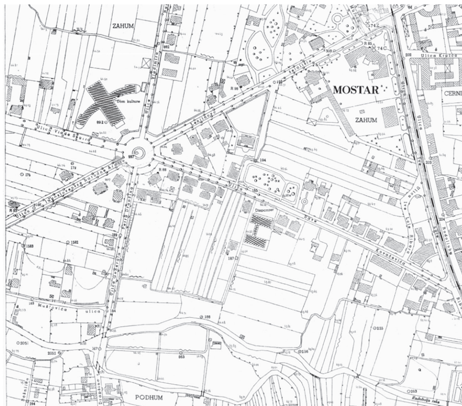
Slika 3. Karta Rondoja iz 1954., kakva je bila do 1995. godine

Prije tridesetak godina na scenu stupaju ljudi koje bi se moglo nazvati građomrziteljima, 15 koji se ne prilagođavaju gradu i urbanomu načinu mišljenja i življenja, nego grad prilagođavaju sebi i svojoj (ne)kulturi i civilizacijskoj razini. U skladu sa svojim (ne)znanjem, a poglavito interesima donose i zakone i urbana pravila.