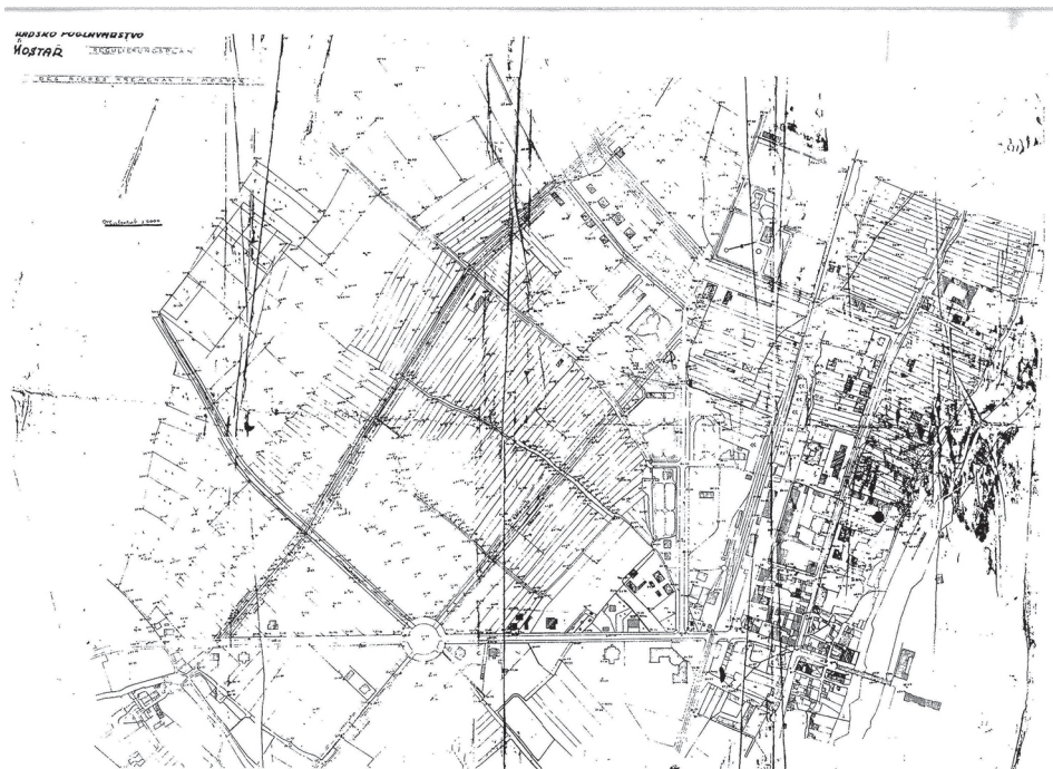
Slika 2. Regulacijski plan Rondo iz 1894. godine