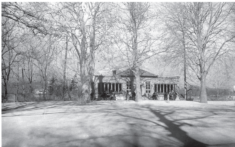
Slika 4. Drveni paviljon, kavana Rondo, reper i žarište grada

„važni“ politički događaji, a kavana je zaklanjala pogled na tu „veličanstvenu, monumentalnu“ 18 arhitekturu iz vremena socijalističkoga realizma. 19 Tako je srušen jedan humani, diskretni objekt, vizualno nenametljiv, dio gradske memorije, koji je živio cijelu godinu, samo zato da bi se mogla vidjeti jedna tipska zgrada iz Staljinova doba kakvih od Mostara do Vladivostoka ima desetke tisuća.