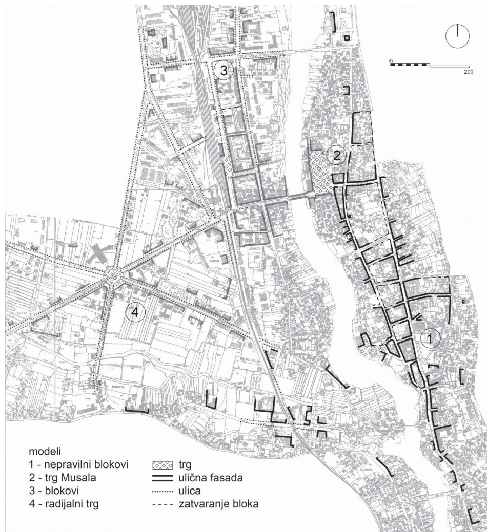
Slika 1. Četvrti model urbanizacije Mostara u razdoblju Austrougarske Monarhije (debele crte prikazuju fasade zgrada toga modela)

Köhler“. Crvenim tušem iscrtan je i Rondo i četiri ulice kojim je uokvireno urbanističko rješenje. 11 Posljednja je faza izgradnje planiranje Ulice Muštovića (danas Ulica Bariše Smoljana) i Kalemove ulice (danas Zagrebačka ulica). 12