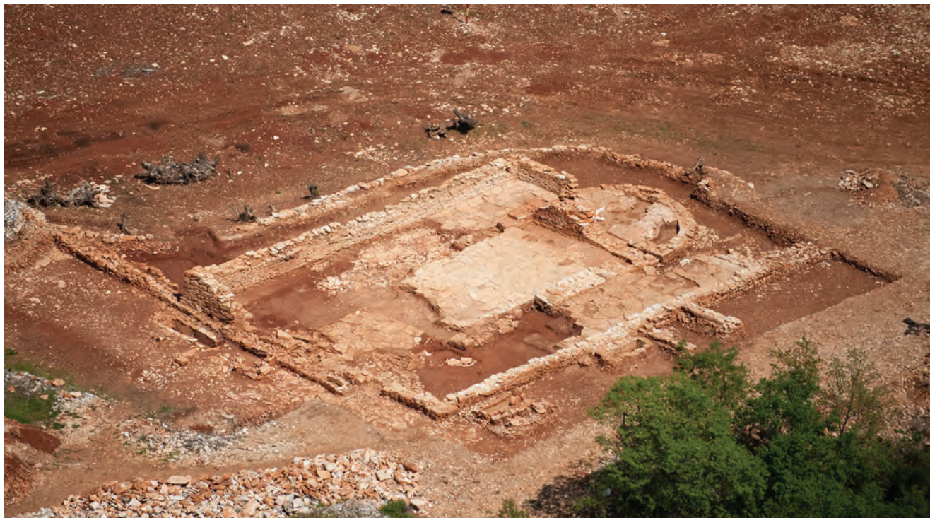
Sl. 1 Istražena crkva sv. Petra od sedam vrata kod Vodnjana.