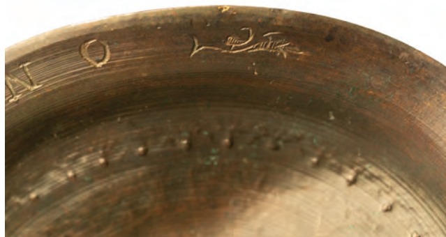
Sl. 6 Donja strana podnožja s natpisom i nedefiniranim motivom.

Fig. 6 The underside of the base with an inscription and an unidentified motif.