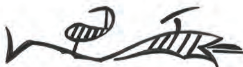
Sl. 8 Detalj s donje strane podnožja, urezani nedefinirani motiv (crtež: V. Sošić Žuža).

Na obodu s donje strane podnožja nalazi se urezani natpis: DELLA SCVOLA DE • S • QVERINO , a koji spominje bratovštinu sv. Kvirina (sl. 6, 7). U nastavku natpisa nalazi se nedefinirani motiv koji moguće ukazuje na znak spomenute bratovštine (sl. 8).