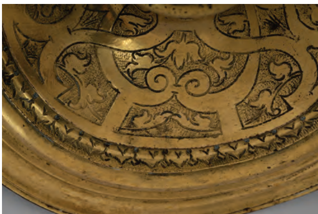
Sl. 5 Detalji urezane dekoracije. Fig. 5 A detail of the incised decoration.

međuprstenova glatke površine, dok nodus, kao i gornji dio i drške i samog predmeta, nedostaje.