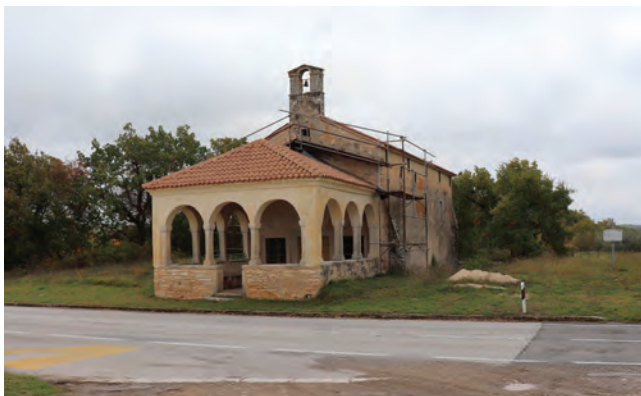
Sl. 9 Crkva sv. Kvirina uz cestu Vodnjan - Juršići za koju se veže istoimena bratovština.