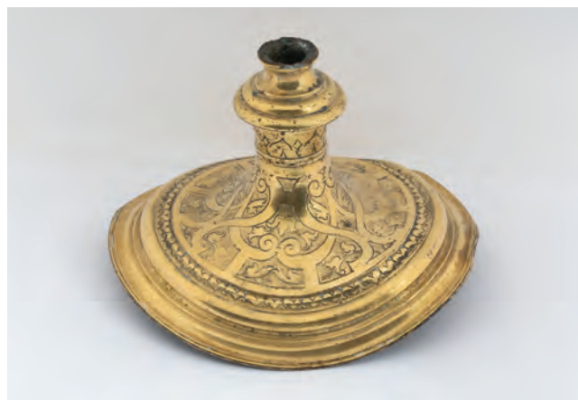
Sl. 3 Podnožje liturgijskog predmeta. Fig. 3 The base of the liturgical object.