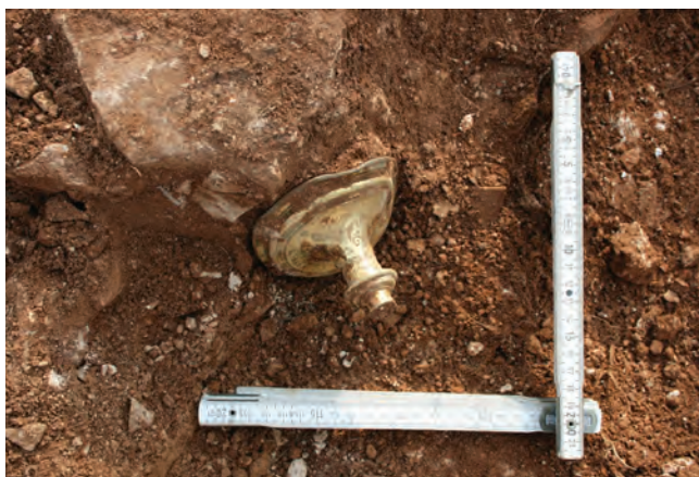
Sl. 2 Podnožje prilikom pronalaska. Fig. 2 The base at the time of its discovery.