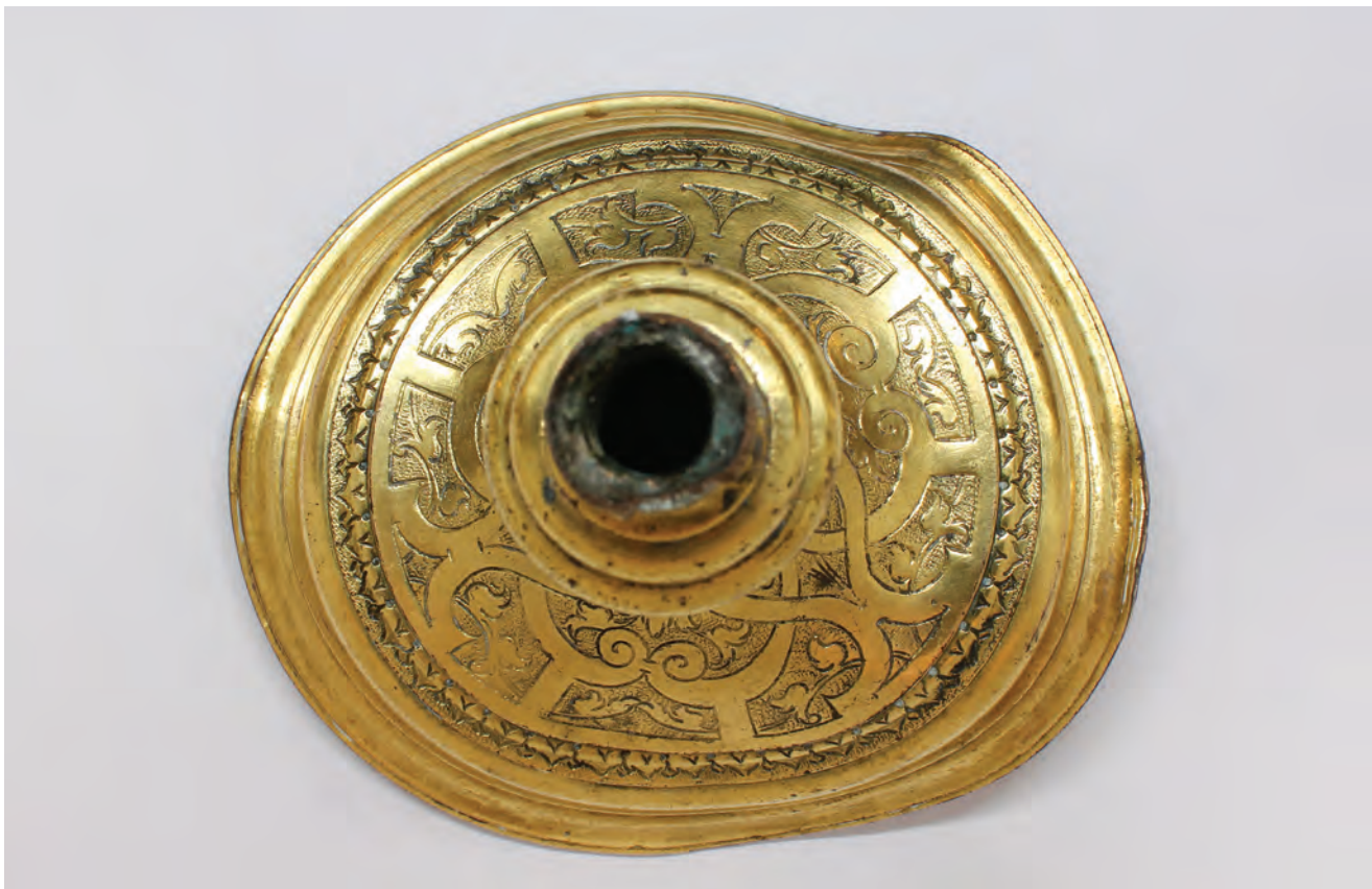
Sl. 4 Dekorativna kompozicija podnožja. Fig. 4 The decorative composition of the base.