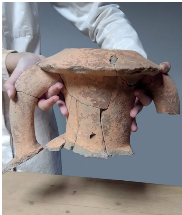
Sl. 3 Restauratorski radovi na amfori Korint A tipa Fig. 3 Restoration works on the Corinth A type amphora

Hvaru, u organizaciji Instituta za arheologiju i Muzeja Staroga Grada, uspješno je održan znanstveni skup Between Global and Local: Adriatic Connectivity from Protohistory to the Roman Period . Skup je bio hibridnog tipa; dio predavanja održavao se uživo a ostatak online . Kroz sudjelovanje preko 25 autora iz šest zemalja i tri kontinenta (Europe, Australije i Južne Amerike) predstavljene su zanimljive i značajne nove teme vezane uz Jadran u posljednjem tisućljeću pr. Kr.