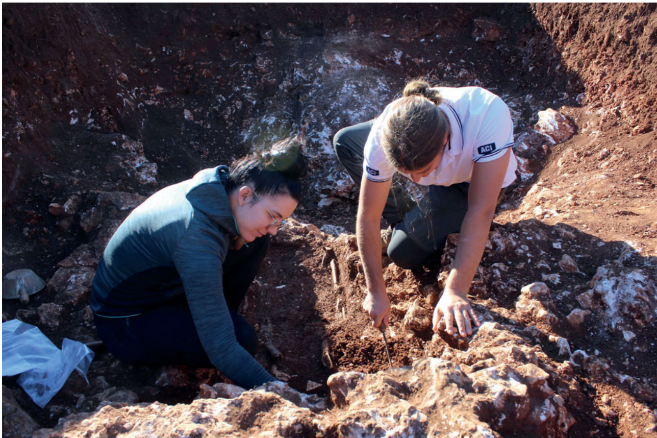
Sl. 1 Istraživanje nekropole u južnom dijelu Staroga Grada

Najvažnija otkrića, koja su na svjetlo dana iznijela terenska istraživanja, vežu se uz nove spoznaje o pogrebnim običajima i gradskom perimetru grada Fara. Nastavljeno je iskopavanje na području južno od antičkog Fara (predio Peča) gdje je prethodne godine otkriven i istražen grob s nalazima željeznog mača (kopisa) i koplja, kako bi se odredilo je li riječ o slučajnom nalazu ili lokaciji nekropole. Pronalazak dva nova ukopa u škrapu stijene i velikim dijelom in situ sačuvane amfore Korint A tipa, govori u prilog da je ipak riječ o funerarnom karakteru tog prostora, odnosno vjerojatno otkriću nekropole (sl. 1). Uz to, ovogodišnja probna iskopavanja usmjerena su po prvi put i na prostor bliže poznatom segmentu istočnog bedema grada Fara (istočno od lokaliteta Remete vrt), gdje su na svjetlo dana izašli tragovi monumentalne suhozidne arhitekture koja se preliminarno može povezati uz najraniju fortifikacijsku fazu Fara iz 4. st. pr. Kr. (sl. 2). Kraća iskopavanja provedena su i poviše Dominikanskog samostana, tik ispod mjesnog groblja, no na toj lokaciji nisu utvrđeni arheološki ostaci.