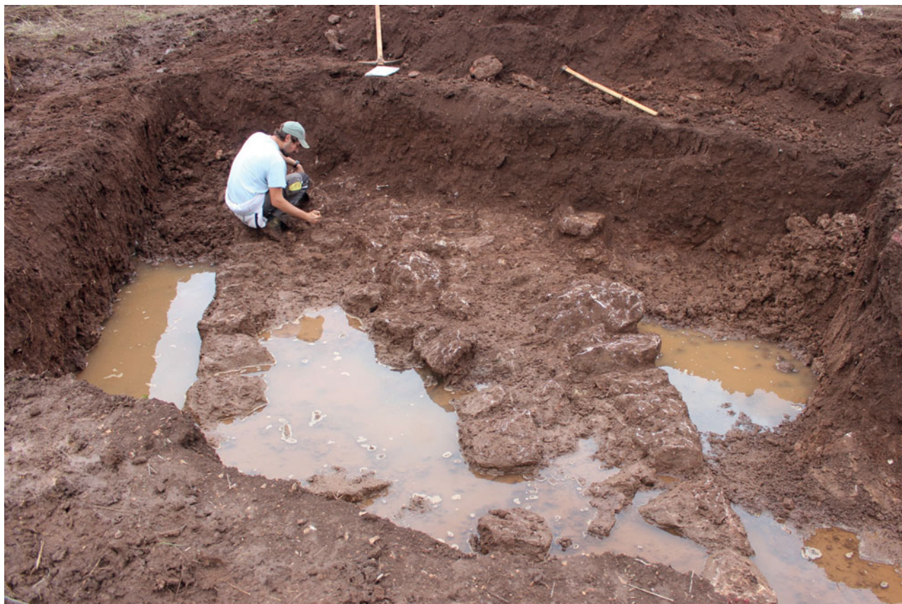
Sl. 2 Istraživanje fortifikacijske arhitekture u Starome Gradu Fig. 2 Excavation of the fortification architecture in Stari Grad

Manja iskopavanja, u suradnji s tvrtkom Kantharos d.o.o., bila su usmjerena i gradinu Vela Glava poviše Hvara, prethodno poznatu iz literature (Visković 2019: 12). Do sada istraživanja nisu vršena pa samim time nedostaju pouzdani kronološki i kulturološki podaci. Unutar dvije manje sonde na jugoistočnom i istočnom rubu gradine, potvrđen je plići sloj u kojemu su otkriveni isključivo prapovijesni pokretni nalazi, pretežno ulomci keramičkih posuda, no prikupljeni su i ostaci životinjskih kostiju i kućnog lijepa.