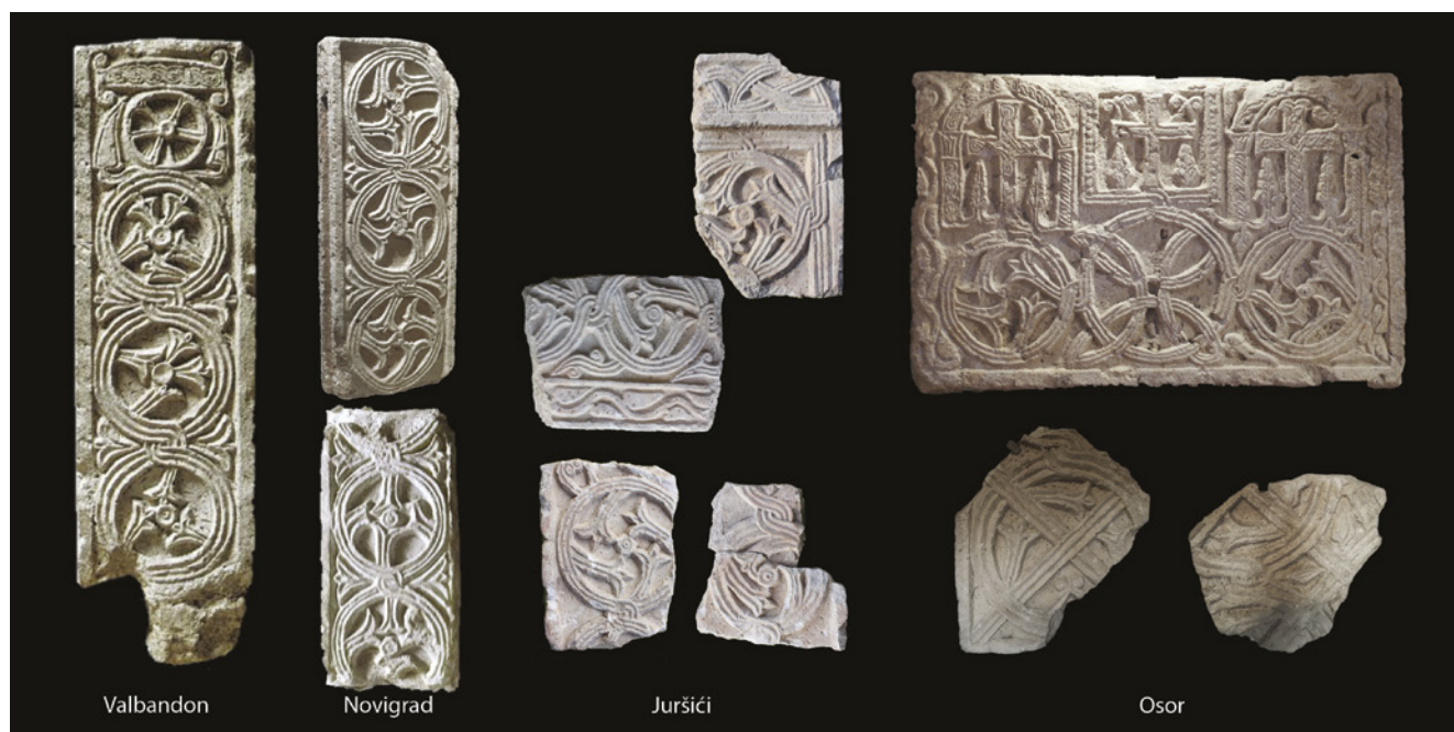
7. Primjeri istog motiva na skulpturi iz: Valbandona i Novigrada (izvor: IVAN MATEJČIĆ – SUNČICA MUSTAČ /bilj. 12/, 158, 169), Juršića (foto: AMI Pula) i Osora (foto: M. Vicelja i N. Belošević)

Examples of the same motif in the sculpture from Valbandon, Novigrad, Juršići, and Osor