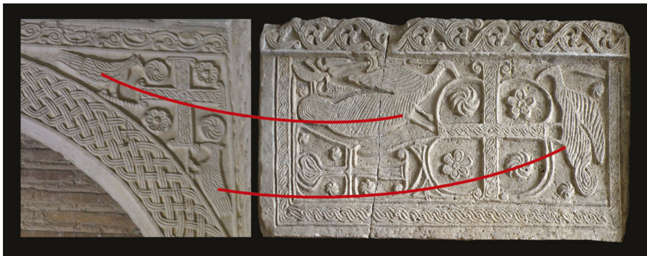
2. Detalj arkade tzv. Eleukadijeva ciborija iz Ravenne i plutej lijeve strane oltarne ograde iz Valbandona

Detail of the arcade from the so-called "Ciborium of Eleucadius", Ravenna; left panel of the chancel screen from Valbandon