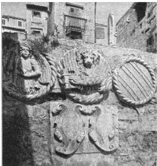
6. Grbovi na jugozapadnom ogradnom zidu Četiri bunara kod Dagoberta Freya

Coats of arms on the southwest fence wall of the Four Wells