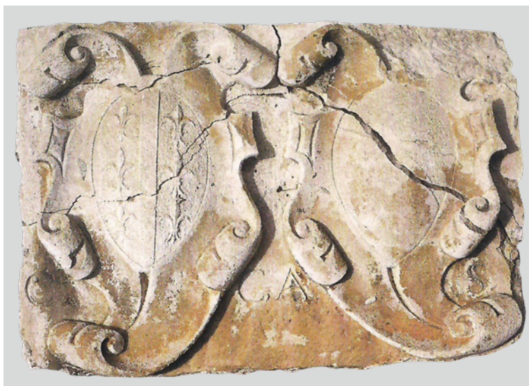
7. Grbovi šibenskih kneževa Kristofora Canala i Andree Soranza u Muzeju grada Šibenika

Coats of arms on the southwest fence wall of the Four Wells