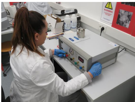
Sušilo kritične točke