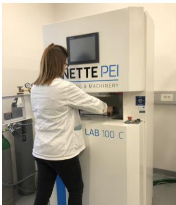
Vakuumska kompresijska preša