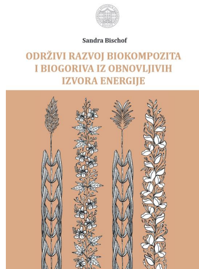
Sl.3 Naslovnica Sveučilišnog priručnika Održivi razvoj biokompozita i biogoriva

svojim rezultatima potvrđuje da agro-otpad može imati dualnu primjenu: u proizvodnji biokompozita i biogoriva.