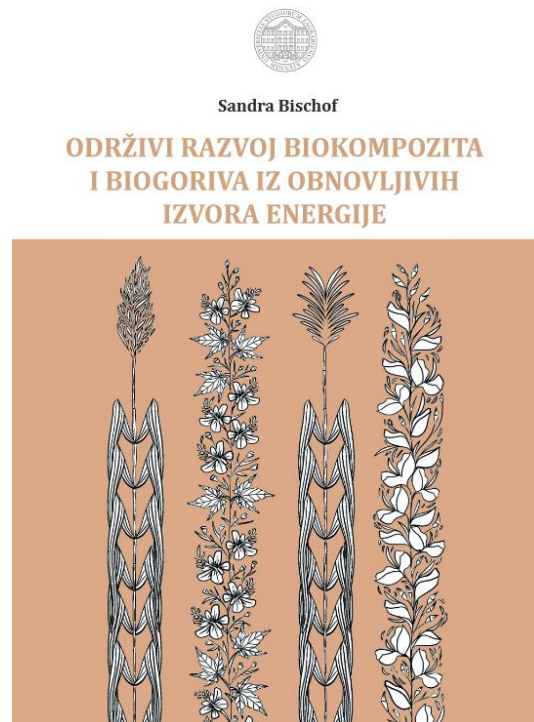
Sl.3 Naslovnica Sveučilišnog priručnika Održivi razvoj biokompozita i biogoriva

S obzirom na sve veće zahtjeve koje nameće zakonska regulativa s jedne strane, ali i tržište s druge strane razvoj ovakvih bioproizvoda ima sve veći značaj.