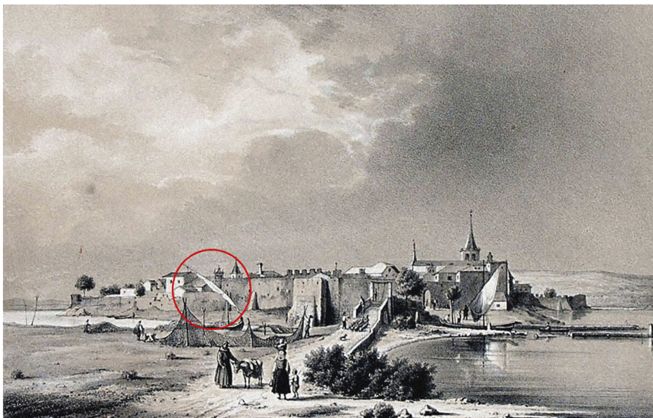
2. Veduta Osora, iz: AUGUST SELB – AUGUST ANTON TISCHBEIN (bilj. 6)

Veduta of Osor