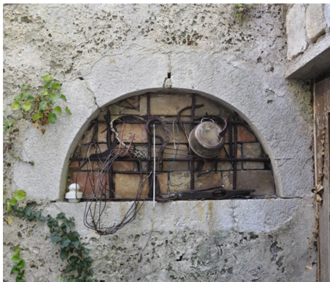
6. Sjevni prozor kapele Sv. Klare