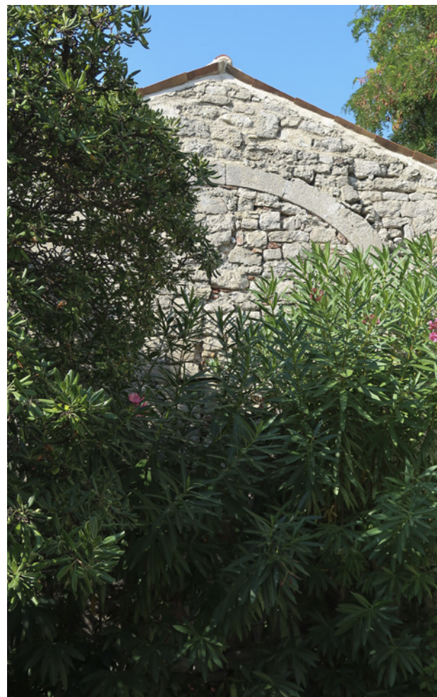
7. Ostatci zazidanog luka kapele Sv. Klare, pogled iz dvorišta prema zapadu

Remains of the walled arch of the chapel of St Clare, view from the courtyard to the west