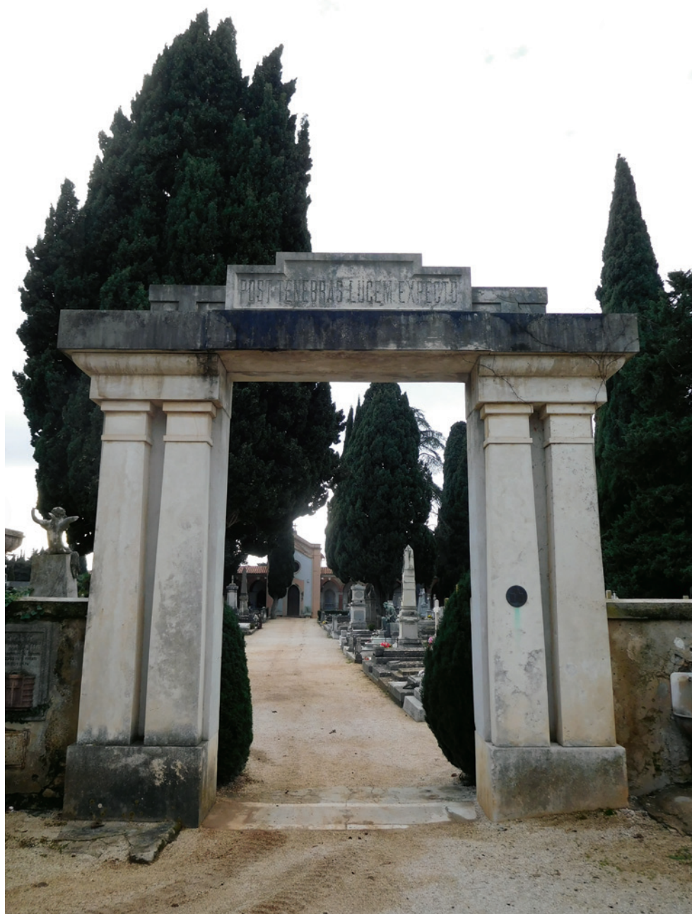
SLIKA 2. Zadar, Gradsko groblje, portal