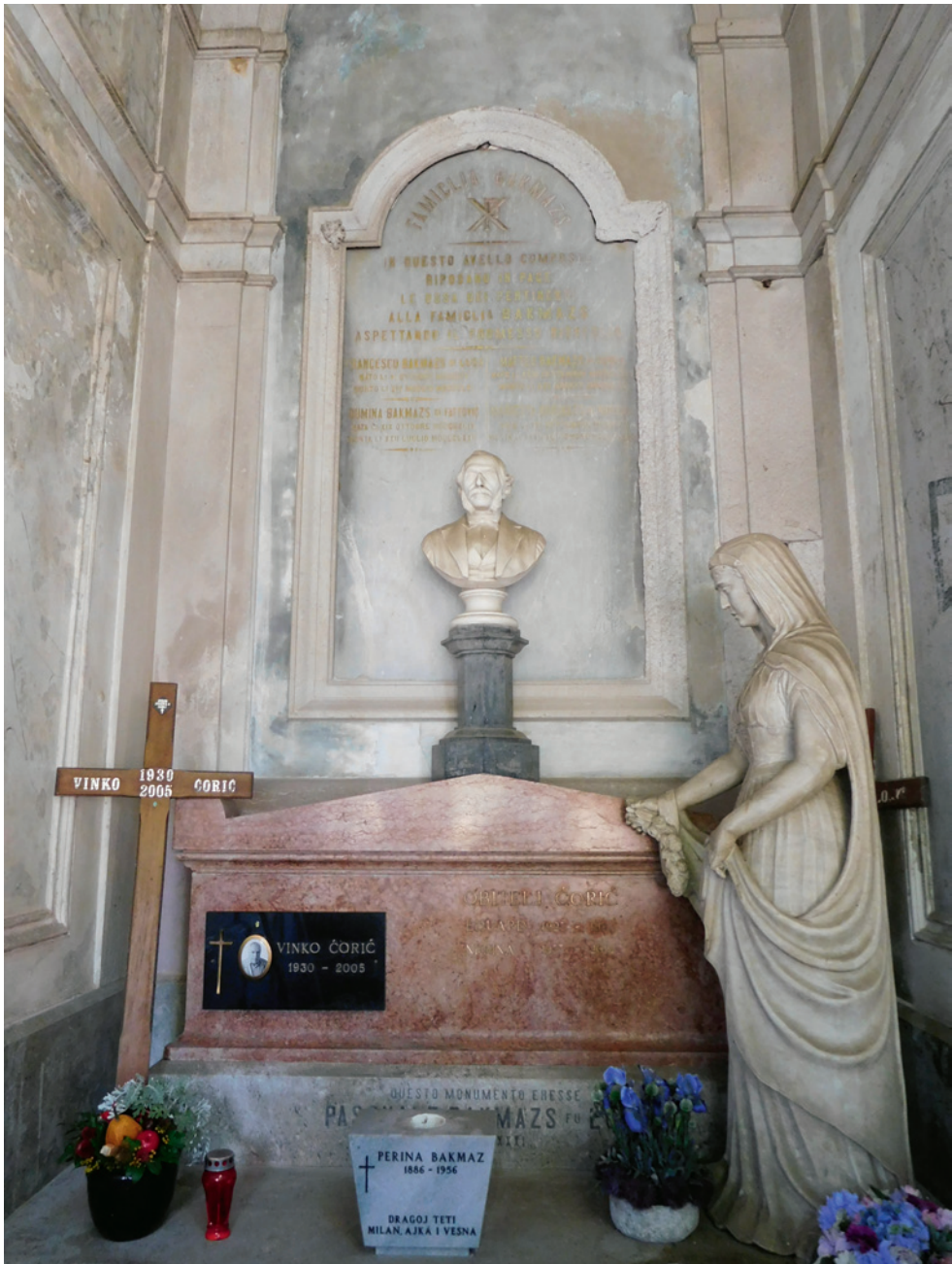
SLIKA 5. Zadar, Gradsko groblje, kapela obitelji Bakmaz, unutrašnjost