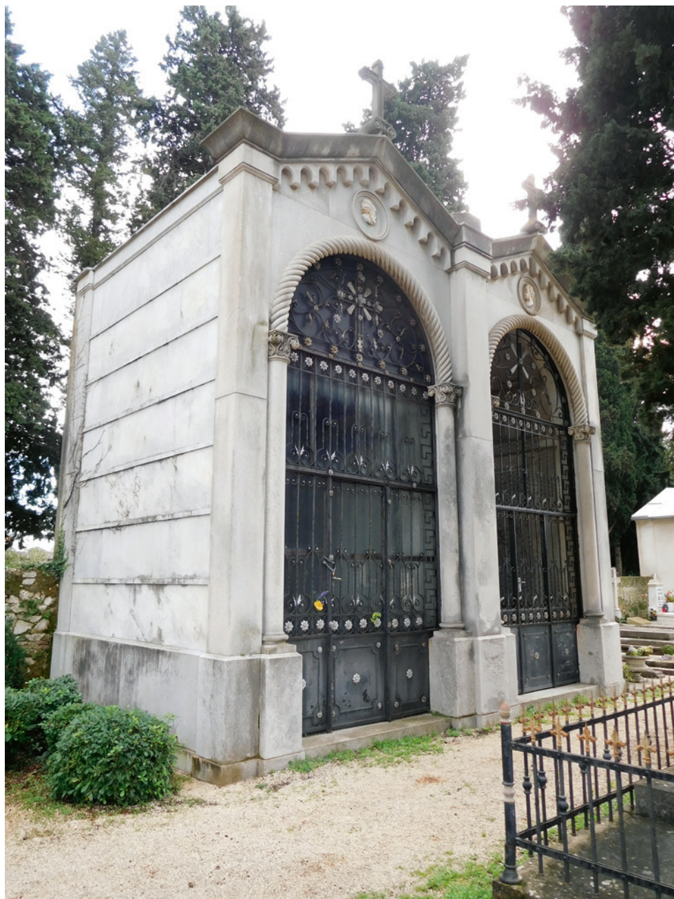
SLIKA 4. Zadar, Gradsko groblje, kapele obitelji Perlini i Bakmaz