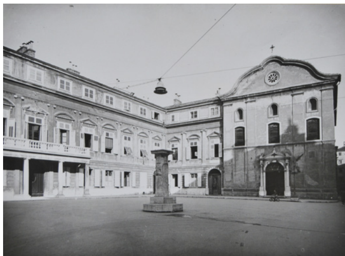
7. Pročelje crkve Sv. Jeronima i zgrada Municipija, Chiesa di S. Girolamo, Piazza del Municipio , 1940.

Façade of the church of St Jerome and the Municipium building, Chiesa di S. Girolamo, Piazza del Municipio , 1940