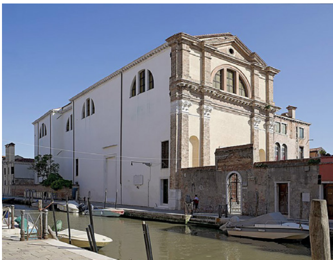
11. Venecija, pročelje crkve S. Girolamo

Venice, façade of the church of S. Girolamo