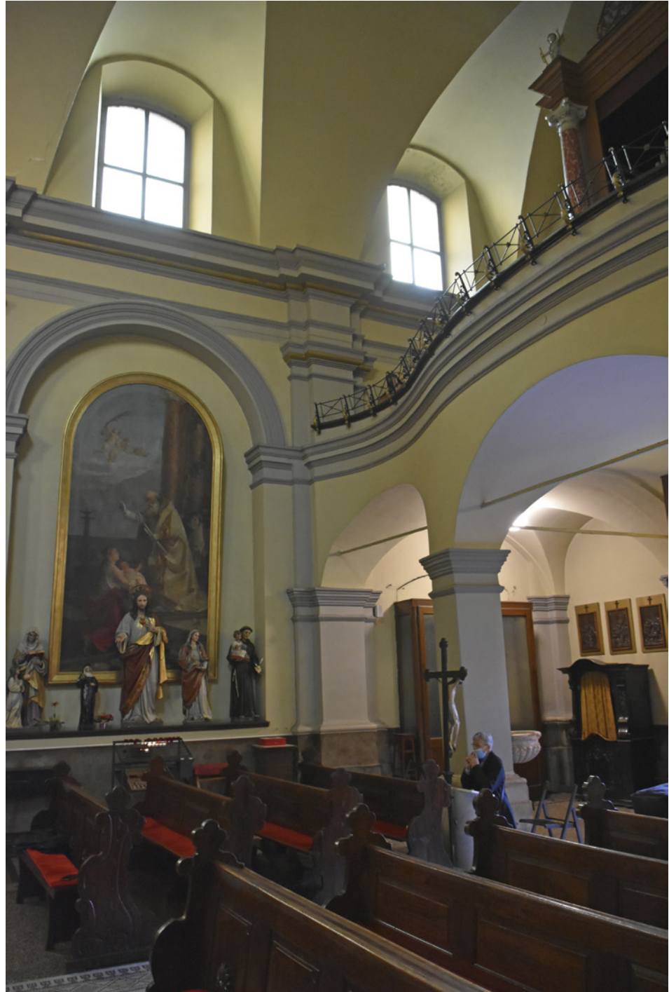
6. Ograda pjevališta crkve Sv. Jeronima Choir railing in the church of St Jerome

diskretno se ističe oblikovanjem, povijena ograda pjevališta mekano ulazi u prostor, a naglašena je profilacijama na vrhu kao i tamnijim nosačima (sl. 6). Krivulja je prisutna i na novom pročelju. U donjem dijelu raščlanjenom pilastrima je portal uokviren edikulom sa stupovima na visokim postamentima koji nose gređe i prekinuti segmentni zabat, a dovratnici lučni nadvoj nad kojim je trokutasti zabat (sl. 7). Posebno se ističe kvalitetno oblikovana ograda nad vratima od kovanog željeza sa stiliziranim povijenim viticama poput rocaille (sl. 8). Pročelje zaključuje zabat