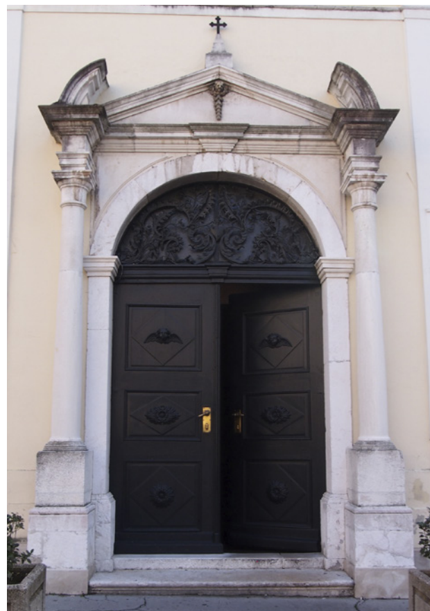
8. Portal crkve Sv. Jeronima

Façade of the church of St Jerome and the Municipium building, Chiesa di S. Girolamo, Piazza del Municipio , 1940