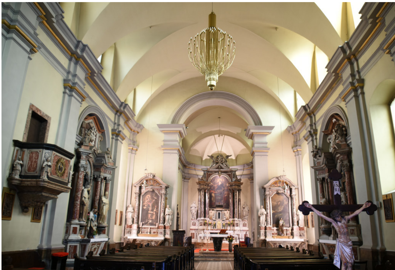
4. Brod crkve Sv. Jeronima