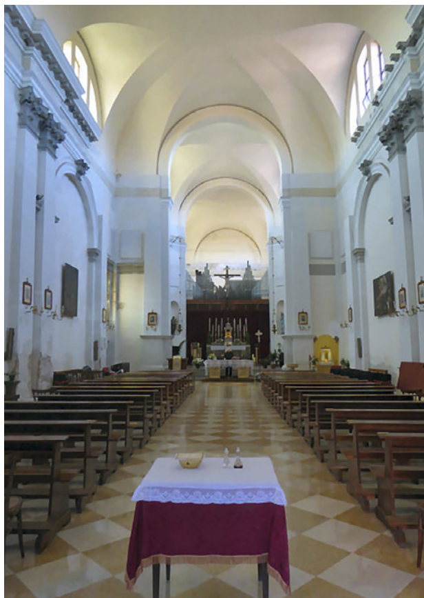
12. Venecija, unutrašnjost crkve S. Girolamo

Venice, façade of the church of S. Girolamo